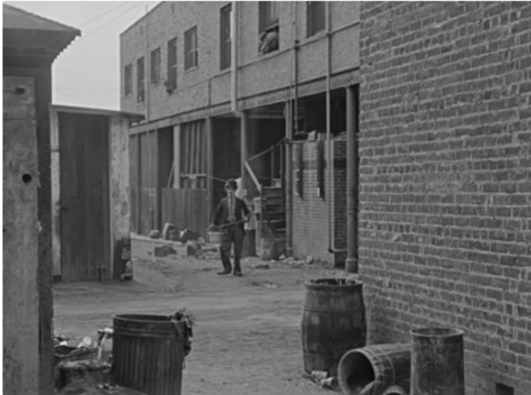
Pojavljivanje i dolazak Skitnice