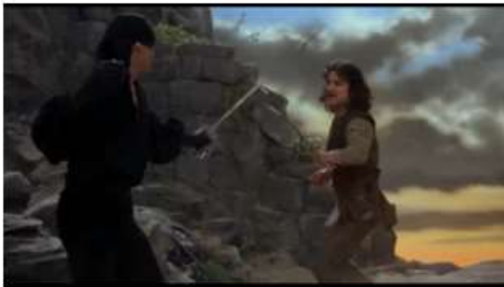
Gospodar Prstenova: Povratak kralja (2003.)