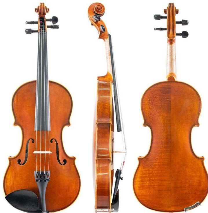
Slika 1. Violina

Violina pripada skupini žičanih gudačkih instrumenata. Najmanjih je dimenzija i najvirtuozniji je instrument od skupine gudača. Za vrijeme sviranja drži se na ramenu i pridržava bradom na naslonu (Samaržija, 2017). Izrazito je zanimljiv instrument koji postoji već nekoliko stoljeća. Krhkog izgleda, strukturalno se nije drastično mijenjala već dugo vremena čime je dočarano savršenstvo njenog dizajna, i kao glazbenog instrumenta i kao vizualno prekrasnog predmeta. Za određene dijelove violine koristi se određena vrsta drveta