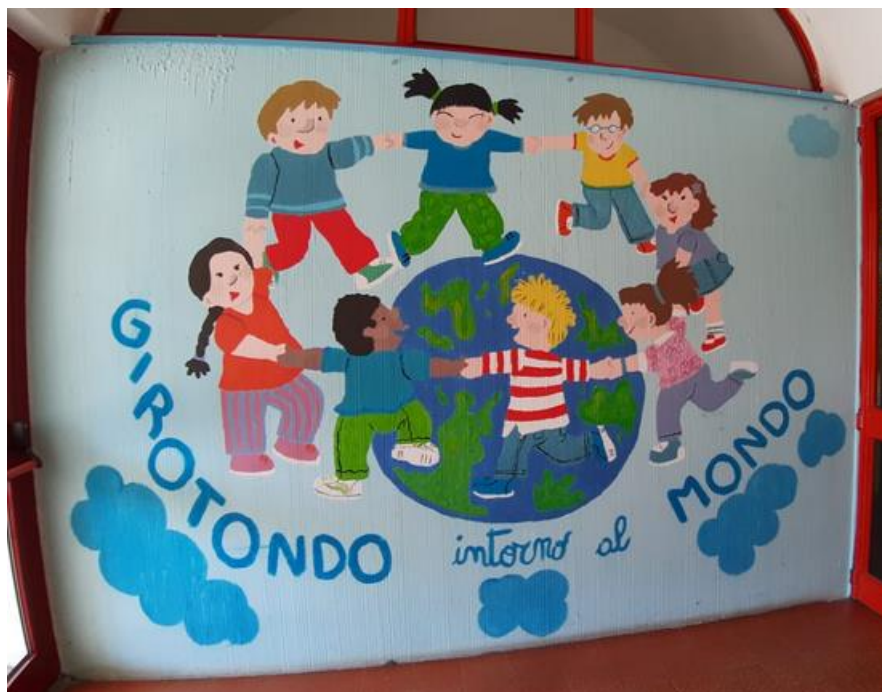
Slika 4 Ulaz u DV Scuola dell' infanzia Girotondo

Za razliku od DV Kalimero, dječji vrtić Scuola dell' infanzia Girotondo je talijanski vrtić u Umagu u kojem se cijeli program provodi na talijanskom jeziku i pismu ( https://www.girotondo-umag.hr/ ) (Slika 4).