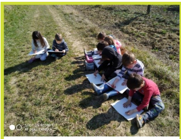
Slika 3 Sudjelovanje djece u okviru projekata vezanih uz prirodu koji su provedeni u mješovitim talijanskim skupina DV Kalimero.

DV Kalimero je također sudjelovao u nekim projektima u kojima se promicala multikulturalnost. Cilj tih projekata je bio da se kroz razne aktivnosti djeca upoznaju s različitim kulturama, običajima, jezicima i državama. Osim projekata vezanih uz promicanje multikulturalnosti, DV je proveo i dva projekta koja su provedena u mješovitim talijanskim skupinama, a bila su vezane uz prirodu; „Osjetila prirode“/ „I sensi della natura“ i „Istražujemo prirodu“/„La scienza in natura“ te je njihov cilj bio da neposrednim doticajem s prirodom u djeci pobude znatiželju te potaknu djetetov cjeloviti rast i razvoj (Slika 3).