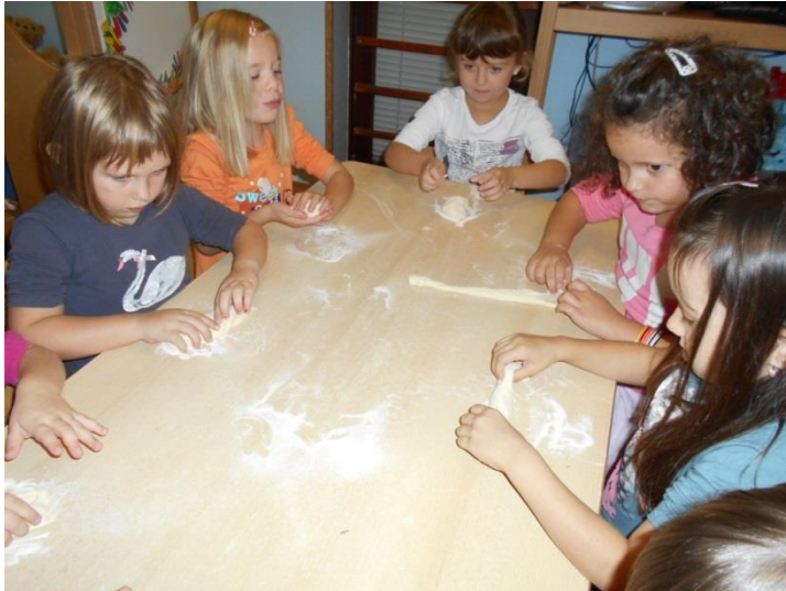
Slika 6 Polaznici DV Ferde Mravenca izrađuju tijesto