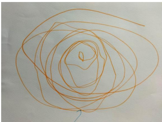
Slika 5. Krug – flomaster (dječak, 3 godine)

Dijete s tri godine već može vrlo spretno držati olovku i baratati njome, potpomažući si pridržavanjem papira drugom rukom. Tijekom crtanja možemo primijetiti da dijete pridaje više pažnje rasporedu onoga što crta, a čini to većim brojem raznolikih tragova. Prvi simbol koji se pojavljuje u ovoj fazi dječjeg crtanja jest krug (Belamarić, 1987).