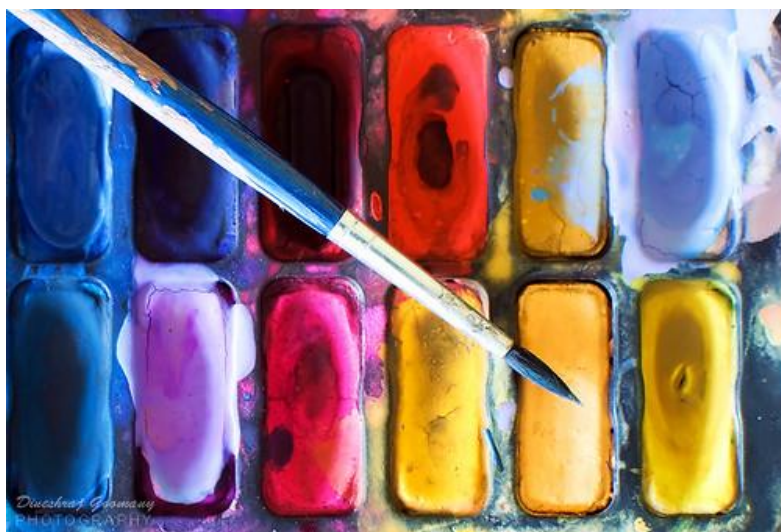
Slika 10. Vodene boje i kist za akvarel

dobivaju zanimljive razlivene mrlje i efekte miješanja boja. Autorica Višnjić Jevtić (Višnjić Jevtić i sur., 2010) ističe kako je akvarel glavna umjetnička aktivnost djece u Waldorfskim školama, a i u mnogim drugim ustanovama. Akvarel je, vjerojatno, najprimjenjivija slikarska tehnika u likovnim aktivnostima predškolske djece, a prikladna je već od najranije dobi. Djeci valja ponuditi različite formate i veličine papira i različite debljine kistova, ovisno o motivu slikanja. Akvarel se može dobro kombinirati s različitim crtačkim tehnikama poput tuša, flomastera, olovke, a isto tako i s drugim slikarskim tehnikama poput pastela ili kolaža (Jakubin, 1990).