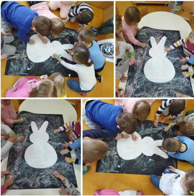
Slika 15. Zeko u kredi

tehnika je crtanje kredom. Potrebni materijali za izvođenje aktivnosti jesu: papir u crnoj boji i kreda. Površina koja je trebala predstavljati oblik zeca bila je prekrivena, a djeca su ispunjavala okolni prostor na plakatu. Likovnoj aktivnosti prethodila je priča: „Lupko je pronašao jaje“ naklade EGMONT. Kreda je omiljena tehnika ove jasličke skupine, a djeca su ovdje imala priliku po prvi puta istu upotrijebiti na papiru na način popunjavanja površine tonovima. Odaziv djece bio je velik, a aktivnost im je bila zanimljiva, kredu su me tražili i prilikom boravka na zraku. U idućoj izvedbi ove aktivnosti svakom bih ponudila vlastiti papir kako bi individualno uživali u tehnici crtanja kredom.