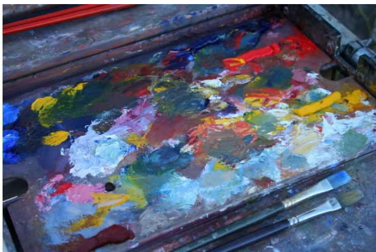
Slika 9. Tempere u drvenoj paleti i kistovi za tempere

Tempera je tehnika slikanja posebnim bojama koje se razrjeđuju vodom. Mješanje boja aktivnost je koja prethodi slikanju (Višnjić Jevtić, 2010). Boje su napravljene od mrvljenih pigmenata dobivenih od različitih ljepljivih tvari. Tempere su boje topive u vodi do trenutka sušenja na papiru. Jednom kad se osuše, više se ne tope u vodi. To svojstvo omogućava slojevito nanošenje boje i veliku raznolikost likovnog izraza ovom tehnikom. Temperom se može slikati na raznim podlogama poput papira, platna, drveta ili stakla zbog njenog dobrog prijanjanja. Tonovi tempere na podlozi su bez sjaja i nisu nijansirani pa je poželjno sliku nakon sušenja boje, premazati uljem što ju ujedno i čuva. Svojstva tempere i jednostavnost korištenja čine ju tehnikom dječjeg istaživanja kombinacija i miješanja boja. Za slikanje temperom pogodni su tvrdi glatki ili nešto hrapaviji papiri (Jakubin, 1999).