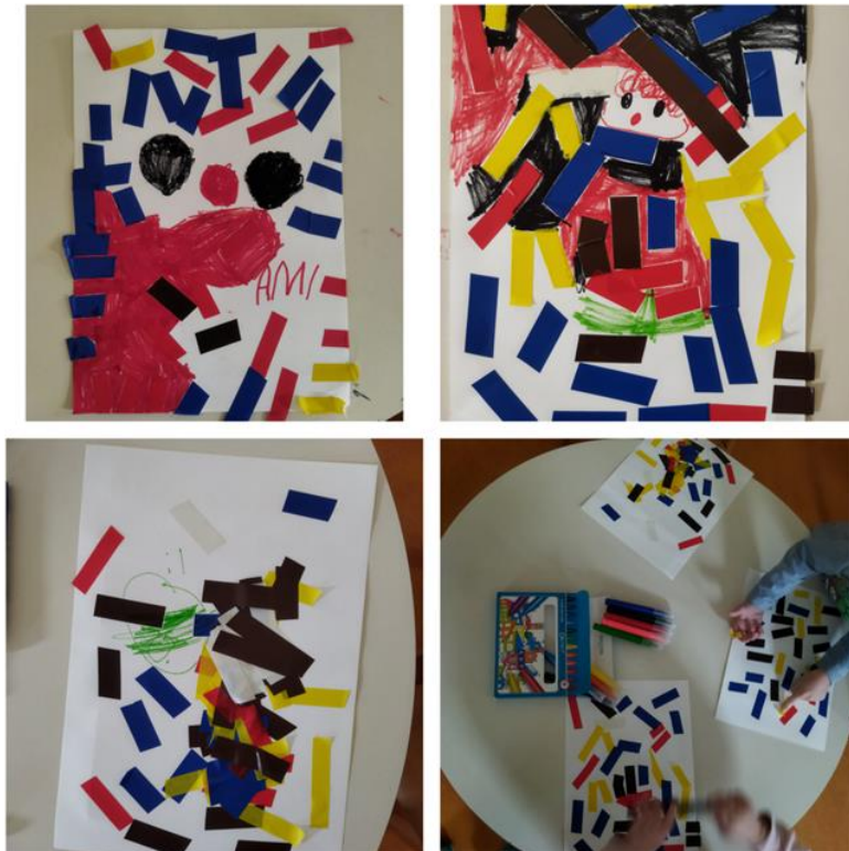
Slika 19. Kolaž traka i flomaster – individualni rad