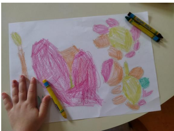
Slika 8. Cvijeće i srce – pastel (djevojčica, 3 godine)