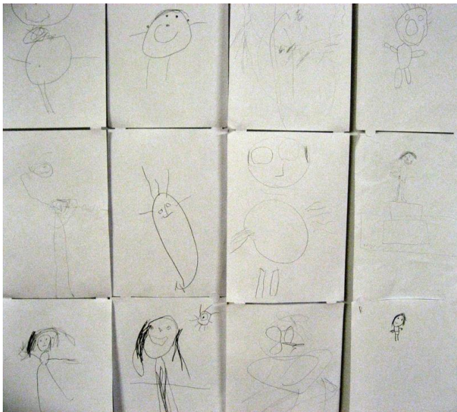
Slika 7. Dječji crteži olovkom

(Jurković i sur., 2010). Za crtanje olovkom, potrebno je poznavati različite vrste olovaka te njihove karakteristike. Olovke se dijele na tvrde, srednje i mekane, a tvrdoća ovisi o sastavu, odnosno omjeru gline i grafita u olovci. Olovke s većim udjelom grafita masnije su i mekše. Tvrdoća olovaka označena je brojem i pripadajućim slovom H za tvrde olovke i B za meke. Tvrde olovke pogodne su za korištenje kada trebamo dobiti fine i oštre linije, primjerice u arhitektonskom crtežu, a za crtanje su pogodnije mekane olovke. Mekana olovka pruža mogućnost postizanja tonske modulacije – skale tonova od blijede do duboke crne. Za malu djecu je prikladno crtanje s mekanim olovkama oznake 6B ili mekše jer one ostavljaju tamniji, djeci vidljiv trag na papiru, dok starija djeca mogu crtati olovkama različite tvrdoće i svjetline. Izvedba ovisi i o vrsti papira koja se koristi za crtež, a to mogu biti različite vrste papira – tanki, debeli, glatki, hrapavi, bijeli ili u boji (Jakubin, 1990).