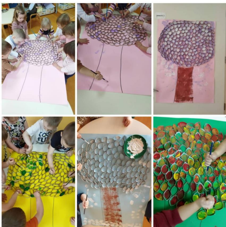
Slika 16. Stabla od kartona