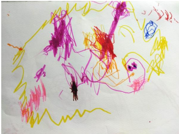
Slika 4. Crtež – flomaster (dječak, 3 godine)

Pojava slučajnog crteža pomaže u razvoju kontroliranih pokreta olovke koji se počinju javljati tek oko treće godine djeteta. Oko treće godine djeca počinju imenovati svoje crteže koji se još uvijek čine kao neuređen skup jednostavnih linija i simbola, ali počinju se nazirati tragovi ideje. (Belamarić, 1987) Imenovanje svojih likovnih djela važno je za razvoj mišljenja kod djeteta. Crtež uglavnom započinje spontano, no spontano nastale linije i oblici daju ideju djetetu za razvoj novog likovnog uratka.