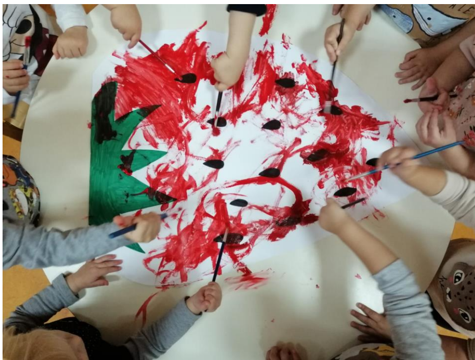
Slika 2. Timski rad – oslikavanje jagode