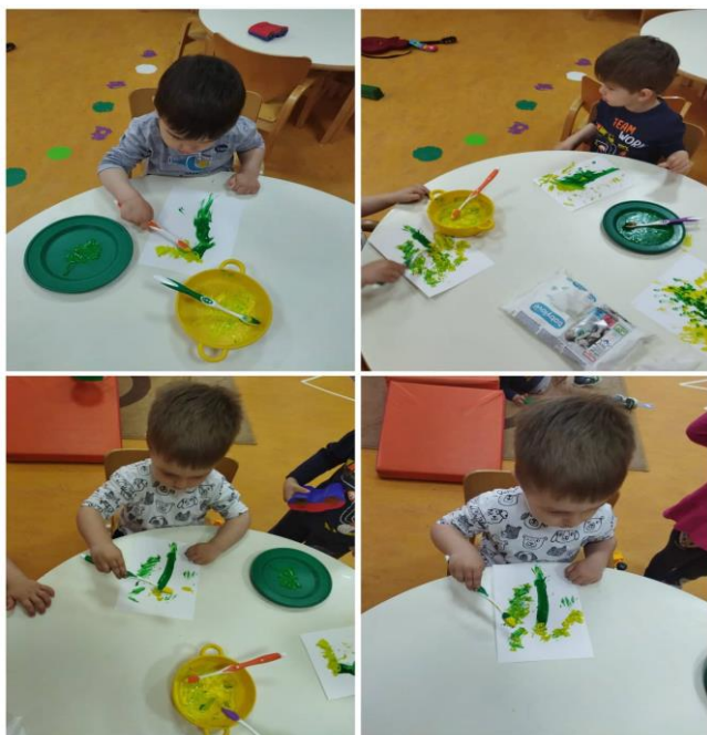
Slika 12. Slikanje četkicama za zube