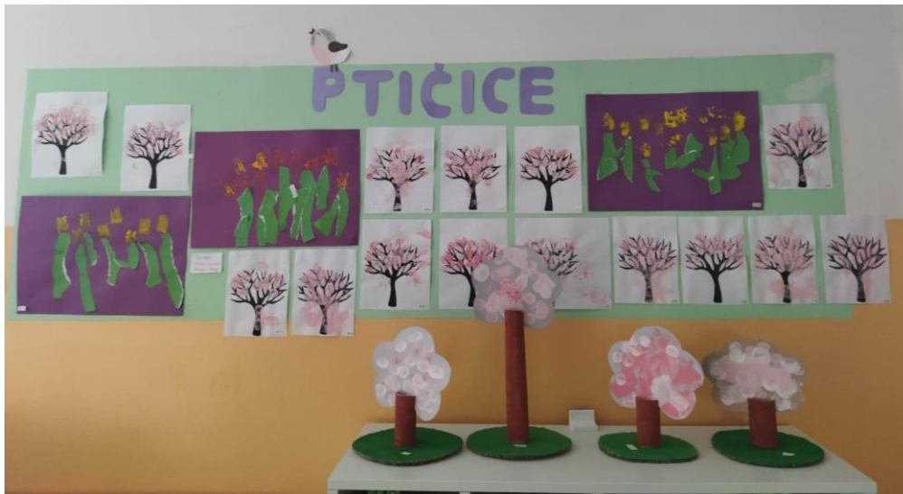
Slika 1. Jaslička skupina „Ptičice“ – likovni radovi

U sedmom poglavlju predstavljene su neke od likovnih aktivnosti provedenih u jasličkoj skupini „Ptičice“, u Dječjem vrtiću Vrtuljak u Zaprešiću.