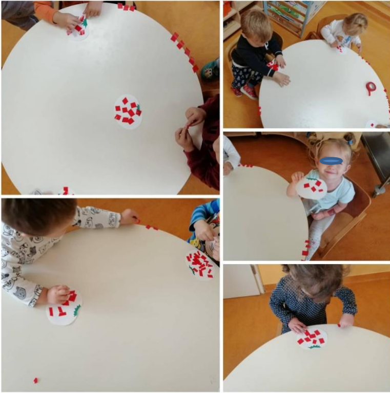
Slika 18. Kolaž traka – individualni rad