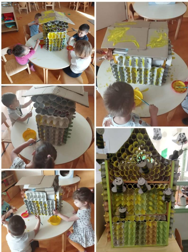
Slika 17. Košnica od kartonskih tuba i kutija za jaja