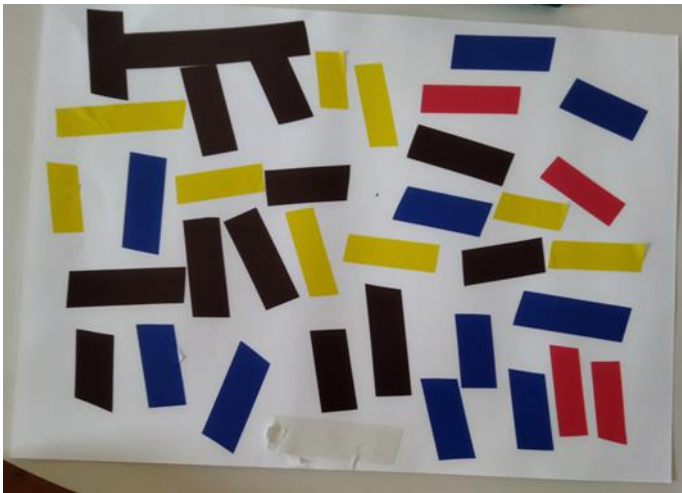
Slika 11. Kolaž

Kolaž je interesantna likovna tehnika za koju se upotrebljavaju razni materijali kao sredstva likovnog izražavanja. Materijali mogu biti razne vrste papira u svim bojama, izresci iz časopisa ili novina, fotografije, brusni papir, stari likovni radovi, tekstil ili koža, a upotrebljavaju se rezanjem ili trganjem na komadiće te lijepljenjem na neku podlogu (Jakubin, 1990). Tehnika kolaža je izrazito zanimljiva i prikladna djeci predškolske dobi jer omogućava manipuliranje raznovrsnim materijalima i njihovim teksturama, bojama i motivima. Ova tehnika pruža neograničene mogućnosti kombiniranja i komponiranja i pozitivno utječe na razvoj kreativnog razmišljanja i likovne domišljatosti (Višnjić Jevtić i sur., 2010).