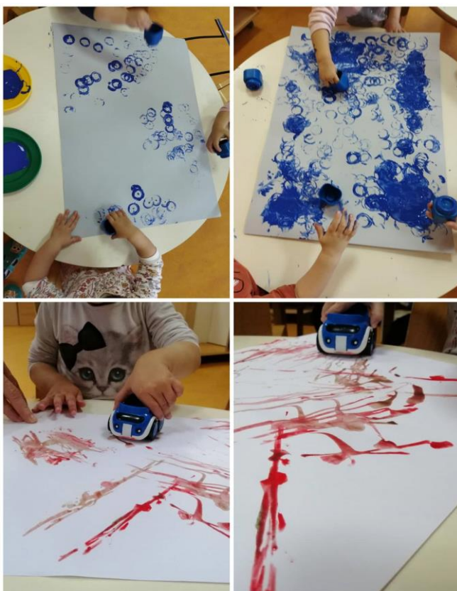
Slika 13. Slikanje autićima i kockicama