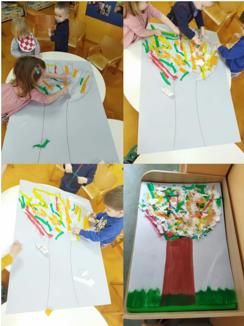
Slika 20. Kolaž traka i trgani papir – grupni rad