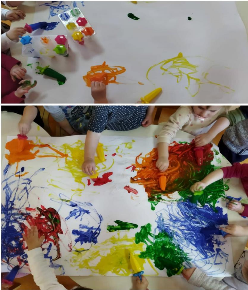
Slika 14. Slikanje ledom