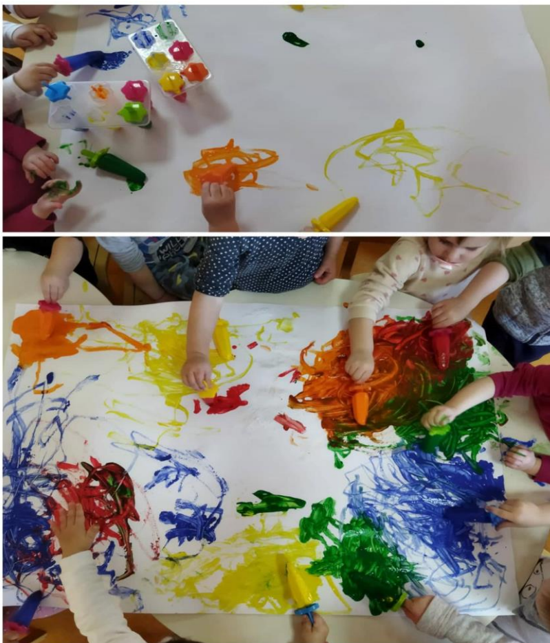
Slika 14. Slikanje ledom