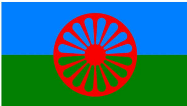
Slika 1: Romska zastava