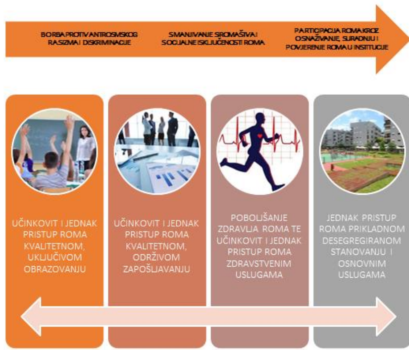
Slika 6: Ciljevi Nacionalnog plana za uključivanje Roma, za razdoblje od 2021. do 2027.

(Nacionalni plan za uključivanje Roma, za razdoblje od 2021. do 2027. godine, 2021.)