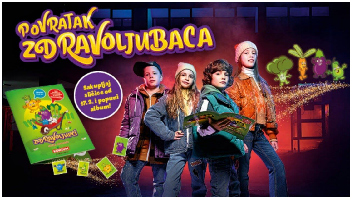
Slika 1. Reklama Povratak Zdravoljubaca

( https://www.tportal.hr/lifestyle/clanak/konzum-s-veseljem-najavljuje-povratak-zdravoljubaca-20220211 )