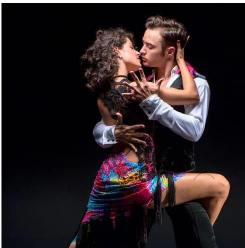
Slika 4. Bachata

Bachata je ples koji potječe iz Dominikanske republike i poznata je po tome što je senzualnija od primjerice salse (Young, bez dat.). Također, smatra se sporijim i romantičnijim plesom koji se pleše u rasponu 108 i 152 BPM (Young, bez dat.). Držanje u bachati je bliže nego u salsi, a karakteristični su pokreti gornjeg dijela tijela i bokova. Postoji nekoliko stilova bachate, a to su: dominikanska, Sensual bachata, Urban Bachata ili Bachata fusion (Young, bez dat.).