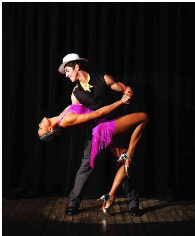
Slika 2. Salsa na 1

Salsu na 1 poznatu i kao salsa u stilu LA razvila su braća Vazquez prateći oštre udarce u glazbi i pokrete (Campbella, 2019). Brojanje u salsi je od 1 do 8 na način: 1-2-3, 5-6-7 s tim da se na taktovima 4 i 8 ne rade koraci, već se taj dio smatra sporim dijelom ritma salse. Tendencija razmišljanja o ritmu salse jest da se ritam veže na brojeve na način brzo-brzo-sporo, brzo-brzo-sporo. Nadalje, prijelomni koraci (kreće se naprijed/nazad, lijevo/desno...), događaju se na brojeve 1 i 5 (Campbella, 2019). Držanje plesača je malo razmaknuto, a karakteristični su pokreti ramenima i bokovima (Jain, bez dat.).