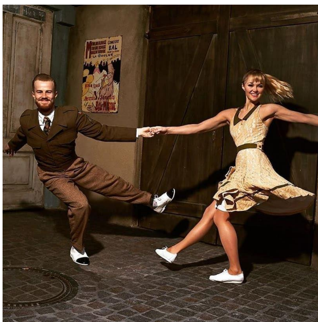
Slika 1. Rock and roll

Rock n' roll je novi stil zabavne glazbe koji se razvio na temeljima Jazz-a. nastao je sredinom 20. stoljeća u Americi, a vrlo brzo je preplavio i Europu. Tako se uz glazbu razvio i ples (Barac N., Barac R., 2008). Objašnjenje naziva ovog plesa je da „Rock“ na engleskom znači njihati ili ljuljati se, a „roll“ talasati, kružiti ili valjati se (Maletić, 1986). Kako bi plesači ovaj ples mogli pravilno izvesti na glazbu, potrebno je slušati ritam i naglašenost udaraca pa se tako kod ovog plesa uočava da su naglašeni drugi i četvrti udarac (Wainwright, 2007). Kada se pojavio u prvoj polovini četrdesetih godina prošlog stoljeća, među britanskom mladeži bio je popularan 'jitterbugging' za kojeg se smatra da je preteča rock n' rolla (Wainwright, 2007). Prihvaćajući novi ples, bend se smanjio s 14 članova na manje te se koncentracija svirača više okretala ritmičkim instrumentima. Analizirajući ritmove ovog plesa zaključuje se da rock n' roll upotrebljava jednostruke ritmove, a pleše se u neobaveznom otvorenom držanju (Wainwright, 2007).