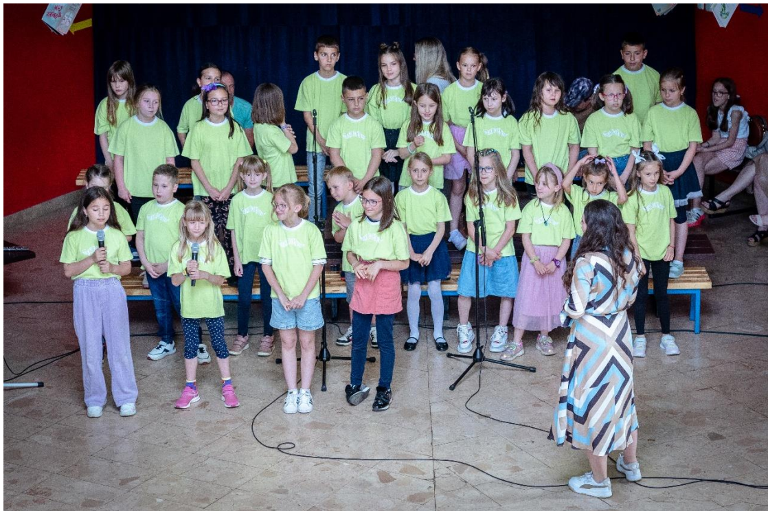
Slika 17. Pjesma Osjećaš li ljubav tu