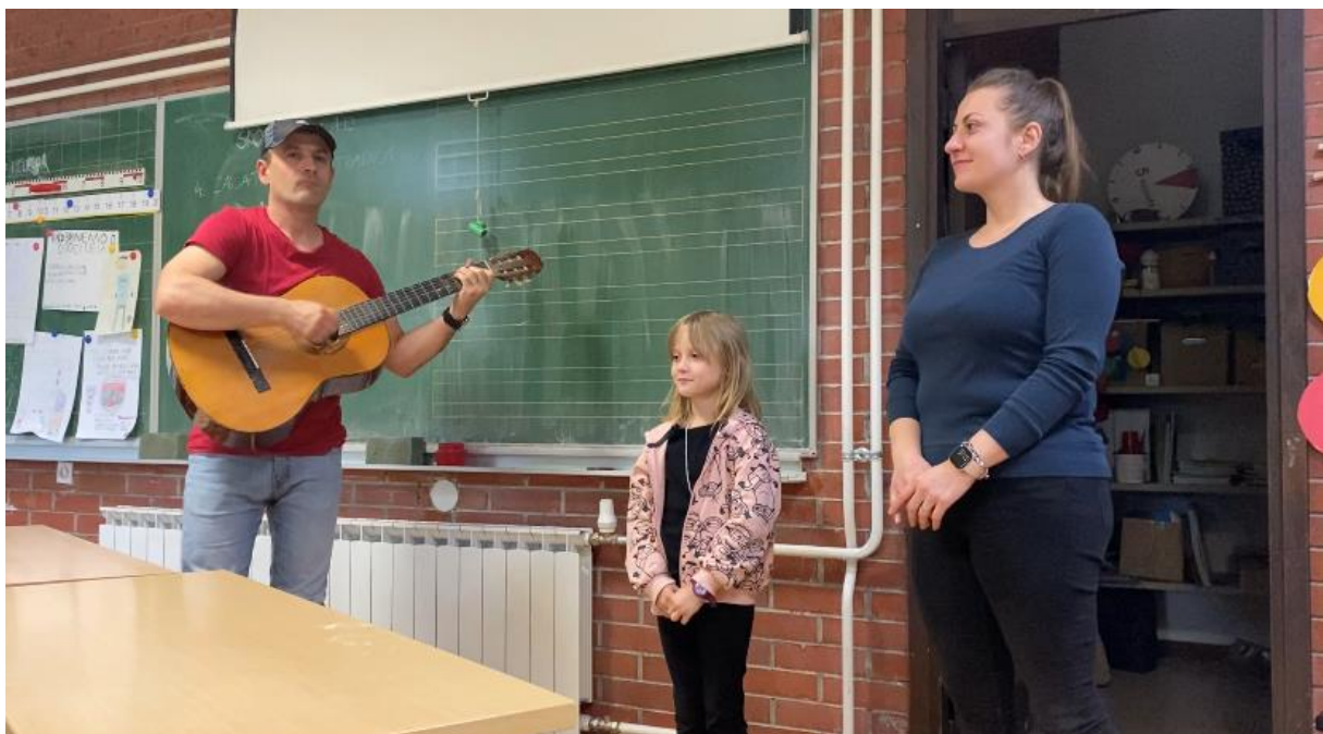
Slika 6. Obitelj pjeva pjesmu I want to know what love is

Druga obitelj se predstavila pjesmom I want to know what love is uz instrumentalnu pratnju tate na gitari.