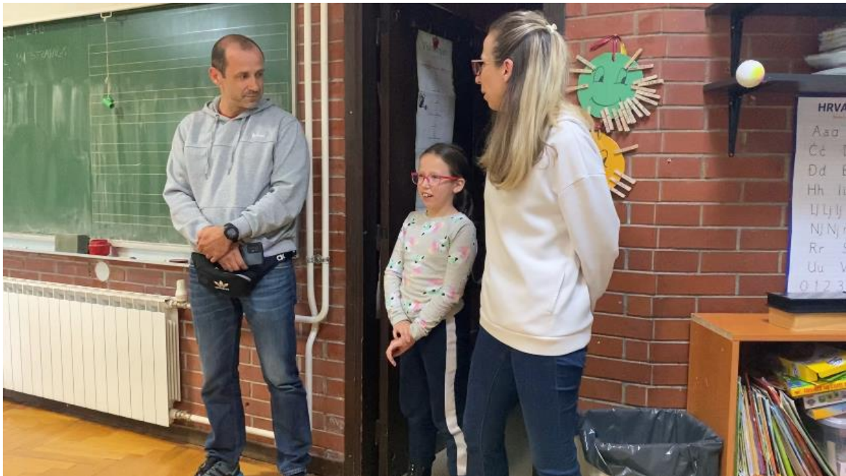
Slika 5. Pjesma tata kupi mi auto

Druga obitelj se predstavila pjesmom I want to know what love is uz instrumentalnu pratnju tate na gitari.