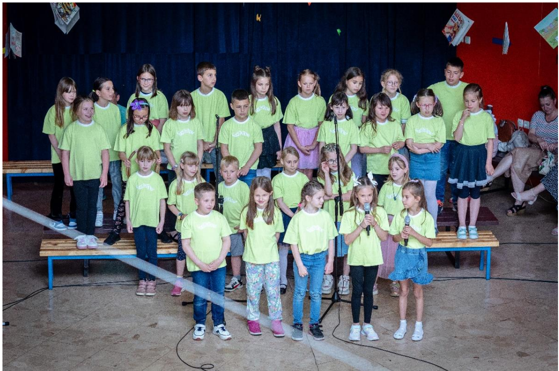
Slika 12. Recitacija učenika pjesme Roditeljska ljubav