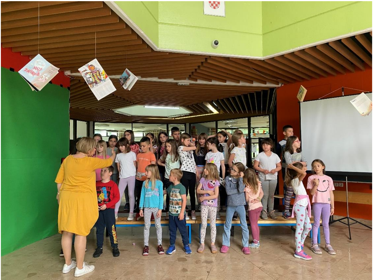
Slika 9. Generalna proba