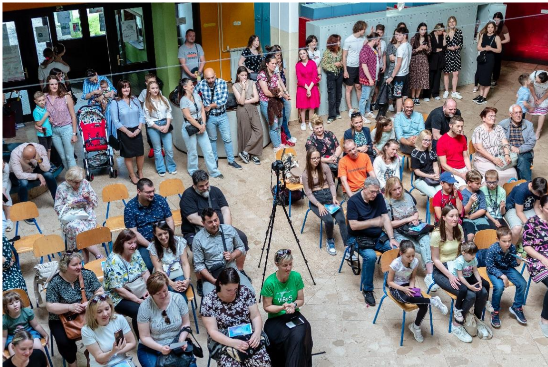
Slika 11. Publika

Gledalište je bilo puno. Školsko predvorje je izvrsno izgledalo postavljeno za pravu predstavu. Ravnateljica škole je otvorila program s nekoliko lijepih riječi te je sve bilo spremno za početak predstave.