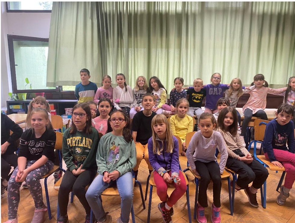
Slika 3. Učenici za vrijeme probe

Za kraj su učenici uz pratnju studentice ponovili pjesme Vjeruj u ljubav i Osjećaš li ljubav tu , uvježbavajući koreografiju. Pozvani su učenici koji su se prijavili pjevati solo dionicu kako bi pokazali svoje sposobnosti i mogućnosti.