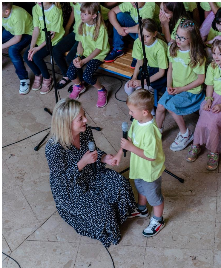
Slika 15. Mama sa sinom pjeva pjesmu Bimbo