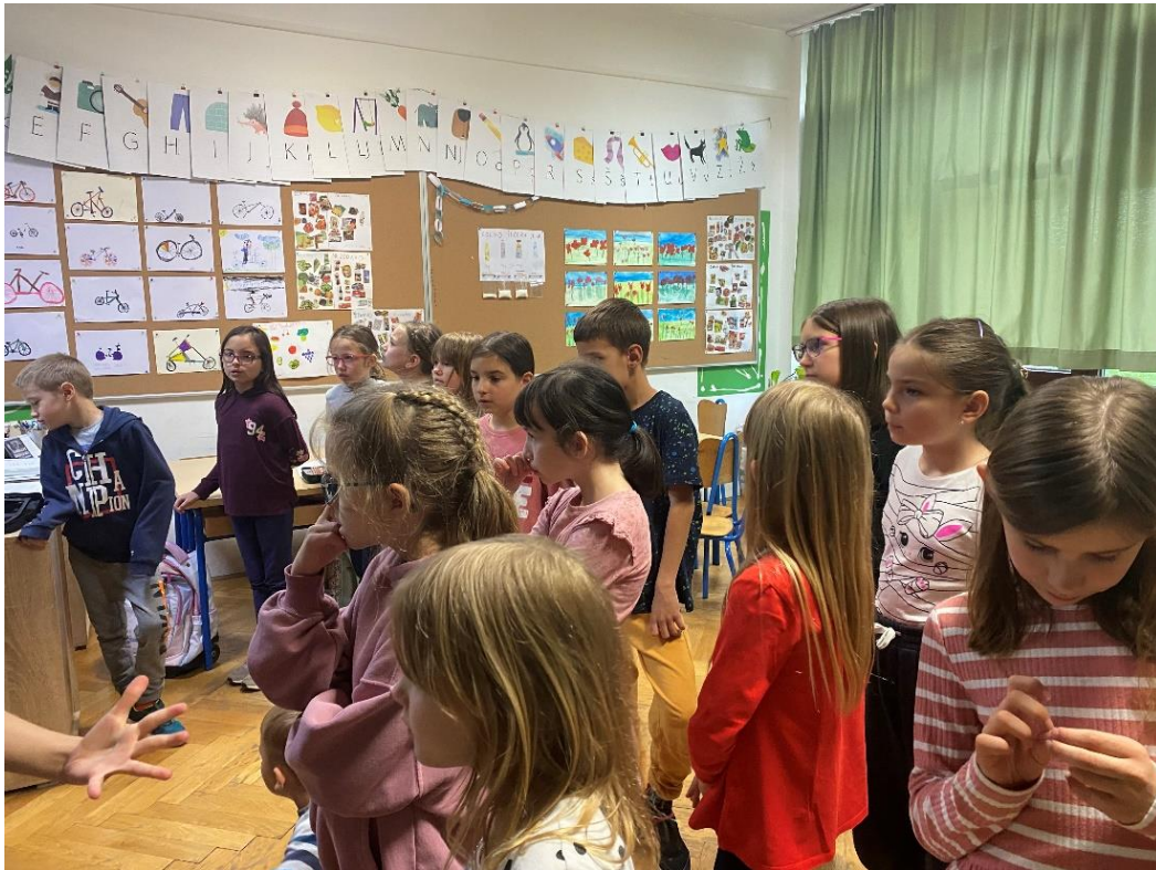
Slika 8. Učenci osmišljavaju koreografiju