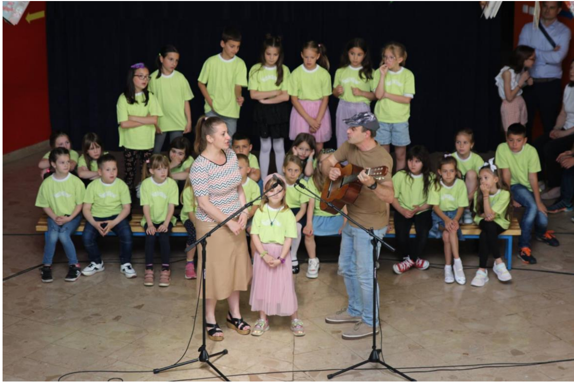
Slika 14. Obitelj se predstavila pjesmom I want to know what love is