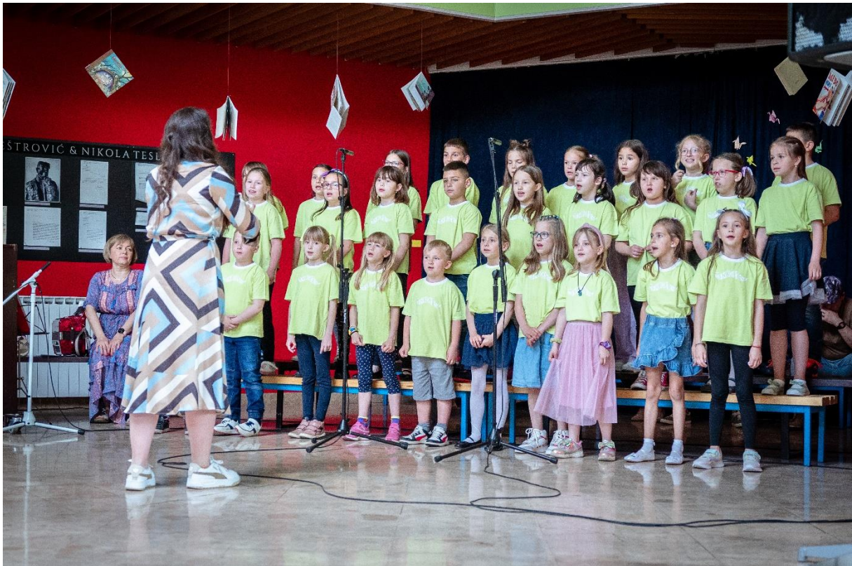
Slika 18. Završna pjesma Nek svud ljubav sja

Učenici su pjevali i ponašali se fantastično. Pokazali su svoju sreću, samouvjerenost i talent. Učiteljice i roditelji su ih bodrili iza pozornice i u gledalištu te pazili na disciplinu. Pri završetku predstave studentica je održala govor zahvale svima koji su sudjelovali u ostvarenju ovog projekta.