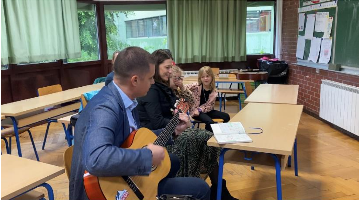
Slika 7. Obitelj pjeva pjesmu O Marijana

Treća obitelj je otpjevala pjesmu O, Marijana uz značenje da je majčino ime Marijana te da za nju pjevaju pjesmu, a sve su zaokružili instrumentalnom pratnjom gitarom.