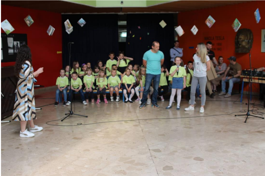
Slika 16. Obitelj se predstavila pjesmom Tata, kupi mi auto