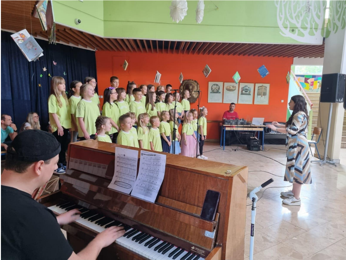
Slika 13. Otvaranje predstave s pjesmom Vjeruj u ljubav