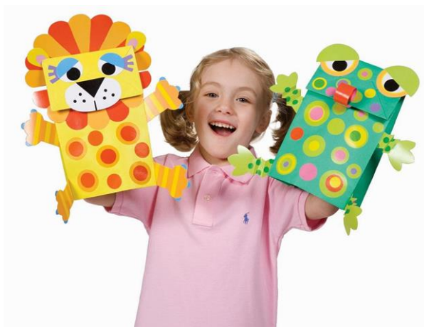
Papirnata lutka zijevalice