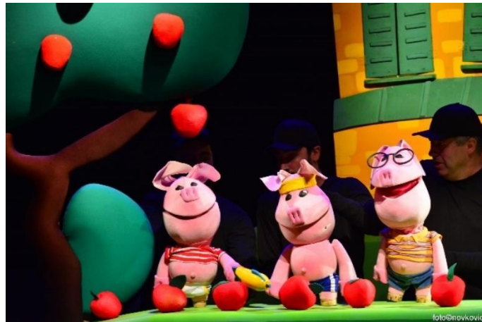
Lutke zijevalice u predstavi Tri praščića