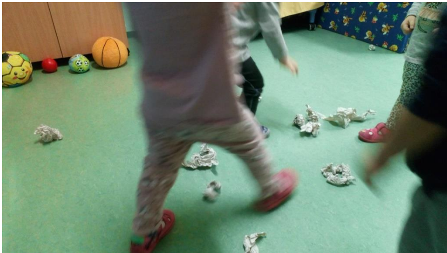
Slika 6. Igra papirom – grudanje (autorski rad)