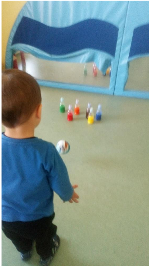
Slika 5. Igra kuglane