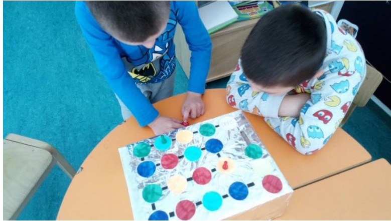
Slika 3. Društvena igra „Uspješno do semafora“ (autorski rad)