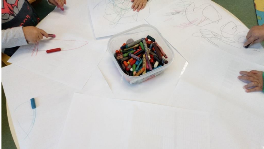
Slika 7. Crtanje pastelama (autorski rad)