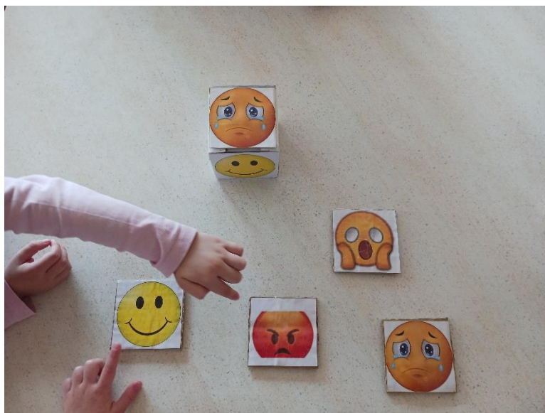
Slika 1. Igra s kockom i karticama osjećaja (autorski rad)

Putem slikovnica odgojitelj također može djelovati na razvoj socijalnih vještina, primjeri takvih slikovnica su Figaro – mačak koji je hrkao , Dugine boje , Juha od bundeve , kao i putem društvenih igara. Igrajući društvene igre djeca uče gubiti, uče čekati na red, primjeri takvih igara su Čovječe ne ljuti se , Memory , Mlin , Uspješno do semafora . Odgojitelj u sobi odgojne grupe treba oformiti razne centre aktivnosti koji će omogućiti djeci druženja u manjim grupama, centre u kojima će djeca razvijati suradnju, govor, kreativnost, rješavanje problema.