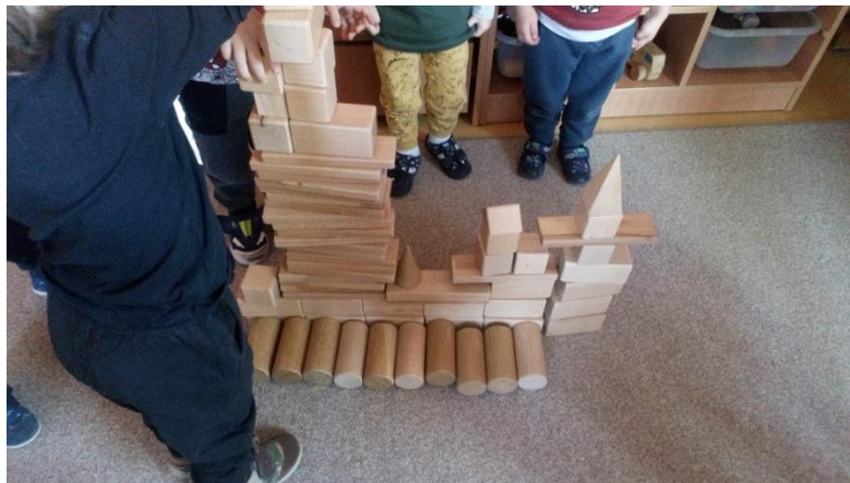
Slika 4. Centar građenja u sobi odgojne grupe (autorski rad)

Odgojitelji trebaju djeci skrenuti pozornost na osjećaje drugih kako bi razvila predviđanje reakcije i osjećaja drugih na različite događaje. Odgojitelji mogu poslužiti i kao model za predviđanje osjećaja drugih. Odgojitelji agresivnoj djeci mogu pomoći i poticanjem alternativnih interpretacija tuđeg ponašanja. Agresivna djeca odmah drugima pripisuju agresivne namjere. Ali djeca, kad im se pomogne istražiti alternativne namjere koje leže u pozadini neugodnih postupaka druge djece, promijene stajališta i smanje svoju sklonost reagiranja bijesom. Djeci također treba pomoći razviti umijeća pregovaranja i kompromisa (Katz i McClellan, 1999).