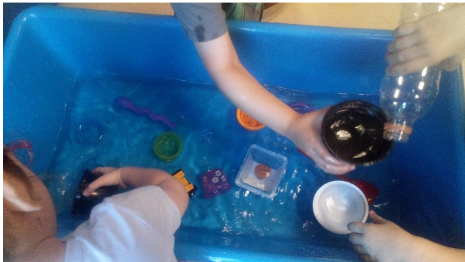
Slika 8. Igra vodom u sobi odgojne grupe (autorski rad)

Lutka ima važnu odgojnu i obrazovnu ulogu, i poticatelj je kreativnog izražavanja kod djece. Odgojitelji u vrtićima trebaju znati kako poticati dječji razvoj uz pomoć lutke. Djeca u grupi u kojoj odgojitelji vrlo često koriste lutku u radu, više su prosocijalna, a manje agresivna, u odnosu na djecu u grupi u kojoj odgojitelji vrlo rijetko primjenjuju lutku u radu. Lutke pomažu djeci razviti sposobnost razumijevanja stvari iz raznih perspektiva, a to je uvjet za socijalni i emocionalni razvoj djece (Hicela i Sindik, 2011). Dijete počinje oponašati roditelje već na kraju prve godine života, dok u drugoj godini oponaša izgovor riječi, te tako usvaja govor. U predškolskoj dobi dijete oponaša različite aktivnosti odraslih pa time također uči. Oponašanje se nastavlja kasnije u djetinjstvu, u mladosti, i u odrasloj dobi. Njime dijete usvaja znanja i