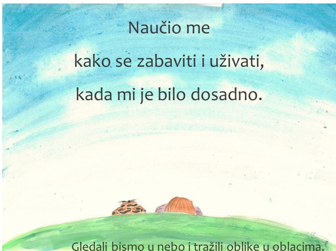
Slika 9. Sedma stranica slikovnice „Ti i ja“