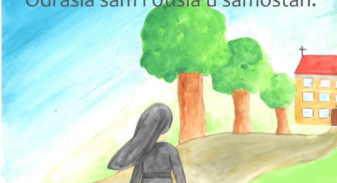
Slika 16. Četrnaesta stranica slikovnice „Ti i ja“