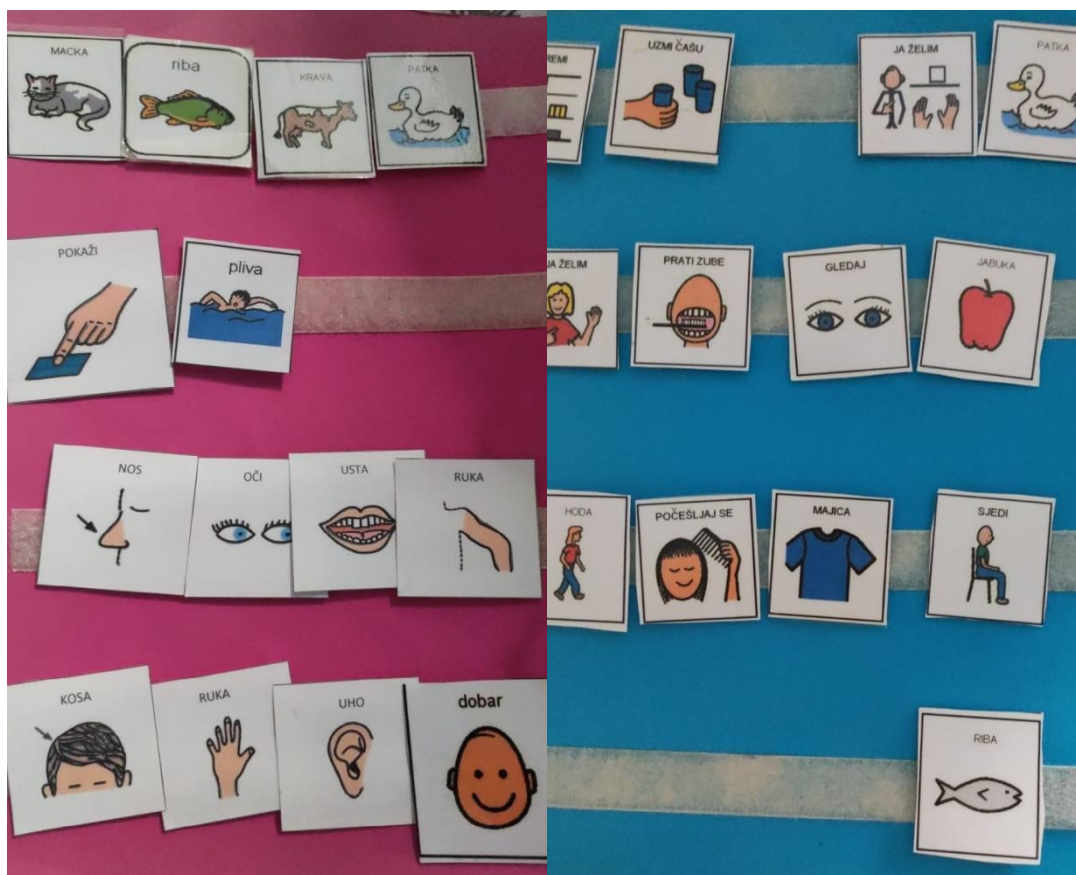
Slika 1. Dječakova komunikacijska ploča

Iščitavanjem psihološkog nalaza R. K.-a, dječak koristeći PECS metodu koristi jednostavne geste pokazivanja, neke znakove, služi se sa slikama te pokazuje razumijevanje naloga, svakodnevnih situacija i jednostavnih pitanja. Protokol PECS je razvijen s ciljem da potakne djecu s poteškoćama spontanom komuniciranjem kako bi izražavala svoje potrebe i želje (Park, 2009). Ova metoda je posebno namijenjena osobama s složenim komunikacijskim potrebama koje imaju razvojne teškoće i ne mogu se služiti govornim jezikom i/ili imaju izazove u jezičnom razumijevanju.