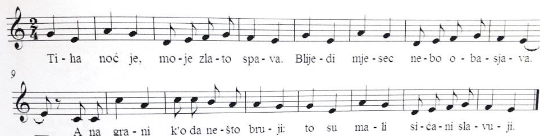
Slika 18. Pjesma Tiha noć je (Gospodnetić, 2015, str. 447)