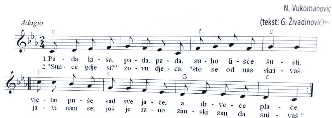
Slika 16. Pjesma Jesenja kiša (Gospodnetić, 2015, str. 434)