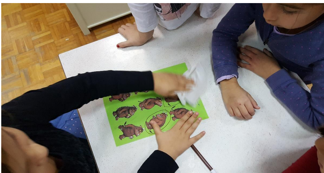
Slika 7: Igra „Uočavanje sličnosti i razlika 2“

Treća igra u stolno – manipulativnom centru djeca su između 9 sličica grubzona trebali zaokružiti dvije iste sličice grubzona. Također markerom na plastificiranome predlošku. (slika 7)