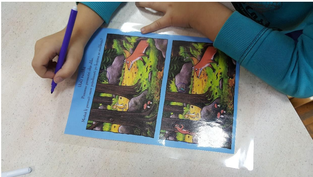
Slika 6: Igra „Uočavanje sličnosti i razlika 1“

U igri „Uočavanje sličnosti i razlika“ djeca su zaokruživala razlike na dvije naizgled slične slike iz priče o grubzonu. To su radili uz pomoć markera na plastificiranome predlošku. (slika 6)