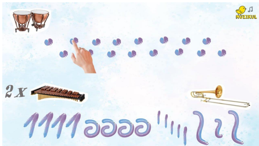
Slika 1. Prikaz muzikograma za skladbu Ples sablji Arama Hačaturjana 1

Slijede primjer izgleda nekih muzikograma.