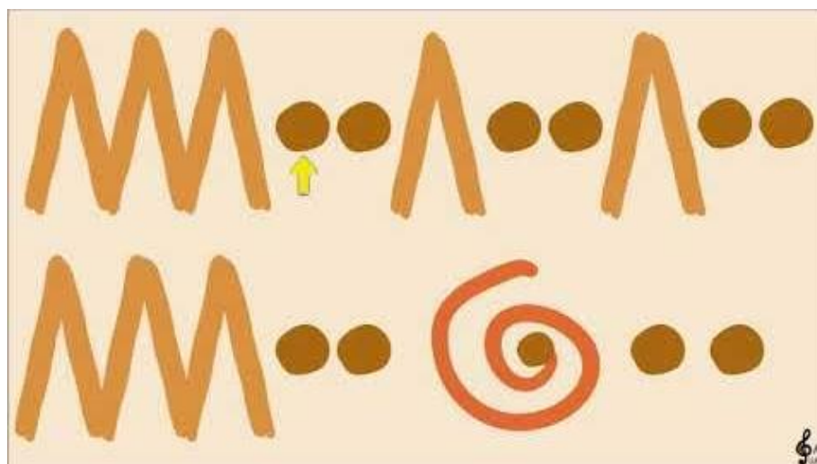
Slika 2. Prikaz muzikograma za skladbu Tritsch Tratsch polka Johanna Straussa II 2