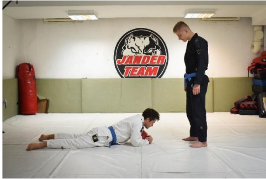
Slika 13. Početna pozicija

Vježba se izvodi u paru. Vježbač zauzima ležeći položaj na prsima držeći ispod trupa loptu. Zadatak suvježbača je preoteti loptu vježbaču.