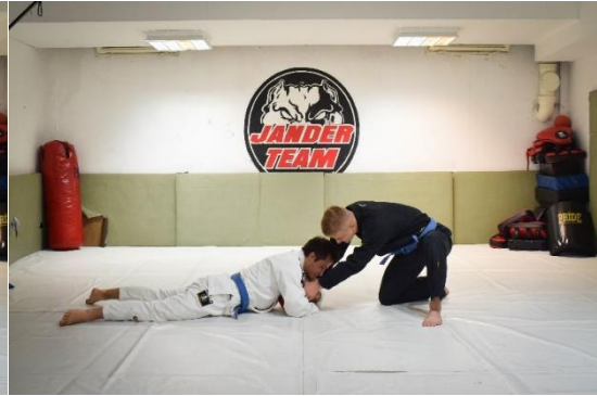
Slika 14. Otimanje lopte