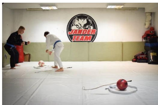
Slika 30. Igrač uzima drugu loptu