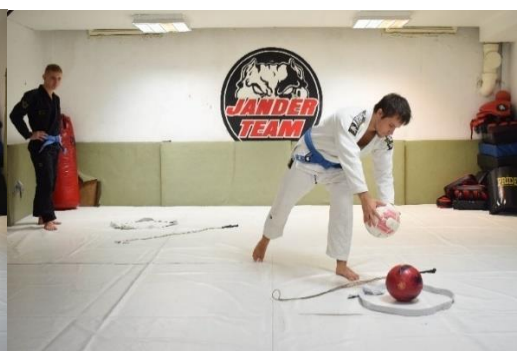
Slika 31. Igrač ostavlja drugu loptu u obruču