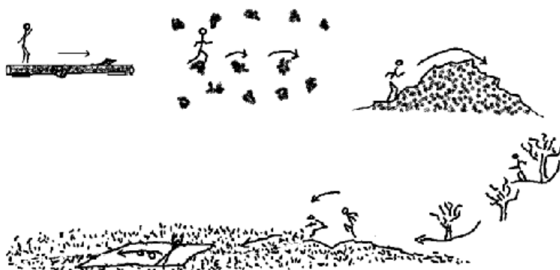
Slika 1. primjer poligona prepreka u prirodi

Gotovo sva djeca neizmjerljivo vole provoditi svoje vrijeme na otvorenome. Boravak na zraku za djecu znači samo jedno, a to je igra. Svaki kineziološki sadržaj pretvara se u edukativnu igru punu zabave. Priroda pruža bezbroj objekta koji se mogu na kreativan način iskoristiti, pa tako u ovom poligonu (Slika 1.) namijenjenom starijoj dobnoj skupini, mogu poslužiti srušeno drvo, niski grmovi te drveće. Za početak na znak odgojiteljice djeca hodaju uspravnim položajem po srušenom drvu, zatim dolaze do niskih grmova koje je potrebno preskočiti. Potom slijedi penjanje uz i silaženje niz brijeg, zatim trčanje oko drveća. Nakon trčanja, slijedi skok preko „jarka“, odnosno udubine te na kraju kotrljanje oko uzdužne osi po travi (prethodno na travu postaviti plahtu radi zaštite odjeće) (Lorger, 2014).