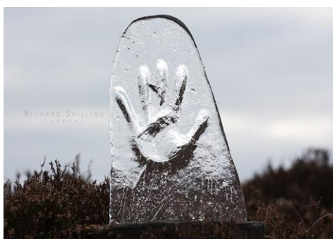
Slika 15. „Melted Ice Imprint“, Richard Shilling.