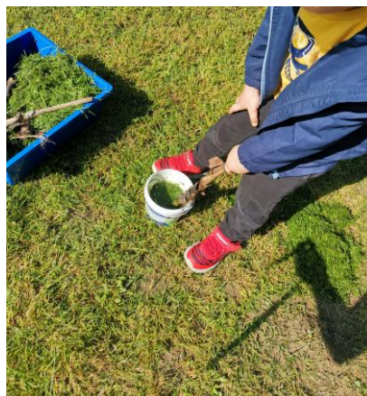
Slika 21. Pravljenje boje od sakupljene trave.

A. P. (4 godine): „Teta možeš nam dati vode i onda ćemo napraviti zelenu boju od trave.”