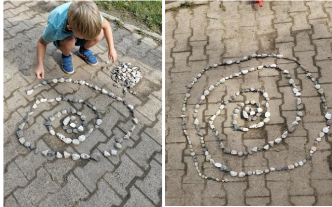
Slika 37. i 38. Izrada spirale od kamenja po uzoru na umjetničko djelo „Spiral Jetty“.

Nakon što su prikupili materijale djeca se dosjećaju poznatih Land art djela s fotografija te izrađuju svoja djela po uzoru na viđeno. Dječak A. V. (6 godina) odlučuje izraditi spiralu po uzoru na „Spiral Jetty“ (Slika 37. i 38.).