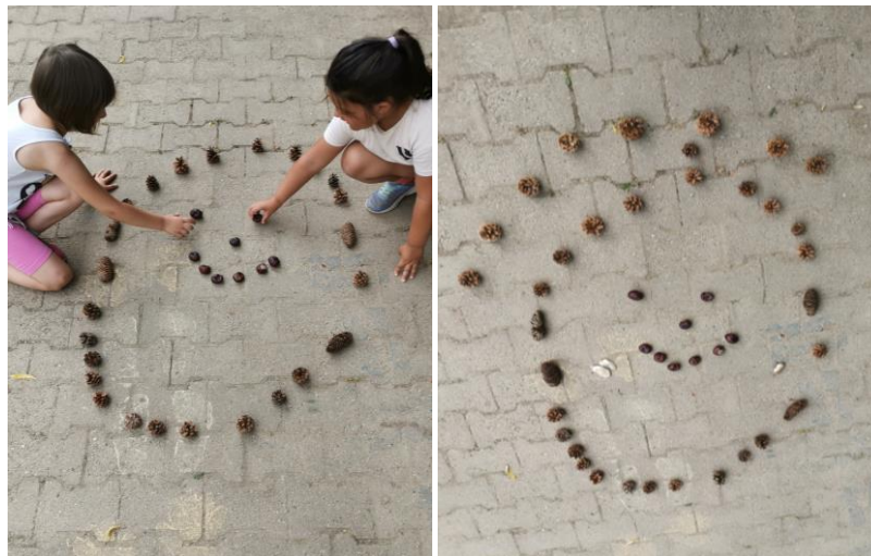
Slika 79. i 80. „Sretna vjeverica“, „Lice od mame“.