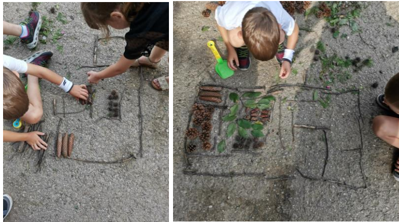
Slika 51. i 52. Proces izrade vrta od raznih materijala.

Dječaci promatraju vrt od djevojčica te odlučuju napraviti svoj. D. S. (6 godina): „Mi ćemo napraviti isto vrt, ali će naš biti bolji. Mi nećemo kopati rupe nego ćemo napraviti vrt od raznih materijala koje smo skupili. U vrtu ćemo napraviti pregrade i svaki dio će imati svoju pregradu. Svi listovi će imati svoj dio, češeri će imati svoj i tako sve ostalo će imati svoj dio“ (Slika 51. i 52.).