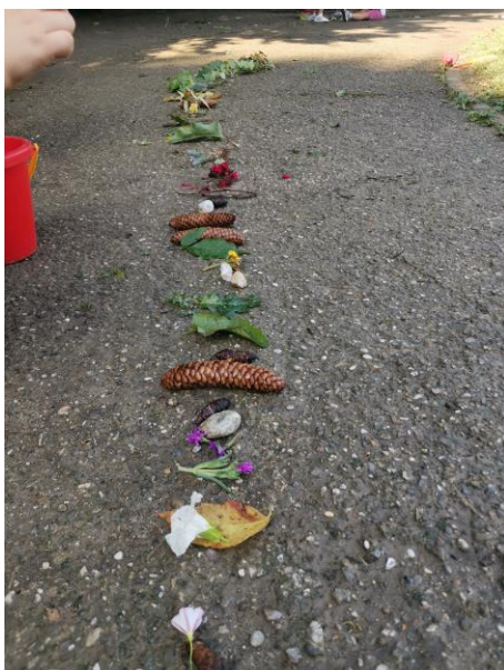
Slika 45. „Dugina staza“.

Nakon što su djevojčice izradile stazu dio mlađe djece prilazi i želi hodati po stazi. Djevojčice preusmjeravaju aktivnost u izradu vrta kako bi „spasile“ materijale koji čine stazu. I. M. (6 godina) uzima granu i crta „kvadrat“. Na pitanje što će to biti odgovara: „Posadit ćemo vrt, jer će sve to što smo ubrali možda ponovno narasti“. Poziva djevojčicu M. K. (5 godina i 8 mjeseci) da joj se pridruži, a djevojčica joj govori: „Baš budemo vidjeli hoće opet narasti. Sutra kad dođemo u vrtić vidjet ćemo je li opet naraslo. Idemo brzo sve posaditi jer će nam sve uništiti s biciklima“.