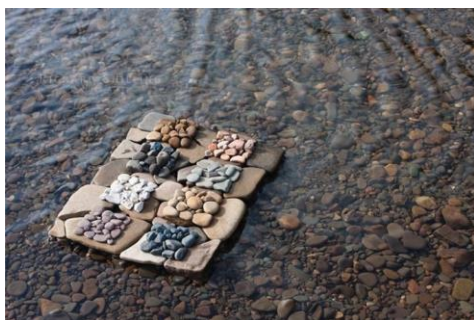
Slika 13. „Geology Squares“, Richard Shilling.