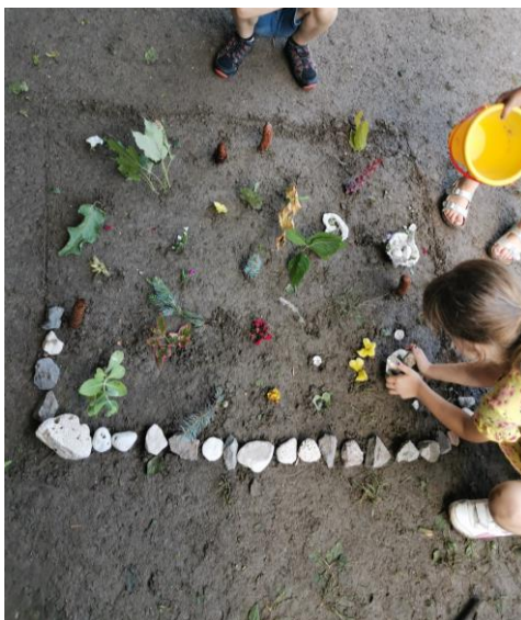
Slika 48. „Ograda od kamenja.“

Nakon što su posadile većinu prikupljenih materijala odlučuju da je vrtu potrebna „ograda od kamenja“, jer „ograda će čuvati vrt da ga netko ne pogazi“ (M. K.; 5 godina i 8 mjeseci). Prikupile su kamenje i postavile po prethodno iscrtanoj liniji (Slika 48.).