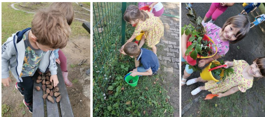
Slika 31., 32. i 33. Istraživanje prirodne okoline i prikupljanje materijala.

Problemska situacija – što sve možemo pronaći u dvorištu vrtića te što sve s time možemo napraviti? Djeca kreću u istraživanje, nose kante i skupljaju materijale (Slika 31., 32., 33., 34., 35. i 36.). Dio djece radi samostalno, dio surađuje (rad u paru), a prisutno je i komentiranje što će skupljati te što s kojim materijalom mogu napraviti.