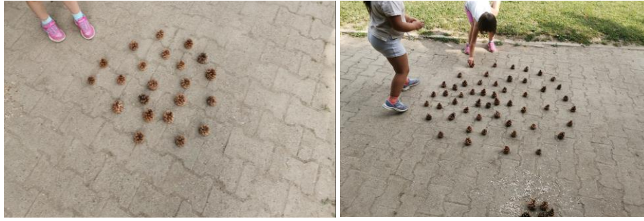
Slika 41. i 42. Izrada spirale od češera.

Djevojčica A. nakon što je završila rad izjavljuje sljedeće: „To je spirala koja je labirint. Ona ide u krug i mi moramo stati u krug i onda moramo pronaći put da idemo van“.