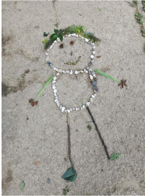
Slika 86. Dječje umjetničko djelo „Sestra Priroda“.