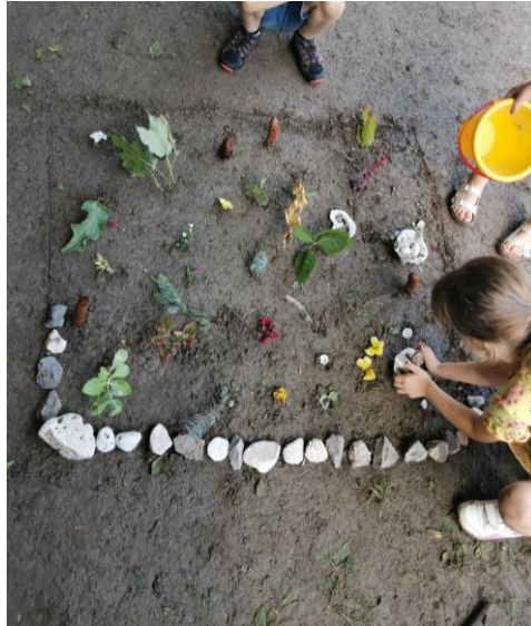
Slika 48. „Ograda od kamenja.“

Nakon što su posadile većinu prikupljenih materijala odlučuju da je vrtu potrebna „ograda od kamenja“, jer „ograda će čuvati vrt da ga netko ne pogazi“ (M. K.; 5 godina i 8 mjeseci). Prikupile su kamenje i postavile po prethodno iscrtanoj liniji (Slika 48.).