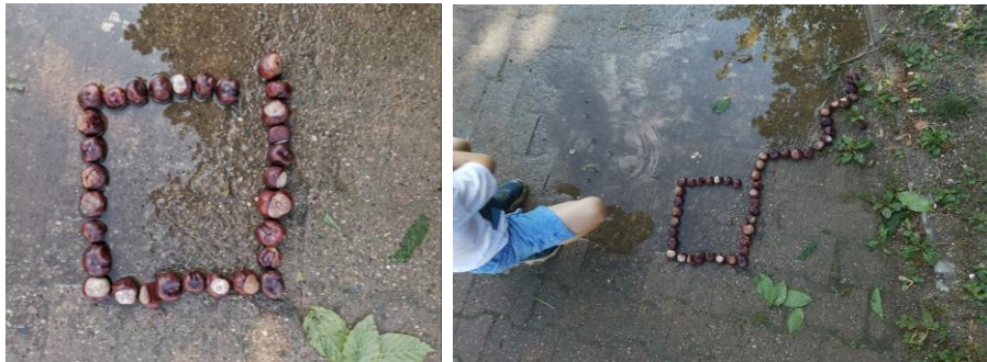
Slika 74. i 75. Proces izrade; „Kvadrat“, „Karta koja nam pokazuje put“.

Isti dječak potom izrađuje „kvadrat“, a kasnije kvadrat postaje „karta koja nam pokazuje put“ ( Slika 74. i 75. ).