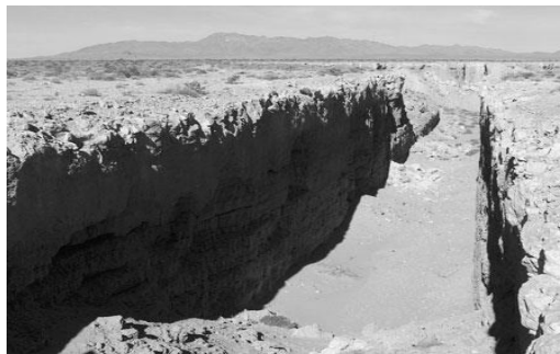
Slika 1. „Double negative“, Michael Heizer, (1969-1970).