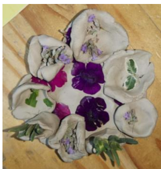
Slika 94. Tanjur s cvjetićima.

M. K. (5 godina i 8 mjeseci): „Ovo je jedan tanjur koji ima male cvjetice. Na tom tanjuru su male posudice, vaze neke sa svakakvim cvijećem. Ima osam različitih vaza sa svakakvim cvijećem za moju mamu“ ( Slika 94. ).