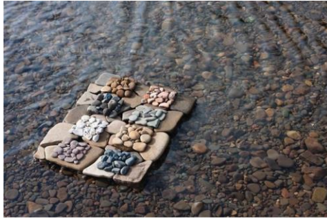
Slika 13. „Geology Squares“, Richard Shilling.