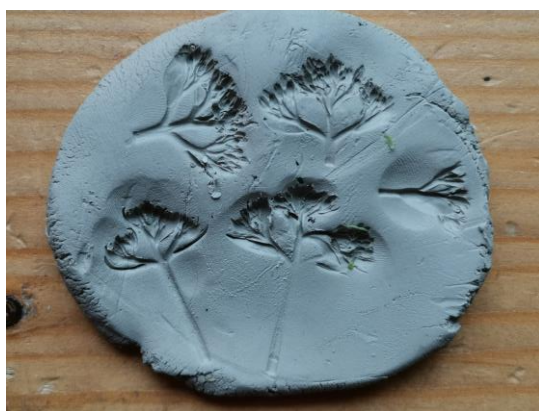
Slika 114. I. M. (6 godina): „Otisak cvijeća“.