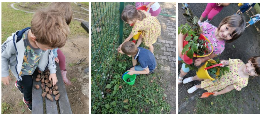
Slika 31., 32. i 33. Istraživanje prirodne okoline i prikupljanje materijala.

Problemska situacija – što sve možemo pronaći u dvorištu vrtića te što sve s time možemo napraviti? Djeca kreću u istraživanje, nose kante i skupljaju materijale (Slika 31., 32., 33., 34., 35. i 36.). Dio djece radi samostalno, dio surađuje (rad u paru), a prisutno je i komentiranje što će skupljati te što s kojim materijalom mogu napraviti.