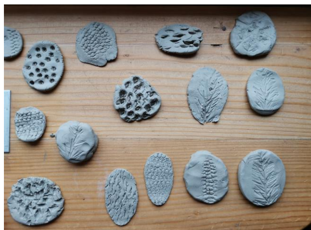
Slika 118. Dječji radovi.