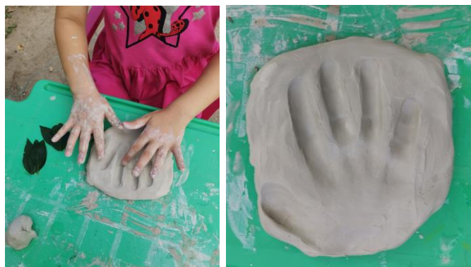
Slika 98. i 99. Proces izrade dječjeg dlana: „Moja mala ruka“.

Po dječjim odgovorima vidljiva je upotreba mašte, jer iako rade s istim materijalima, svaki je dječji uradak jedinstven, a svaki opis nastalog djela je drugačiji, ovisno o dječjoj mašti i načinu reprezentiranja stvarnosti.