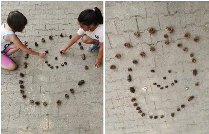
Slika 79. i 80. „Sretna vjeverica“, „Lice od mame“.