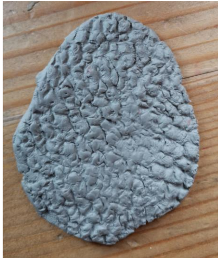
Slika 116. D. S. (6 godina): „Hrapava staza na koju možemo ribati noge“.