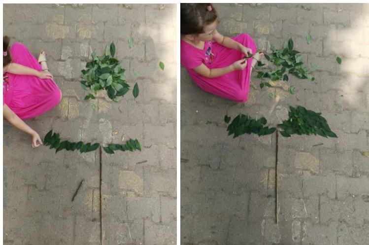
Slika 54. i 55. Proces izrade kišobrana.

Nakon što je napravljen vrt vrijeme se počelo mijenjati te je postalo oblačno, a dječaci su predložili: „Bolje da spremimo sve materijale koje smo skupili pa ćemo onda opet sutra moći raditi naša djela, ako pokisne sve će nam otići“. Djevojčicama M. K. (5 godina i 8 mjeseci) i I. M. (6 godina) ta se ideja nije svidjela, nisu željele ići unutra, pa su rekle dječacima da će napraviti „kišobran“ ispod kojega se mogu sakriti ako se boje kiše. Pronašle su veliku granu, „štap“ za koji se drži kišobran te su počele slagati lišće kako bi napravile „kišobran“ (Slika 54. i 55.). Jedna djevojčica je prikupljala lišće, a druga je stvarala umjetničko djelo.