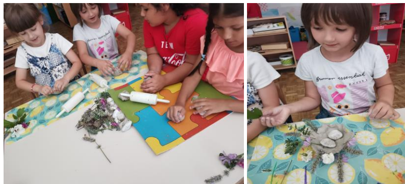
Slika 92. i 93. Problemska situacija – Kakvo umjetničko djelo možemo izraditi od prikupljenih materijala i gline?

Istraživali smo teksturu prikupljenih materijala i uz pomoć istih na glini izrađivali reljefe. Dio aktivnosti proveden je u prirodnom okruženju, a dio je proveden u prostorijama vrtića zbog vremenskih neprilika. Pred djecu smo postavili problemsku situaciju – Kakvo umjetničko djelo možemo izraditi od prikupljenih materijala i gline? Počeli smo stvarati radove koristeći prirodne materijale i oblikujući razne posude i vaze ukrašene cvijećem i lišćem (Slika 92. i 93.).