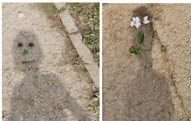
Slika 29. i 30. Istraživanje sjene – ljudski lik.