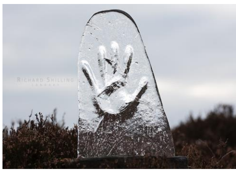
Slika 15. „Melted Ice Imprint“, Richard Shilling.