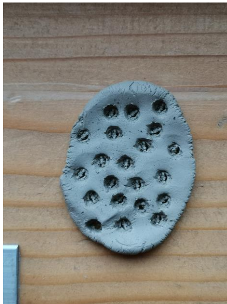
Slika 111. A. V. (6 godina): „Rupice od grane“.