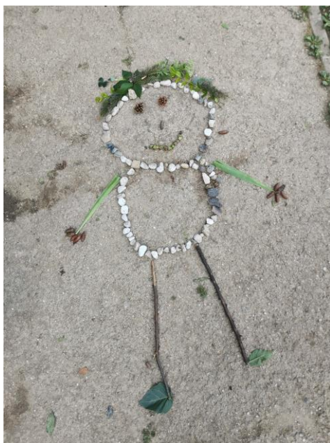
Slika 86. Dječje umjetničko djelo „Sestra Priroda“.