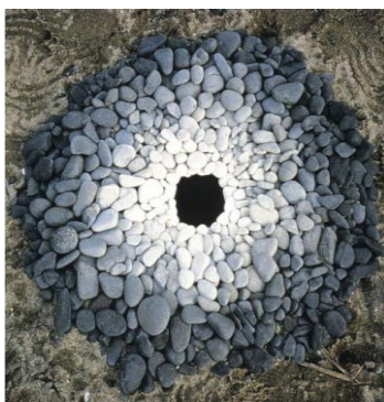
Slika 11. „Ombre stones“, Andy Goldsworthy.