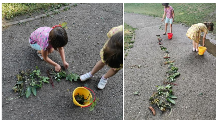
Slika 43. i 44. Proces izrade „Dugina staza“.

M. K. (5 godina i 8 mjeseci) i I. M. (6 godina) odvajaju se s prikupljenim materijalima i počinju izrađivati stazu od raznih materijala koje su prethodno prikupile istražujući prirodnu okolinu. Nazivaju ju: „Dugina staza“.