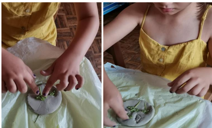
Slika 112. i 113. Proces izrade.