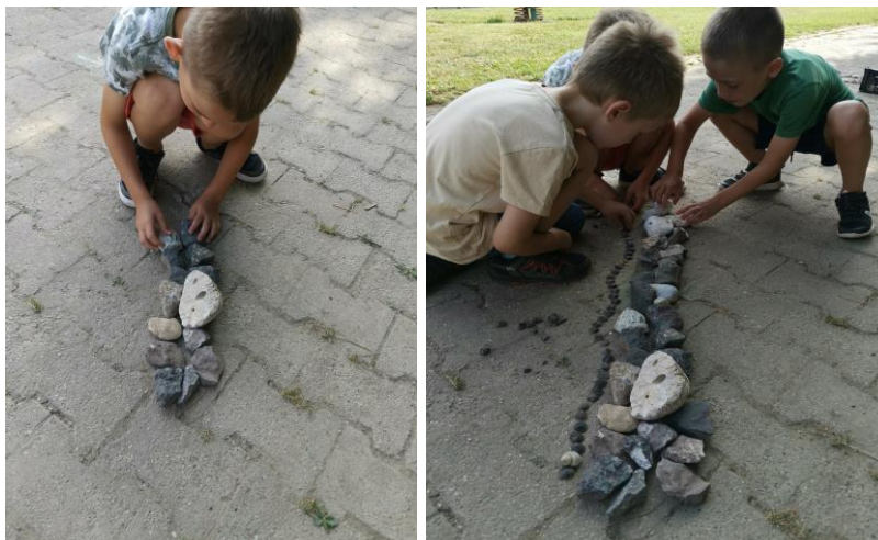
Slika 58. i 59. Proces izrade kamene linije koja postaje „Čudesna šuma“.

Za to vrijeme dječak M. P. (6 godina) izrađuje kamenu liniju. Izjava dječaka: „Ja ću od kamenja napraviti kamenu liniju“ (Po uzoru na djelo „A line in Ireland“). Aktivnost počinje gradnjom kamene linije, jedan dječak sam gradi, a nakon nekog vremena pridružuje mu se još dvoje djece te se aktivnost proširuje na zajednički rad iz kojega nastaje „Čudesna šuma“ ( Slika 58. i 59. ).