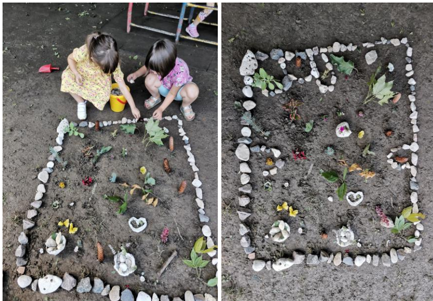
Slika 49. i 50. „Dugin vrt“.

Djevojčice su pažljivo i s puno strpljenja izrađivale vrt te su ga po završetku nazvale „Dugin vrt“ (Slika 49. i 50.).