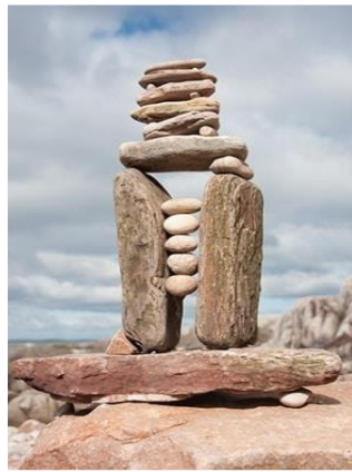
Slika 14. „Construction Balance“, Richard Shilling.