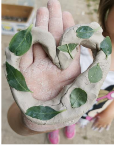
Slika 100. „Srce od prirode“.