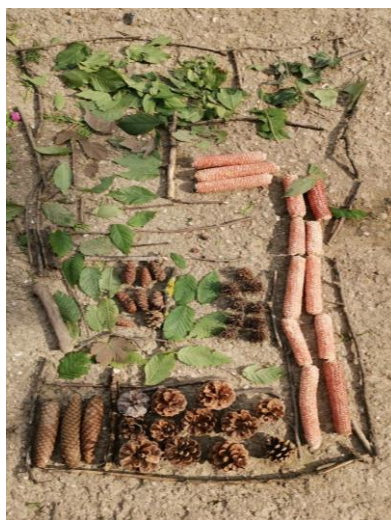
Slika 53. Dječje umjetničko djelo; D. S. (6 godina): „Moj vrt koji liči na vrt od I. i M., ali moj je još bolji. Teta vidi sve materijale koje imam“.