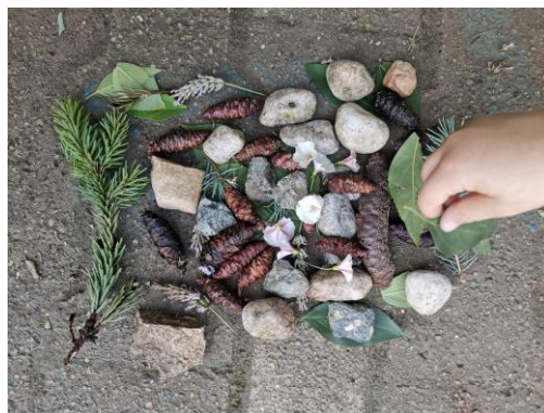
Slika 76. „Neki vijenac“.

Djevojčica A. (6 godina): „Ovo je neki vijenac. Nisam mogla misliti šta bi mogla napraviti sa svojim materijalima, jer mi se spava, pa sam smislila ovaj vijenac“ ( Slika 76. ).