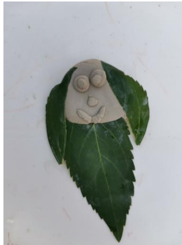
Slika 101. L. (6 godina): „Teta ovo sam ja“.