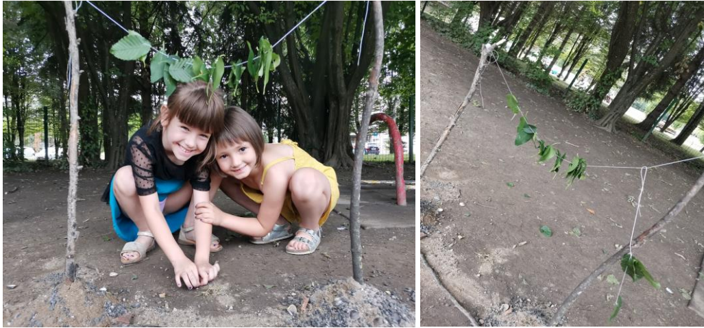
Slika 90. i 91. Gotov dječji uradak „Okvir za slikanje“ i mobil („Jedan konac koji visi s lišćem“).