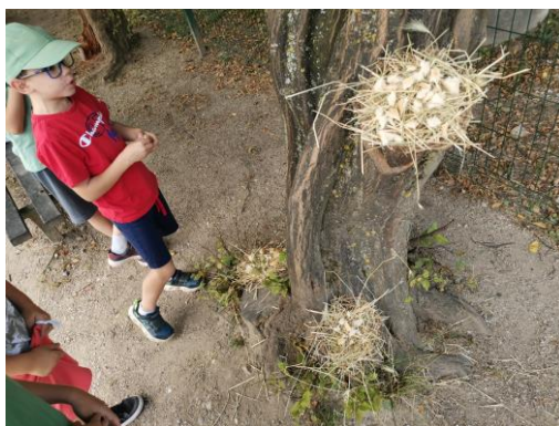
Slika 67. Gnijezda za ptičice postavljena na drvo.

Djevojčice L. (6 godina) i M. (5 godina i 8 mjeseci) prvotno izrađuju „krug“ (Po uzoru na djelo „A circle in Ireland“). Kasnije se krug pretvara u „otok“. Zatim traže stanovnika za otok. Odlaze u vrtićku sobu i uzimaju hobotnicu napravljenu od kartona. Hobotnica postaje stanovnik otoka. Djevojčica M. K. (5 godina i 8 mjeseci): „Ovo je otok na kojem je ova hobotnica. I ovo su svjetionici da joj nije mrak“. L. (6 godina): „Na otok se može doći samo brodom. Tu živi ova hobotnica i izašla je iz mora. Onda joj je bilo previše vruće pa smo joj stavili školjku. Školjka izgledao kao šešir da joj ne bude vruće“ (Slike 68., 69. i 70.).