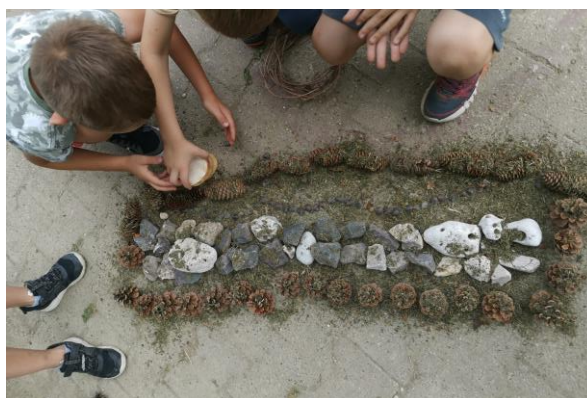
Slika 61. Nadograđivanje čudesne šume pokošenom travom.