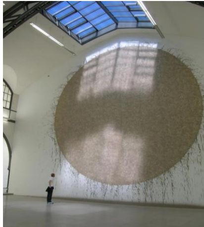
Slika 10. „Krug od mulja iz rijeke Avon“, Richard Long, (1985).

Zanimljivo je i njegovo djelo koje povezuje prirodu s galerijom. 80.-ih godina Long je mulj koji je pronašao u rijeci premještao u prostore galerije. Rukama je nanio mulj na bijeli zid, a kružnim pokretima stvorio je strukture u kojima se naziru otisci ljudskih prstiju i dlana, kao što je vidljivo na djelu Slika 10. , „Krug od mulja iz rijeke Avon“ (1985). Njegovi radovi potaknuti su činjenicom da su čovjek i priroda neodvojivo povezani (Šuvaković, 2005: 342-343). Zaključno, možemo reći kako je Long malim i jednostavnim intervencijama u prirodi načinio velika umjetnička djela i to ga čini jednim od važnijih predstavnika Land arta.