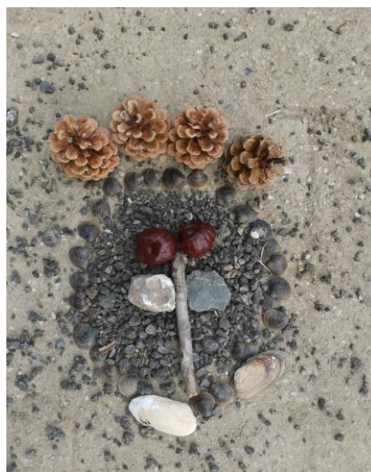
Slika 63. M. (6 godina); „Grob od strica“.

Dječak M. (6 godina) radi samostalno. Sam izrađuje svoje djelo te ne želi da ga se ometa. Kada je završio poziva odgojiteljicu da vidi njegovo djelo. Zatim govori: „Ovo je grob i križ na grobu. To je grob od mog strica koji je poginuo“ ( Slika 63. ). Dječak je ostatak vremena sjedio pokraj svog rada te nije dao ostaloj djeci da se približe.