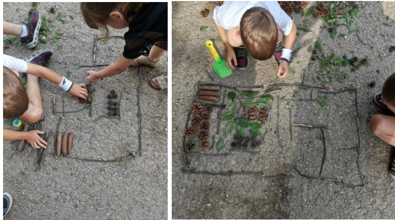
Slika 51. i 52. Proces izrade vrta od raznih materijala.

Dječaci promatraju vrt od djevojčica te odlučuju napraviti svoj. D. S. (6 godina): „Mi ćemo napraviti isto vrt, ali će naš biti bolji. Mi nećemo kopati rupe nego ćemo napraviti vrt od raznih materijala koje smo skupili. U vrtu ćemo napraviti pregrade i svaki dio će imati svoju pregradu. Svi listovi će imati svoj dio, češeri će imati svoj i tako sve ostalo će imati svoj dio“ (Slika 51. i 52.).