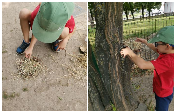
Slika 65. i 66. Proces izrade „Gnijezdo za ptičice“.

Dječak R. (6 godina) gleda što rade I. i H. te im predlaže da naprave puno gnijezda koje će postaviti na drvo tako da tu mogu doći ptičice. Djevojčice nisu zainteresirane, no dječak R. govori: „Ja ću napraviti sam gnijezdo za ptičice. Stavit ću to na drvo i stavit ću mrvice od kruha. Ptice će pojesti sav kruh i onda kada mi ne budemo gledali, kada budemo doma, one će u gnijezdu ostaviti četiri jajašca i iz njih će izaći male ptičice“ ( Slika 65. i 66. ).