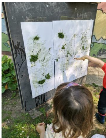
Slika 22. Slikanje travom i bojom dobivenom od miješanja trave i vode.

T. T. (4 i pol godine): „Blato nije mekano kao trava. Bilo je hrapavo jako, a kad sam ga stavila u vodu isto je još malo bilo hrapavo. Kao da ima i kamenčiće neke. Probaj miješati teta s rukom da osjetiš kamenčiće.“