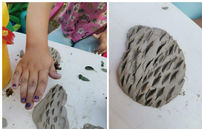
Slika 103. i 104. Izrada reljefa s češerom; gotov dječji uradak.

Nakon što je krenula kiša prikupljene materijale selimo u prostorije vrtića te nastavljamo aktivnosti u zatvorenome.