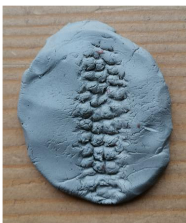
Slika 108. A. V. (6 godina): „Teta vidi što sam napravio s kukuruzom“.