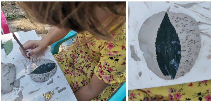
Slika 102. M. K. „Tanjur s listom i rupicama i nekim udubinama“.