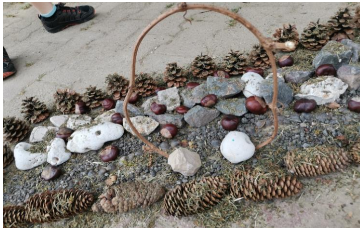
Slika 62. Ulaz u čudesnu šumu.

Dječaci su surađivali, prisutan je timski rad i postepeno nadograđivanje djela i mijenjanje tijekom aktivnosti. Aktivnost napreduje stepenicu po stepenicu. Na kraju dječaci nalaze u dvorištu suhu travu i posipaju je po svojoj čudesnoj šumi ( Slika 61. ). Dječak R. (6 i pol godina): „Teta ova šuma je tako čudesna. Sve smo napravili, pogledaj, ima puno drveća i borova. Ovo i trava raste po šumi. Uzeli smo male školjkice i napravili smo put koji ide kroz šumu“. Dječak D. S. (6 godina) postavlja problemsku situaciju pitanjem: „A gdje je ulaz u šumu?“ Dječak R. rješava problem i izrađuje ulaz te govori: „Ovo je ulaz u našu šumu. Pričvrstio sam ovu granu s dva kamena da može stajati i tu se ulazi“ ( Slika 62. ).