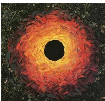
Slika 12. „Fall Leaves“, Andy Goldsworthy.