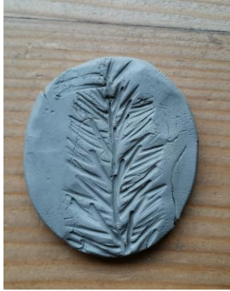
Slika 109. M. K. (5 godina i 8 mjeseci): „Kameni bor“.