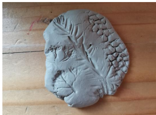
Slika 117. M. K. (5 godina i 8 mjeseci): „Razni načini otiska na glini. Tu je cvijet, ovdje je bor i ovo je kukuruz“.