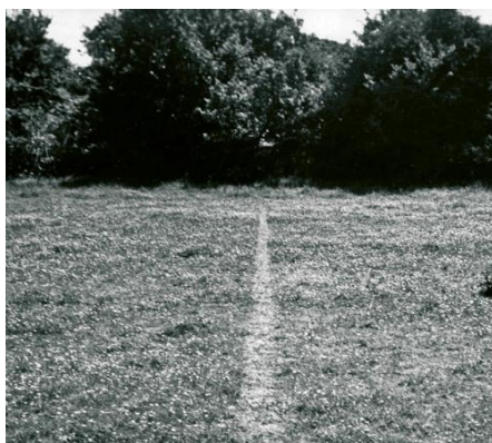
Slika 5. „A Line Made by Walking“, Richard Long, (1967).