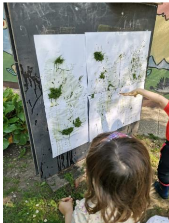
Slika 22. Slikanje travom i bojom dobivenom od miješanja trave i vode.

T. T. (4 i pol godine): „Blato nije mekano kao trava. Bilo je hrapavo jako, a kad sam ga stavila u vodu isto je još malo bilo hrapavo. Kao da ima i kamenčiće neke. Probaj miješati teta s rukom da osjetiš kamenčiće.“