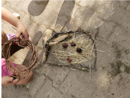
Slika 64. „Kućica za ptičice“.

Djevojčica H. (6 godina) izrađuje kućicu za ptičice ( Slika 64. ). Pridružuje joj se djevojčica I. M. (6 godina) i govori: „Stavit ću unutra kestene. Ti kesteni mogu biti ptičice u šumi“.