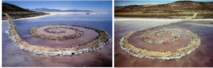
Slika 2. i Slika 3. „Spiral Jetty“, Robert Smithson, (1970).