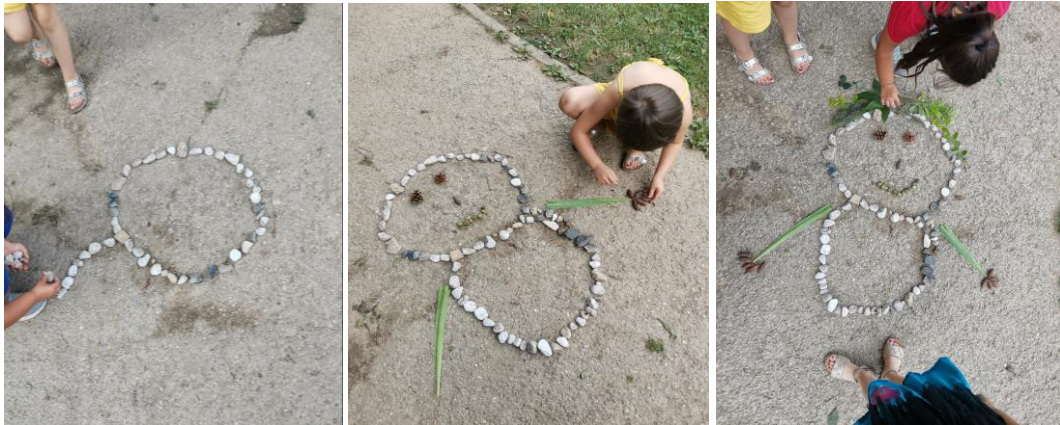
Slika 81., 82. i 83. Proces izrade „Sestra Priroda“.

Dječji razgovor tijekom izrade „Sestre Prirode“: