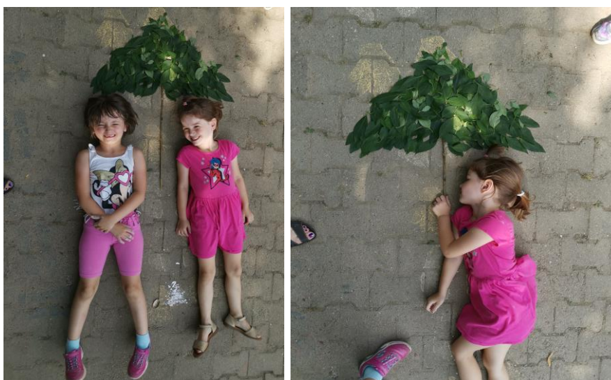
Slika 56. i 57. Gotovo umjetničko djelo – kišobran (suncobran).

Kišobran je postao senzacija, pa su ga djeca iz ostalih skupina došla gledati. U nekom trenutku kišobran postaje suncobran. M. K. (5 godina i 8 mjeseci): „Sad se I. i ja možemo i sunčati ispod suncobrana da nam nije vruće“ (Slika 56. i 57.).