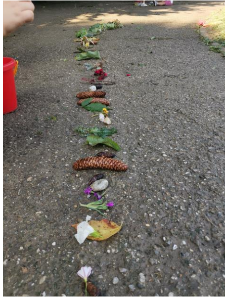
Slika 45. „Dugina staza“.

Nakon što su djevojčice izradile stazu dio mlađe djece prilazi i želi hodati po stazi. Djevojčice preusmjeravaju aktivnost u izradu vrta kako bi „spasile“ materijale koji čine stazu. I. M. (6 godina) uzima granu i crta „kvadrat“. Na pitanje što će to biti odgovara: „Posadit ćemo vrt, jer će sve to što smo ubrali možda ponovno narasti“. Poziva djevojčicu M. K. (5 godina i 8 mjeseci) da joj se pridruži, a djevojčica joj govori: „Baš budemo vidjeli hoće opet narasti. Sutra kad dođemo u vrtić vidjet ćemo je li opet naraslo. Idemo brzo sve posaditi jer će nam sve uništiti s biciklima“.