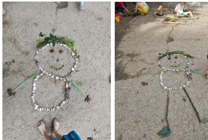
Slika 84. i 85. Proces stavljanja kose od lišća.

I. M. (6 godina): „Sad ću ja to riješiti, znam što joj može biti kosa“. Djevojčica I. M. (6 godina) donosi lišće i radi kosu ( Slika 84. i 85. ).