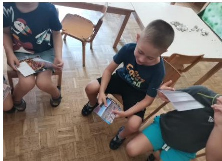
Slika 17. Promatranje umjetničkih djela preko reprodukcija i razgovor o umjetničkim djelima.

R. (6 godina): „Meni je najljepši ovaj krug od lišća. To je spirala od lišća, a sviđa mi se zato što je napravljena od raznog lišća koje je raznih boja. Takve boje lišća su kada dođe jesen, sve su boje prekrasne u jesen.” (O djelu „Fall Leaves“; Andy Goldsworthy).