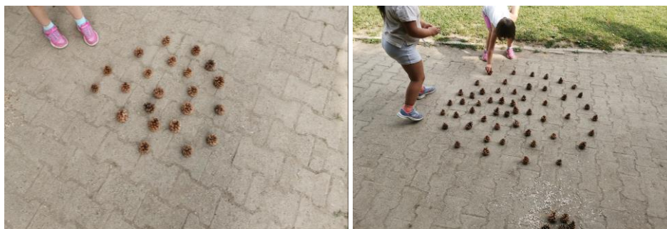
Slika 41. i 42. Izrada spirale od češera.

Djevojčica A. nakon što je završila rad izjavljuje sljedeće: „To je spirala koja je labirint. Ona ide u krug i mi moramo stati u krug i onda moramo pronaći put da idemo van“.