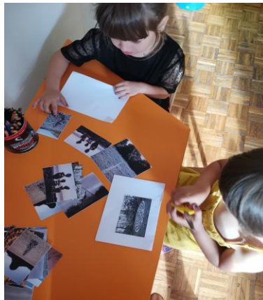
Slika 16. Promatranje umjetničkih djela preko reprodukcija.

M. K. (5 godina i 8 mjeseci): „Najviše mi se sviđa slika od spirale jer ide u krug, a taj krug je u vodi. Mogla bih hodati po vodi dok idem po tom krugu.“ (O djelu „Spiral Jetty“; Robert Smithson).