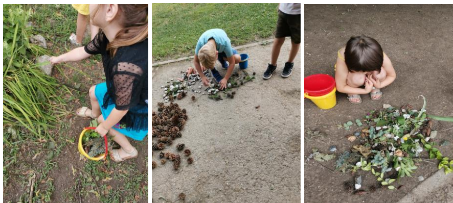
Slika 34., 35. i 36. Istraživanje prirodne okoline i prikupljanje materijala.