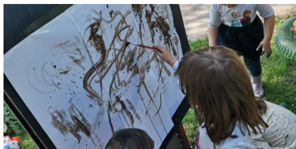
Slika 23. Slikanje blatom (Po uzoru na umjetničko djelo „Krug od mulja iz rijeke Avon“, Richard Long).

Djeca su posebice bila oduševljena ovom aktivnošću. Samoinicijativno su izmjenjivali načine rada; crtanje prstima, prskanje mokrim prstima, bacanje trave na papir, itd.