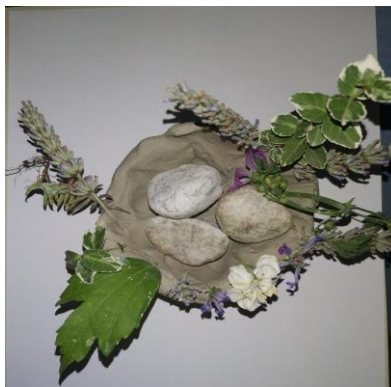
Slika 97. I. M. (6 godina): „Ovo je mašta jer mašta može svašta. Mi radimo sve prirodno jer je priroda najljepša. To su sve stvari iz prirode“.

Po dječjim odgovorima vidljiva je upotreba mašte, jer iako rade s istim materijalima, svaki je dječji uradak jedinstven, a svaki opis nastalog djela je drugačiji, ovisno o dječjoj mašti i načinu reprezentiranja stvarnosti.