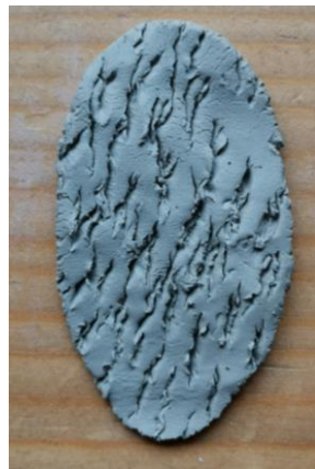
Slika 110. D. S. (6 godina): „Hrapava staza“.