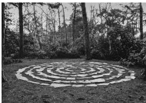
Slika 9. „Six stone circles“, Richard Long, (1981).