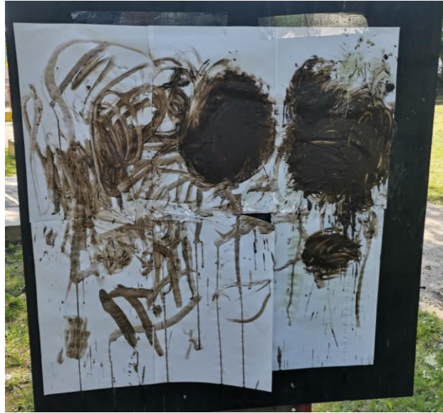
Slika 24. T. T. (4 i pol godine): „Krug od blata od Kružića.“

Dječak A. V. (6 godina) o djelu „Krug od mulja iz rijeke Avon“ je rekao: „Meni se najviše sviđa djelo „Krug od mulja“. Kada gledam sliku sviđa mi se jer mi se čini da je taj krug jako mekan. Zamišljam da ga diram rukom i da idem u krug i čini se da je jako mekano“. Naknadno je dječak pipao rukama dječji uradak po uzoru na djelo Richarda Longa te zaključio sljedeće: „Mislim da nije baš tako mekan kao ovaj na slici. Nije ni gladak. Dosta je hrapav“.