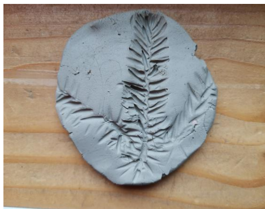
Slika 115. I. M. (6 godina): „Grana od bora koja ide u svim smjerovima, u sredinu i lijevo i desno“.