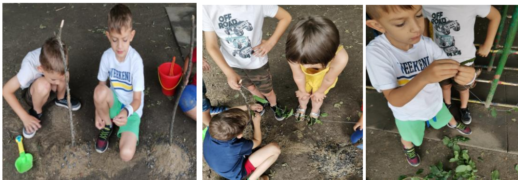
Slika 87., 88. i 89. Proces istraživanja ravnoteže; izrada okvira za slikanje i mobila.

Od prirodnih materijala djeca mogu izrađivati trodimenzionalne skulpture i mobile i tako istraživati odnose veličina, volumen, prostor, ravnotežu, oblik i teksturu. Za istraživanje ravnoteže djeca su izrađivali „okvir za slikanje“ ( Slika 87. ). Prvotno su postavili jednu manju granu, a zatim veću, na to konac s lišćem, a zatim su zaključili da lišće klizi prema dolje, prema manjoj grani. Nakon toga su manju granu zamijenili za veću. Provlačili su konac kroz lišće te ga pokušavali ravnomjerno rasporediti kako bi svuda bilo podjednako listova ( Slika 88. ). Nakon što su napravili okvir za slikanje odlučili su napraviti „jedan konac koji visi s lišćem“ (mobil), jer će onda moći promatrati „kako vjetar puše“ ( Slika 89. ).