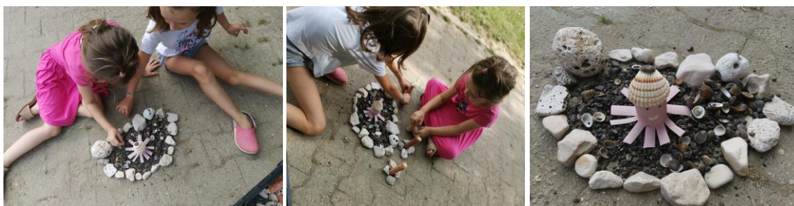
Slika 68., 69. i 70. Proces izrade otoka.

Djevojčice L. (6 godina) i M. (5 godina i 8 mjeseci) prvotno izrađuju „krug“ (Po uzoru na djelo „A circle in Ireland“). Kasnije se krug pretvara u „otok“. Zatim traže stanovnika za otok. Odlaze u vrtićku sobu i uzimaju hobotnicu napravljenu od kartona. Hobotnica postaje stanovnik otoka. Djevojčica M. K. (5 godina i 8 mjeseci): „Ovo je otok na kojem je ova hobotnica. I ovo su svjetionici da joj nije mrak“. L. (6 godina): „Na otok se može doći samo brodom. Tu živi ova hobotnica i izašla je iz mora. Onda joj je bilo previše vruće pa smo joj stavili školjku. Školjka izgledao kao šešir da joj ne bude vruće“ (Slike 68., 69. i 70.).