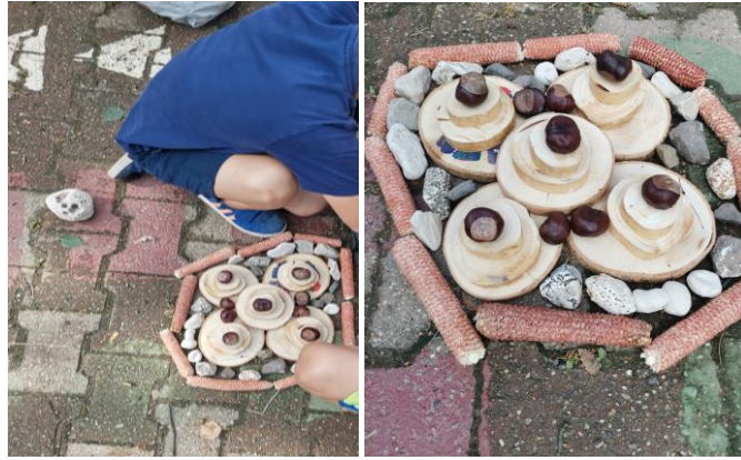
Slika 77. i 78. „Torta za rođendan.“