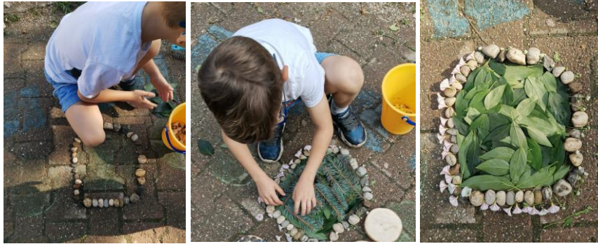
Slika 71., 72. i 73. Proces izrade.

Isti dječak potom izrađuje „kvadrat“, a kasnije kvadrat postaje „karta koja nam pokazuje put“ ( Slika 74. i 75. ).