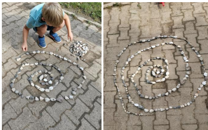
Slika 37. i 38. Izrada spirale od kamenja po uzoru na umjetničko djelo „Spiral Jetty“.

Nakon što su prikupili materijale djeca se dosjećaju poznatih Land art djela s fotografija te izrađuju svoja djela po uzoru na viđeno. Dječak A. V. (6 godina) odlučuje izraditi spiralu po uzoru na „Spiral Jetty“ (Slika 37. i 38.).