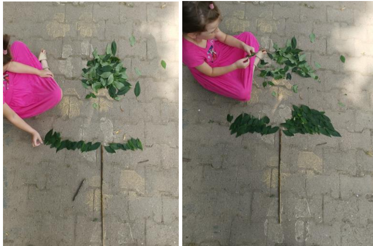
Slika 54. i 55. Proces izrade kišobrana.

Nakon što je napravljen vrt vrijeme se počelo mijenjati te je postalo oblačno, a dječaci su predložili: „Bolje da spremimo sve materijale koje smo skupili pa ćemo onda opet sutra moći raditi naša djela, ako pokisne sve će nam otići“. Djevojčicama M. K. (5 godina i 8 mjeseci) i I. M. (6 godina) ta se ideja nije svidjela, nisu željele ići unutra, pa su rekle dječacima da će napraviti „kišobran“ ispod kojega se mogu sakriti ako se boje kiše. Pronašle su veliku granu, „štap“ za koji se drži kišobran te su počele slagati lišće kako bi napravile „kišobran“ (Slika 54. i 55.). Jedna djevojčica je prikupljala lišće, a druga je stvarala umjetničko djelo.