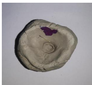
Slika 95. D. S. (6 godina): „Tanjur iz kojeg se može jesti“.

D. S. (6 godina): „Ovdje sam ja napravio jedan tanjur iz kojeg se može jesti i onda se tu dolje na dnu vidi otisak mog prsta kad sam ga stisnuo“ ( Slika 95. ).