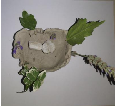
Slika 96. H. (4 i pol godine): „Tu je jedna ograda oko jednog jezera. Okolo raste drveće i dolje na dnu jezera plivaju kameni“.