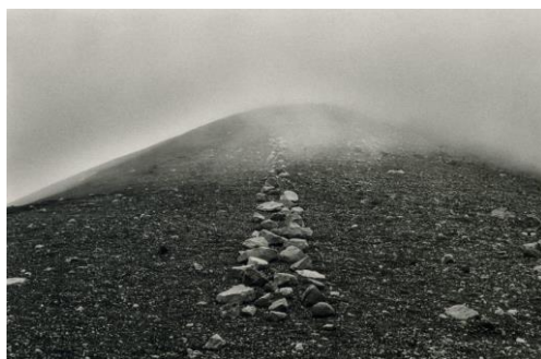
Slika 7. „A Line in Japan“, Richard Long, (1979).