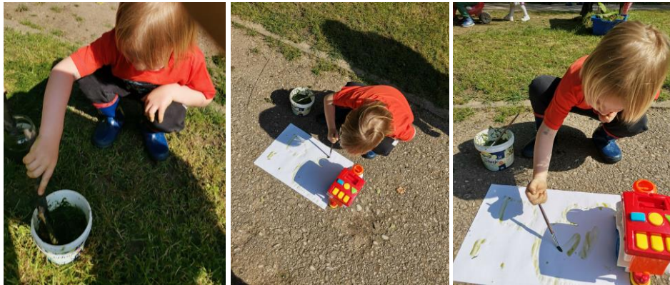
Slika 26., 27. i 28. Istraživanje sjene – slikanje bojom od trave; obris lika igračke (vlaka).

Istraživanje sjene događa se u kontekstu situacijskog poticaja. Dječak R. G. (4 godine) odvaja se od skupine djece te traži odgojitelja papir po kojem će crtati s bojom od trave. Postavlja papir na stazu. U blizini papira nalazi se igračka (vlak) te dječak primjećuje sjenu. R. G.: „Teta vidi, vidi se sjena na papiru.“ Dječak govori kako će nacrtati vlak, uzima ga i približava papiru te kistom i bojom od trave slika obrube vlaka, tj. njegove sjene. U zaključku ističe: „Teta sada kada maknem vlak ostat će vlak koji sam nacrtao, pogledaj“. Dječak miče igračku te u obrisima raspoznaje lik vlaka kojeg je naslikao.