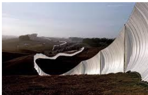
Slika 4. „Putujuća ograda“, Christo i Jeanne-Claude, (1976).

Iako se u Land art umjetnosti naglasak stavlja na stopostotno prirodne materijale, dozvoljeno je koristiti i umjetne materijale, na način da se s njima intervenira u prirodi. Po tom uzoru Christo i njegova žena Jeanne-Claude podigli su ogradu u prirodi, u Kaliforniji, koristeći platnene plahte, najlon, cijevi i žicu. Djelo je dobilo naziv „Putujuća ograda“ (1976), Slika 4., jer je bilo dugačko skoro četrdeset kilometara. Bračni par je ogradu podizao skoro četiri godine, a trajala je samo dva tjedna (Kaplan, 2010).