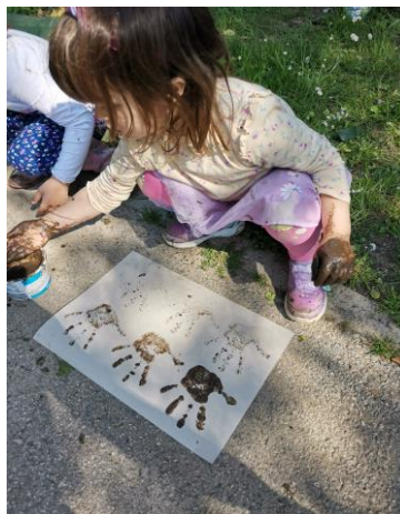
Slika 25. „Otisak dlana“.

Djevojčica T. T. (4 i pol godine) je općenito jako kreativna, puno vremena provodi u prirodi i uvijek ima originalne ideje. Tražila je karton i rekla: „Sad ćeš vidjeti kako se od blata može napraviti i otisak ruke“. Odgojiteljica joj je dala karton te je djevojčica izradila umjetničko djelo „Otisak dlana“. U zaključku je rekla: „Ovdje se jako vidi ruka od blata i vidiš sada sve manje i manje se vidi boja. Nestala je boja i onda još moramo staviti ruku u blato da ostane otisak od ruke“.