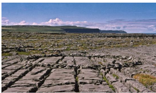
Slika 6. „A circle in Ireland“, Richard Long, (1975).

Šuvaković (2005: 342) piše kako su tragovi koje je ostavljao Richard Long najčešće bili „tragovi koje kiša i vjetar brzo uništavaju“. Stoga je bilo potrebno takve radove uvijek dokumentirati. Putovati po svijetu, putovati po egzotičnim zemljama i ostavljati svoj trag u pejzažu pomoću hoda temelj je njegovog rada. Hodanje i ostavljanje linija nije njegov cjelokupni doprinos Land art pokretu. Presloživši kamenje stvorio je geometrijski oblik na terenu koji je teško dostupan te tako načinio djelo „A circle in Ireland“ (1975), Slika 6. , kao i djelo „A Line in Japan“ (1979), Slika 7. (Šuvaković, 2005).