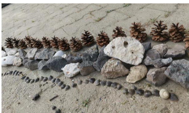
Slika 60. „Čudesna šuma“.