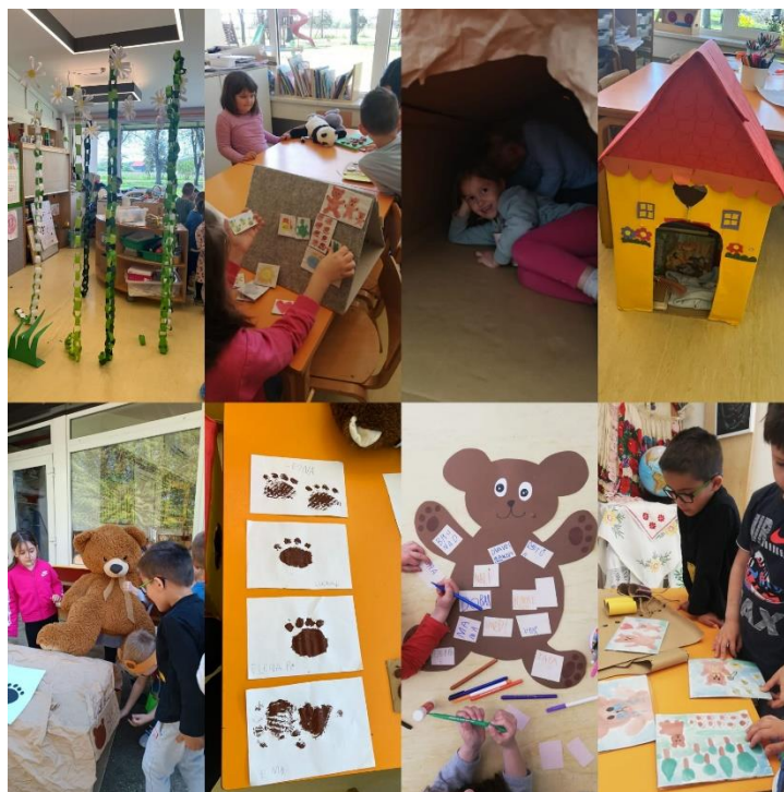
Slika 9: Stvaranje priče (2. dio)