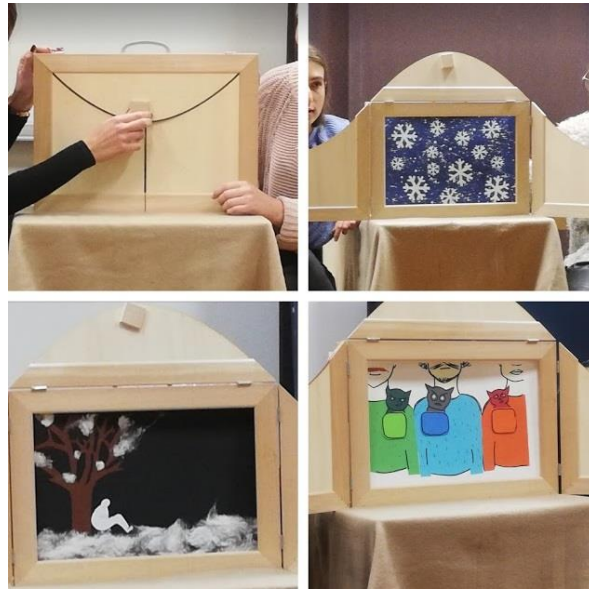
Slika 2: Kamišibaj slikovnica; izvor: Školska knjiga.hr

tekst prati ilustracije koje se prikazuju s prednje strane butaja. Kartice na kojima se nalaze ilustracije već su razvrstane u butaj radi lakšeg snalaženja pripovjedača, a iste te ilustracije dodaju poseban dramatičan efekt pričanju priče te zadržavaju pažnju i motiviraju slušatelje priče.