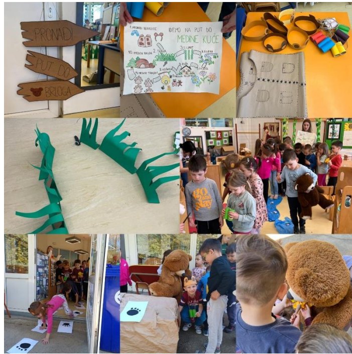
Slika 8: Stvaranje priče (1. dio)