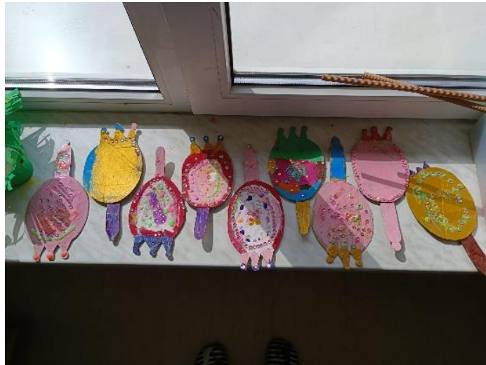
Slika 4: Ukrašena ogledalca