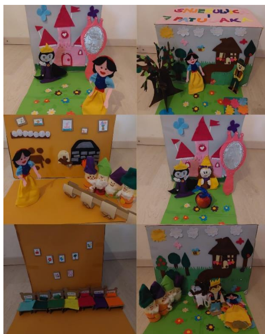
Slika 6: Scene iz priče „Snjeguljica i sedam patuljaka“; lutkice, kutija, rekviziti