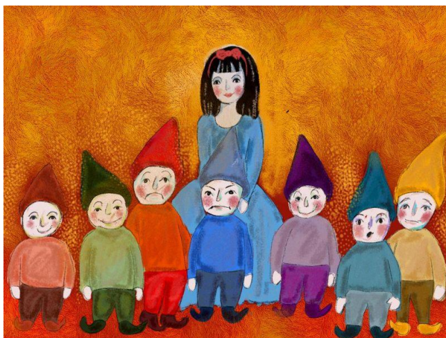
Slika 7: Slikovnica "Snjeguljica i sedam patuljaka" (1812); autor: braća Jacob i Wilhelm Grimm; ilustrator: Gustave Doré