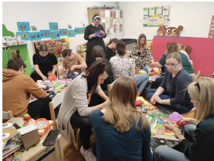
Slika 11: Izrada didaktičke slikovnice "Mala farma"