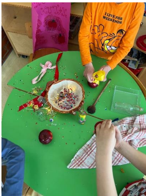
Slika 5: Priprema čarobne jabuke za Snjeguljicu