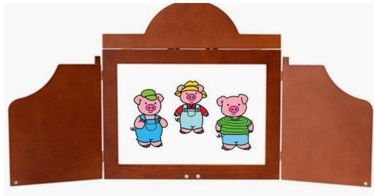
Slika 12: Kamišibaj slikovnica "Tri praščića"

ovoj vrsti slikovnice zbog teksta u kamišbaju koji je ključan za razvoj priče. On opisuje radnju, dijaloge i karaktere, omogućavajući publici da se bolje poveže s pričom. Riječi u tekstu mogu izražavati emocije likova, dodajući priči dubinu. Tekst pomaže u razjašnjenju radnje i konteksta čineći priču jasnijom publici, posebno djeci. Osim navedenoga, kamišibaj slikovnice mogu biti edukativne za djecu pomažući im da razvijaju svoje čitalačke vještine i povežu riječi s ilustracijama.