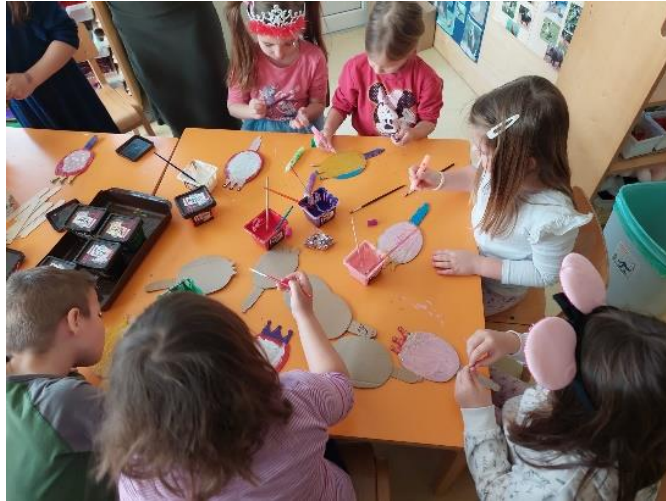
Slika 3: Izrada ogledalca