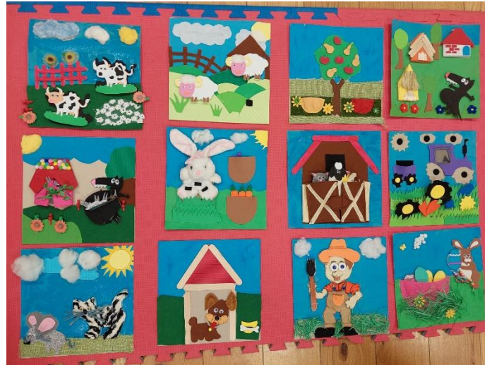
Slika 10: Didaktička slikovnica "Mala farma"

komunikacijskih vještina. Rani kontakt s knjigama i slikovnicama može potaknuti ljubav prema čitanju i stvarati čitalačke navike koje će trajati cijeli život. Ukratko, izrada didaktičkih slikovnica igra ključnu ulogu u razvoju literarne komunikacije kod djece, potičući njihovu jezičnu, vizualnu i maštovitu pismenost te potiče ljubav prema knjigama i čitanju.