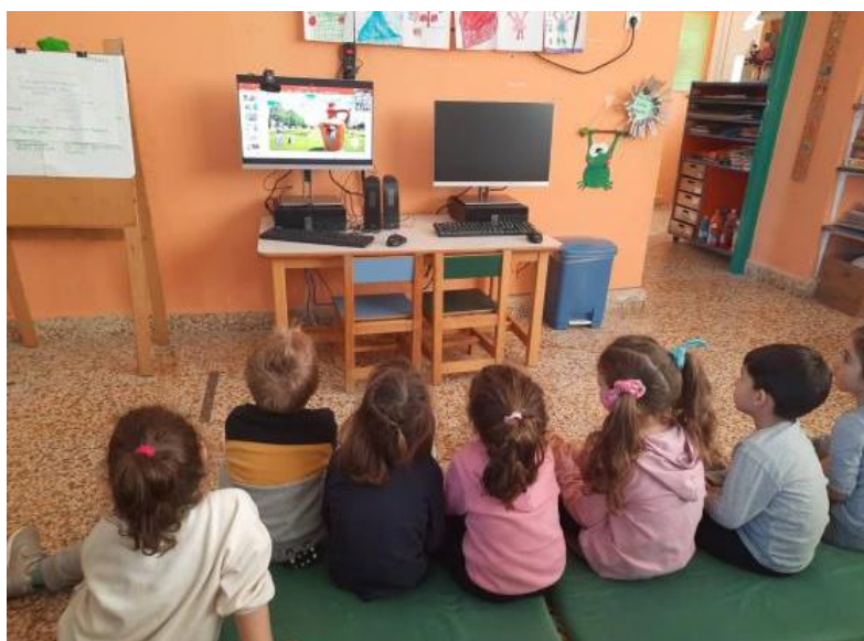
Slika 11. Djeca partneri iz Grčke gledaju prezentaciju skupine „Leptirići“

Obje su strane prezentirale svoju zemlju, pokazale fotografije svojih vrtića i prostorija unutar njih (slika 11). „Leptirići“ su partnerima iz Grčke otpjevali pjesmicu Kruška, jabuka, šljiva , dok su oni njima otpjevali Η κουκουβάγια (engl. The owl ). „Kockice“ su partnerima iz Rumunjske otpjevali pjesmicu Muhara , a oni su njima otpjevali pjesmicu Cinci račušte (engl. Five little ducks ). Nakon što su odslušali pjesmice, djeca su s partnerima pjevala pjesmice na njihovom jeziku.