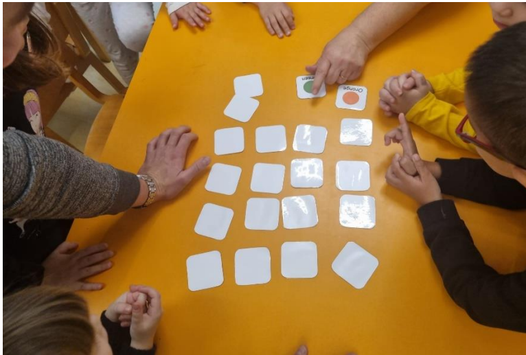
Slika 5. Igra pamtilica (Memory)

Kroz sve aktivnosti djeca su aktivno sudjelovala, postavljali su pitanja te bili zainteresirani za sve što im je bilo ponuđeno. Velik dio djece znao je nazive osnovnih boja na engleskom jeziku, a nazive sekundarnih boja rekli su im studenti te su zajedno razgovarali kako se miješanjem može dobiti nova boja.