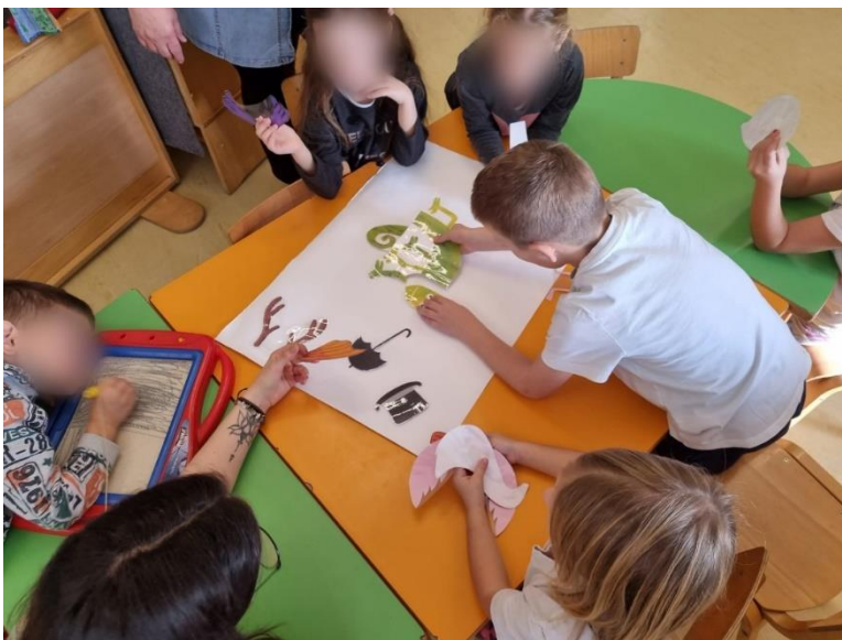
Slika 7. Aktivnost Mixed up chameleon - početak

Prilikom trećeg odlaska u vrtić u sklopu uvodnih aktivnosti, studenti su s djecom čitali slikovnicu The Mixed-up Chameleon koju je napisao Eric Carle. Prije samog čitanja, djeca su sa studentima ponovila boje koje se spominju u slikovnici. Ponovno su odigrali igru I spy something blue/green . Na hrvatskom su jeziku razgovarali o kameleonu te o tome kako može promijeniti boju ovisno o površini na kojoj se nalazi. Studenti su ih pitali znaju li što znači riječ 'smušen' te im objasnili da se na engleskom jeziku 'smušen' kaže mixed-up . Zatim su razgovarali o zoološkom vrtu. Studente je zanimalo koje su sve životinje djeca ondje vidjela, te znaju li ih imenovati na engleskom jeziku. Djeca su nabrojala lavove, tigrove, majmune, i ove su životinje znali imenovati i na engleskom jeziku. Iako su vidjeli i papige, kornjače, krokodile, tuljane, ribe... njih nisu znali imenovati na engleskom jeziku pa su s uzbuđenjem navodili sve što su vidjeli, kako bi im studenti otkrili riječi na engleskom jeziku.