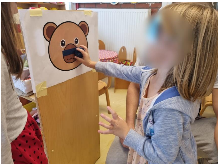
Slika 6. Igra 'Pin the nose'