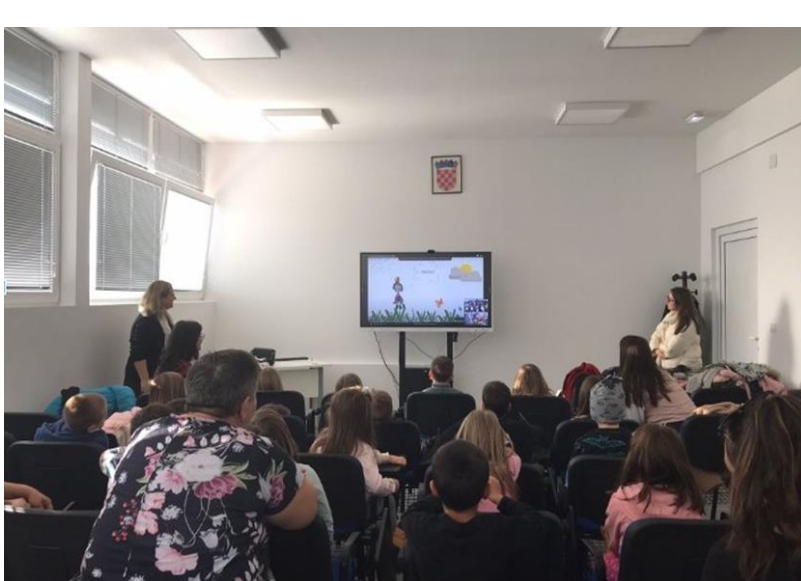
Slika 10. oVideopoziv s partnerima iz Grčke

Obje su strane prezentirale svoju zemlju, pokazale fotografije svojih vrtića i prostorija unutar njih (slika 11). „Leptirići“ su partnerima iz Grčke otpjevali pjesmicu Kruška, jabuka, šljiva , dok su oni njima otpjevali Η κουκουβάγια (engl. The owl ). „Kockice“ su partnerima iz Rumunjske otpjevali pjesmicu Muhara , a oni su njima otpjevali pjesmicu Cinci račušte (engl. Five little ducks ). Nakon što su odslušali pjesmice, djeca su s partnerima pjevala pjesmice na njihovom jeziku.