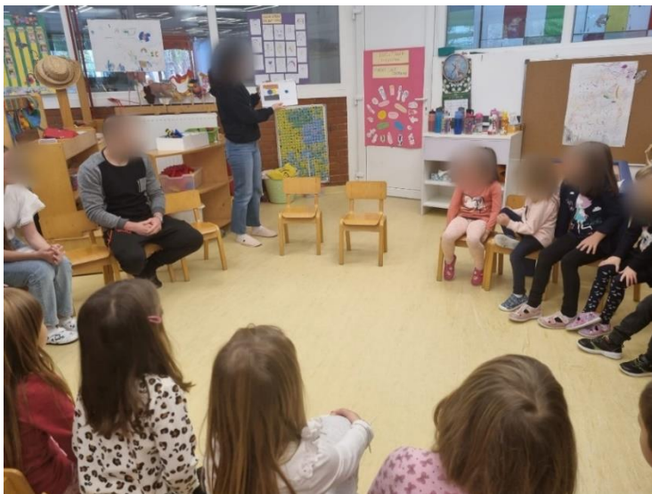
Slika 4. Dijaloško čitanje slikovnice „Little Blue, Little Yellow“

Studenti su bili podijeljeni u dvije skupine od kojih je svaka radila s jednom vrtičkom skupinom. Početni je cilj bio da se djeca upoznaju sa studentima te da ih oni uvedu u engleski jezik i da im uz zabavne i primjerene aktivnosti olakšaju komunikaciju na engleskom jeziku. U obje su skupine provedene tri aktivnosti tijekom kojih su studenti, nakon uvodnih aktivnosti, zajedno s djecom, dijaloški čitali slikovnice na engleskom jeziku te nakon toga provodili razne aktivnosti koje su pripremili.