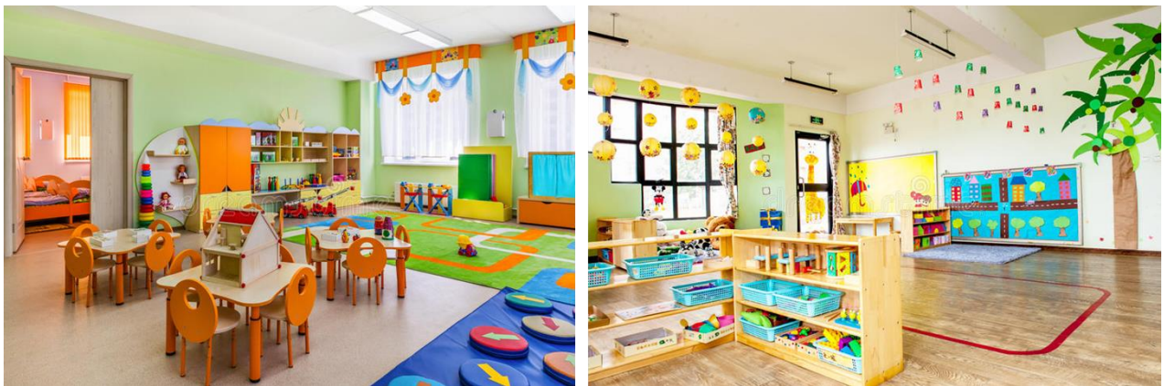
Slika 1. Primjeri organizacije unutarnjeg prostora u vrtiću

komunikacijskih vještina djece, uključujući i razvoj vještina suradnje i ponašanja u timu, te samostalnost u donošenju odluka (primjerice prepoznavanje aktivnosti koju treba provesti sukladno zadanom zadatku). Vrtićki prostor, osim ispunjavanja infrastrukturnih zahtjeva, mora omogućiti djeci nesmetano kretanje, međusobnu interakciju i neovisnost. Prostor mora biti organiziran na način da potiče međusobnu komunikaciju i kontinuirano susretanje djece, što povećava razinu dinamičnosti i međusobne suradnje djece i suradnje djece s odgajateljima (Ivanušec, 2021). Primjeri organizacije unutarnjeg i vanjskog prostora u vrtiću nalaze se na Slikama 1 i 2.