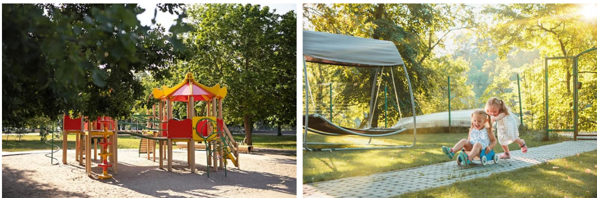
Slika 2. Primjeri organizacije vanjskog prostora u vrtiću

Međusobna komunikacija, interakcija i suradnički odnosi djece te djece i odgajatelja su ključna komponenta i preduvjet za razvoj i stvaranje kvalitetne odgojno-obrazovne prakse na razini vrtića, koja se kontinuirano razvija u odnosu na interese, razinu samostalnosti i potreba