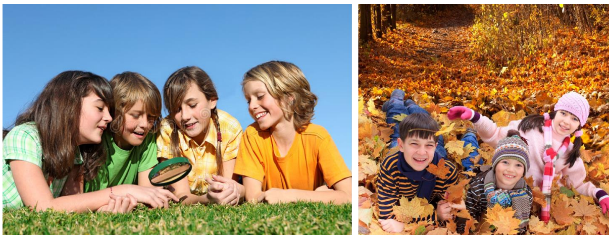
Slika 3. Slobodna igra na otvorenom

Igra s vršnjacima i u prirodi jedna je od prvih aktivnosti koje nisu usmjerene prema majci koje se pojavljuju u ranom životu i predstavlja vrlo promišljen i stvaran oblik ponašanja za dojenče i dijete. Slobodna igra, osobito u prirodnim okruženjima, može biti važna odrednica socijalizacije i kognitivnog razvoja. Istraživanje o preferencijama djece o okruženju za učenje i razvoj, pokazalo je da prostori na otvorenom koje bi djeca mogla dizajnirati ne bi bila asfaltna ili zemljana igrališta s razbacanim dijelovima opreme za igranje, već područja puna raznih vrsta biljaka, životinja, zemlje, vode, blata, prljavštine, i pijeska (White i Stoecklin, 1998). Većina odgajatelja i roditelja slaže se da je igra na otvorenom važan i prirodan dio zdravog razvoja djeteta (Sobel, 2017) jer prirodni razvoj kroz slobodnu igru u prirodi potiče mnoge vještine koje su potrebne u odrasloj dobi. Ove vještine uključuju socijalnu sposobnost rješavanja problema, sigurnosne vještine i kreativno razmišljanje (Summers i sur., 2019)