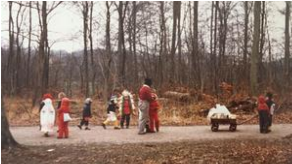
Slika 7. Šumski vrtić u Danskoj 1970. godine

učiteljima ili odgajateljima (Forest School Foundation, 2020). Prikaz aktivnosti šumskog vrtića u Danskoj 1970. godine nalazi se na Slici 7.