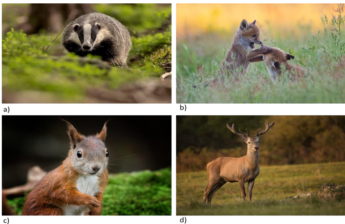
Slika 4. Neke vrste sisavaca koje žive u šumama umjerenog pojasa: a) jazavac, b) lisica, c) vjeverica, d) obični jelen.