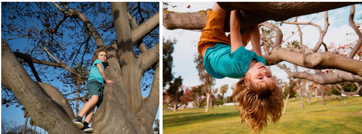
Slika 8. Fizički izazovi i rizično ponašanje

strahove i tjeskobu dok istovremeno razvijaju samopouzdanje, samoučinkovitost i razumijevanje onoga što zapravo znači biti siguran. Učenje upravljanja rizikom u šumskim vrtićima ima važne kognitivne prednosti, kao što su razvoj vještina timskog rada, motivacije, koncentracije i ustrajnosti, te potiču razvoj kreativnosti i sposobnost suočavanja s problemima. Fizički izazovi također dovode do različitih emocionalnih reakcija (strah i uzbuđenje), no djeca često namjerno traže rizike koje posljedično rezultiraju pozitivnim emocijama (radost i uzbuđenje). Ovaj način suočavanja s rizicima kod djece potiče razvoj sposobnosti socijalnih vještina i socijalnog zdravlja i dobrobiti (Coe, 2016). Primjeri fizičkih izazova i rizičnog ponašanja prilikom igre na otvorenom nalaze se na Slici 8.