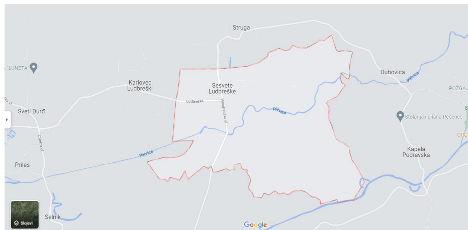
Slika 1. Geografski položaj Sesveta Ludbreških