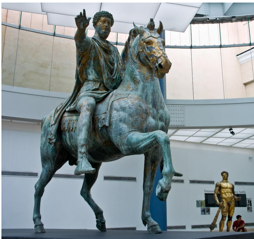
Slika br. 1: Nepoznati autor, Marko Aurelije