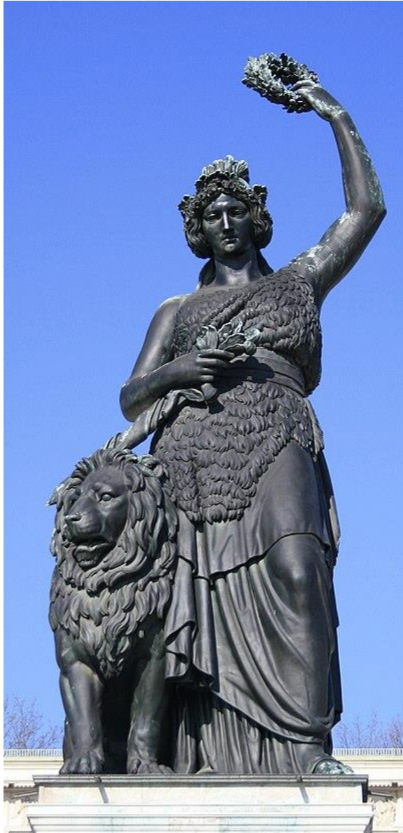
Slika br. 3: Bavaria