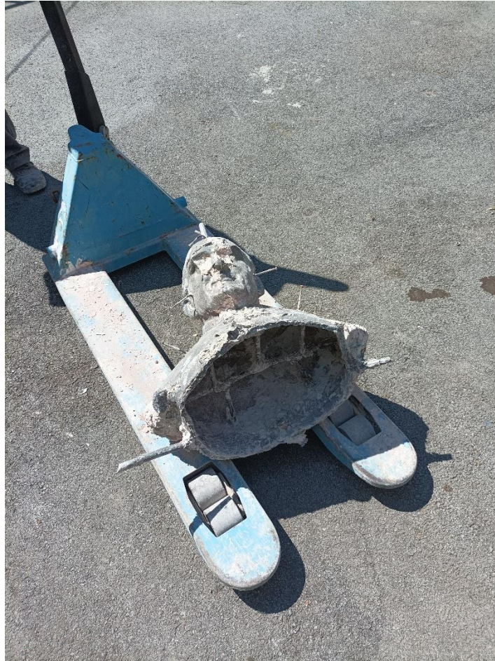
Slika 1: Skulptura izlivena u bronci

mješavina cigle, mljevene, i gipsa, i s tim šamotom se iznutra obloži figura i izvana. Dobijete jednu šamotnu kocku, koja se zatim ide sušiti. Budem ti pokazao, da ti bude jednostavnije. Ovdje gdje je bronca, tu je bio vosak. Automatski smo voskom dobili debljinu bronce. Ovo unutra je ulijevni sistem kanala, tu dolazi taj šamot. S vanjske strane dolazi plašt.