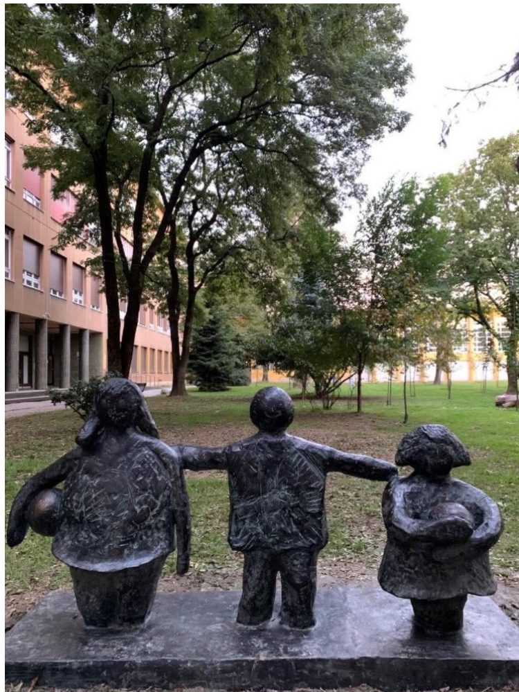
Slika br. 8: Spomenik djetetu ispred Fakulteta