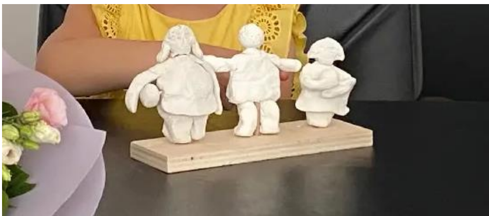
Slika br. 7: Izabrano idejno rješenje