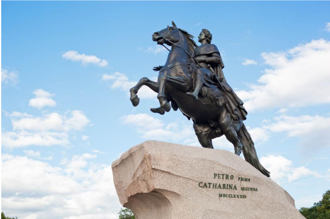
Slika br. 2: E.-M. Falconet, Petar Veliki