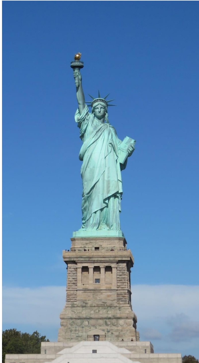
Slika br. 4: Kip slobode