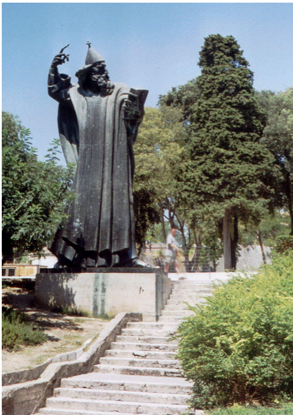
Slika br. 6: Ivan Meštrović, Grgur Ninski u Splitu