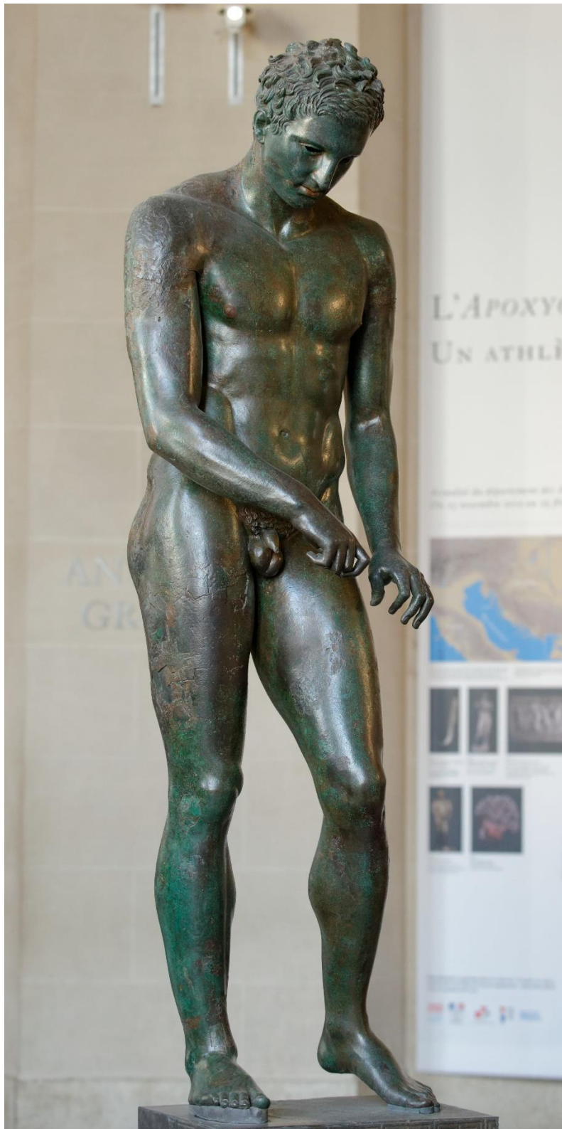
Slika br. 5: Nepoznati autor, Apoksiomen (Čistač strigila)