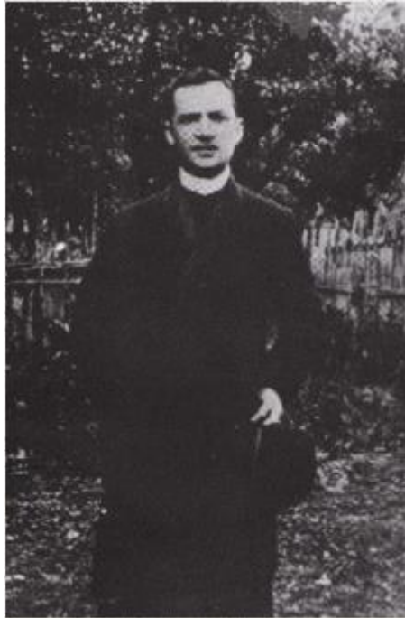
Slika 1. Izidor Poljak (1883. – 1924.)

Ime koje danas škola nosi dobila je još 1990. godine po svećeniku i pjesniku Izidoru Poljaku (Spomenica Osnovne škole Izidora Poljaka Višnjica).