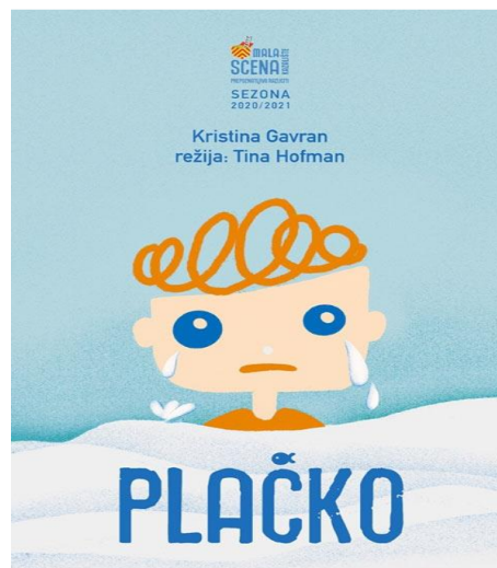
Slika 1. plakat za predstavu Plačko

Predstava se sastoji od sedam scena kroz koje pratimo dječaka Plačka koji ima supermoć-plakanje no, on već toliko dugo plače da ga više nitko ne zove pravim imenom niti ga se on više sjeća pa kroz predstavu pokušava pronaći svoje izgubljeno ime. U pronalasku imena pomažu mu Zlatna ribica, Profesorica Suzić, Krokodil i Mudri Luk. Scenografija je vrlo jednostavna kuhinja u kojoj zapravo dječak Plačko kreće na putovanje za svojim izgubljenim imenom. Likovi koje susreće su stvari iz njegove kuhinje koje on oživljava u svojoj mašti. Predstava se bavi emocijama i kako se s njima nositi te kako ih izražavati. Likovi Majka, Zlatna ribica, Profesorica Suzić, Krokodil i Mudri Luk pjevaju u rimi i svakom pojavom na sceni daju pouku o emocijama („Prije plakanja duboko udahni i pokušaj riječima opisati što te muči“). Kroz predstavu se spominju dani u tjednu, brojanje, abeceda i kruženje vode u prirodi, pa samim time osim emocija, djeci (gledateljima) približava i navedene stvari. Dječak Plačko na kraju pronalazi svoje ime te je kroz svoju potragu naučio da ima i drugih emocija te da i odrasli smiju plakati, ali se uvijek trebamo truditi riječima objasniti kako se osjećamo.