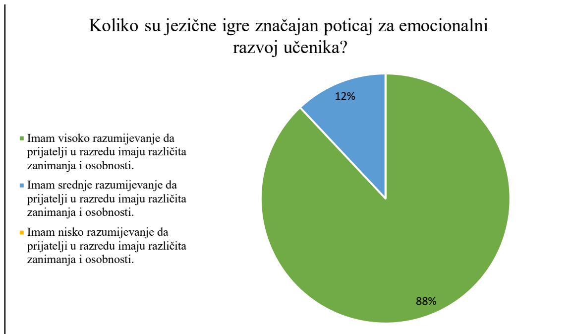
Grafikon 3. Stavovi ispitanika – koliko su jezične igre značajan poticaj za emocionalni razvoj učenika

Peti je cilj istraživanja ispitati stav učenika o poticanju jezičnih igara korištenih na satu lektire za čitanje knjiga. 47,06 % ispitanika odgovorilo je da su ih jezične igre potaknule na čitanje knjiga, njih 41,18 % je odgovorilo da ih jezične igre niti potiču, niti ne potiču na čitanje, a 11,76 % ispitanika odgovorilo je da ih jezične igre ne potiču na čitanje knjiga (grafikon 4). S obzirom na dobivene rezultate, može se potvrditi peta hipoteza koja pretpostavlja da će jezične igre korištene na satu lektire poticati učenike na čitanje knjiga.