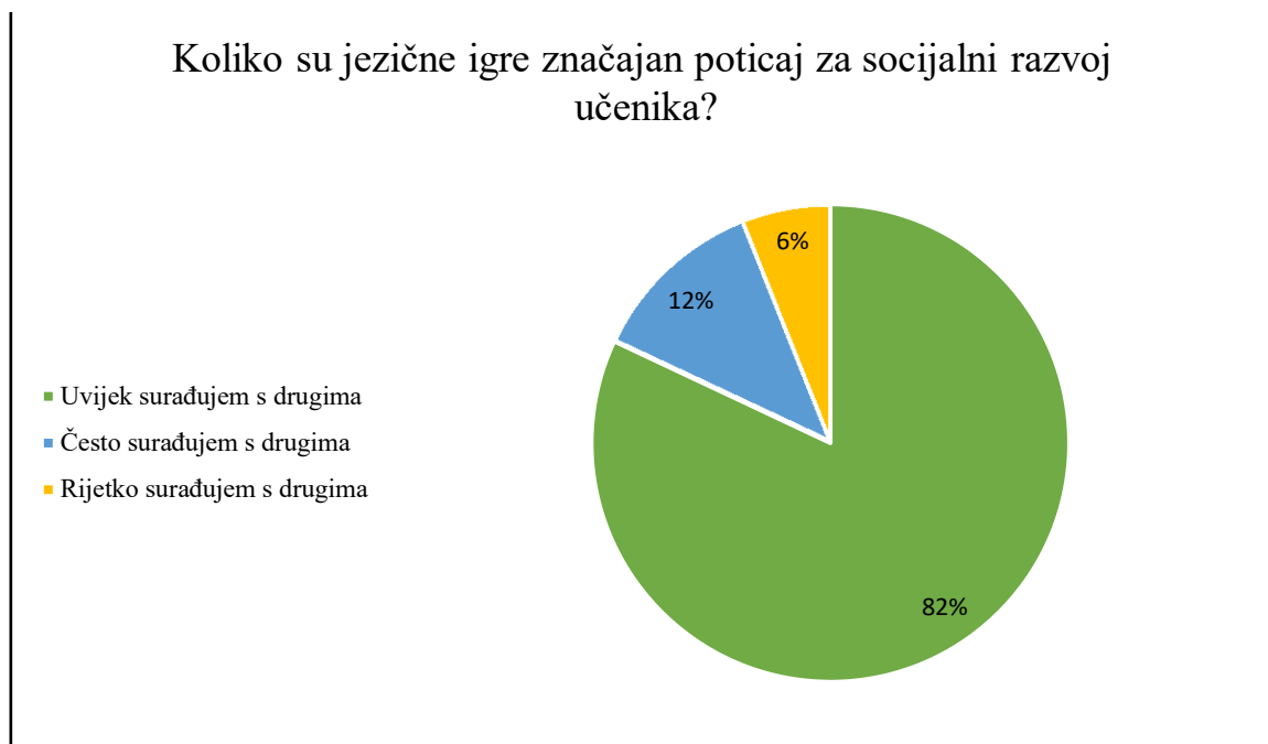
Grafikon 2. Stavovi ispitanika – koliko su jezične igre značajan poticaj za socijalni razvoj učenika

Četvrti je cilj istraživanja ispitati koliko su jezične igre korištene u području jezika i komunikacije bile značajan poticaj za emocionalni razvoj učenika. Željelo se ispitati koliko učenici imaju razumijevanja da prijatelji u razredu imaju različita zanimanja i osobnosti. Rezultati pokazuju da 88,24 % ispitanika ima visoko razumijevanje da prijatelji u razredu imaju različita zanimanja i osobnosti, njih 11,76 % ima srednje razumijevanje, dok niti jedan ispitanik (0 %) nije odgovorio da ima nisko razumijevanje da prijatelji u razredu imaju različita zanimanja i osobnosti (grafikon 3). S obzirom na dobivene rezultate, može se potvrditi četvrta hipoteza koja pretpostavlja će jezične igre korištene u području jezika i komunikacije potaknuti učenike da imaju visoko razumijevanje da prijatelji u razredu imaju različita zanimanja i osobnosti. Rezultati su pokazali da korištenje jezičnih igara može potaknuti učenike na prihvaćanje drugih u razredu te samim time poticati emocionalni razvoj.