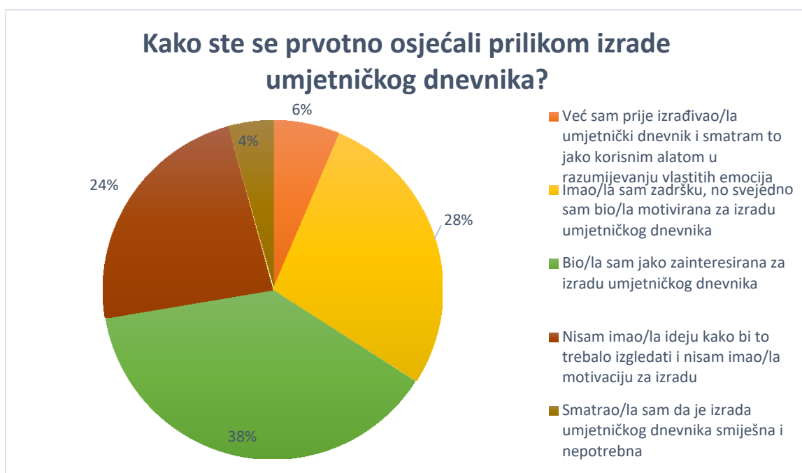
Grafikon 4: Prvotni osjećaji prema izradi umjetničkog dnevnika

Sljedeće pitanje: „Kako ste se prvotno osjećali prilikom izrade umjetničkog dnevnika?“, imalo je pet ponuđenih odgovora i rezultati su dosta podijeljeni. U ponuđenim odgovorima nastojalo se obuhvatiti širok spektar emocija i razmišljanja (dobivenim prvotno iz vlastitog iskustva rada s umjetničkim dnevnikom), ali ipak s ograničenjem na zatvoreni oblik zbog lakše analize rezultata. Najveći broj ispitanika, čak 18 odgovorilo je: „Bio/la sam jako zainteresirana za izradu umjetničkog dnevnika.“. Odmah iza njega po broju ispitanika, njih 13, odgovorilo je: „Imao/la sam zadržku, no svejedno sam bio/la motivirana za izradu umjetničkog dnevnika.“. Od pozitivnih odgovora zainteresiranih za proces i izradu umjetničkog dnevnika bio je još odgovor: „Već sam prije izrađivao/la umjetnički dnevnik i smatram to jako korisnim alatom u razumijevanju vlastitih emocija.“, odabralo je 3 ispitanika. Od ostalih ponuđenih odgovora dva su još s negativnom konotacijom naspram tematike i procesa umjetničkog dnevnika. To su bili odgovori: „Nisam imao/la ideju kako bi to trebalo izgledati i nisam imao/la motivaciju za izradu.“, kojeg je odabralo čak 11 ispitanika i „Smatrao/la sam da je izrada umjetničkog dnevnika smiješna i nepotrebna.“, kojeg su odabrala 2 ispitanika.