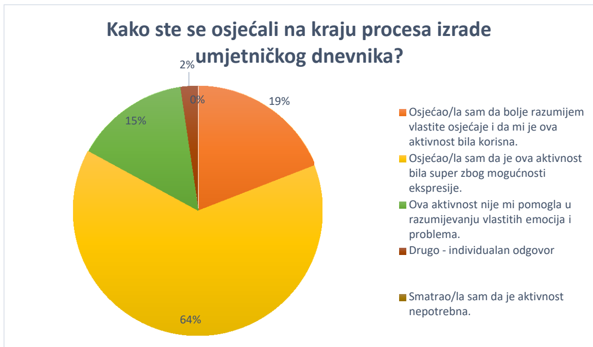
Grafikon 5: Osjećaji prema izradi umjetničkog dnevnika na kraju procesa

otпустити dio toga i osjetiti neku vrstu olakšanja.“ Odgovor „Smatrao/la sam da je aktivnost nepotrebna.“, nije označio nitko od ispitanika.