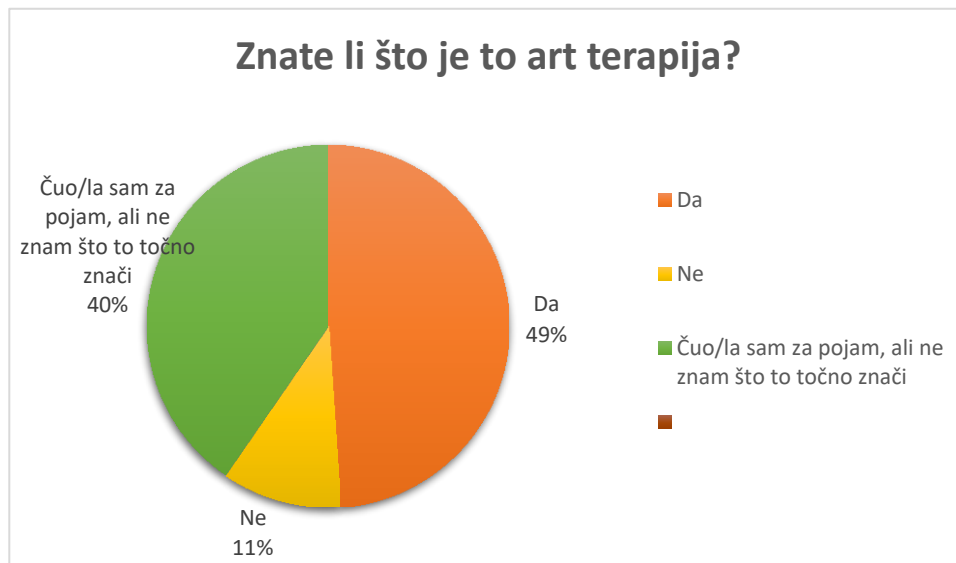
Grafikon 1: Znanje o pojmu art terapije

Drugo je pitanje bilo otvorenog tipa i glasilo je „Ako znate, gdje/od koga ste čuli o art terapiji?“ i ispitanici su mogli u kratkom odgovoru napisati, ako su na prethodno pitanje odgovorili s „Da“ ili „Čuo/la sam za pojam, ali ne zna što to točno znači“, iz kojeg izvora im je taj pojam poznat. Ovim se htjelo ispitati znaju li studenti za pojam art terapije iz sustava obrazovanja ili vanjskih izvora poput knjiga, socijalnih medija i platformi ili pak nekog trećeg izvora. Većina ispitanika, čak 60 %, za pojam je saznala tijekom fakultetskog obrazovanja, ponajviše na kolegijima koje vodi profesorica Balić (kolegiji poput Metodika likovne kulture), dok je 30 % ispitanika za pojam art terapije saznalo preko različitih internetskih stranica i socijalnih platformi poput Pinteresta, Instagrama i sl. Dva ispitanika saznala su za pojam putem reklama ili od prijateljice, dok je jedan ispitanik o pojmu art terapije saznao u direktnoj suradnji sa stručnim timom tijekom prakse u vrtiću (također u sklopu fakultetskog obrazovanja).