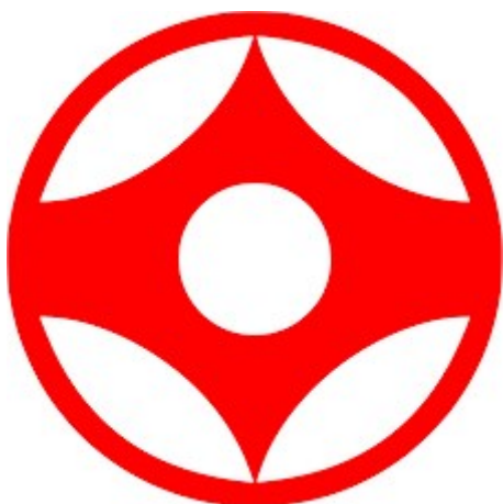
Slika 1 Kanku- simbol kyokushin karatea