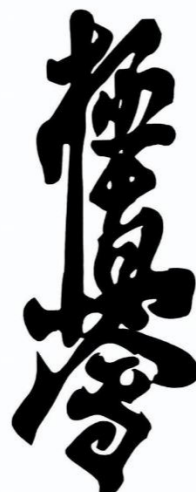
Slika 2 Kanji- znak za kyokushin karate