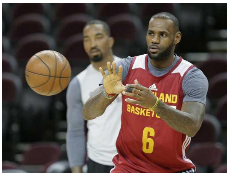
Slika 7: Hvatanje lopte (dodavanje iznad struka)