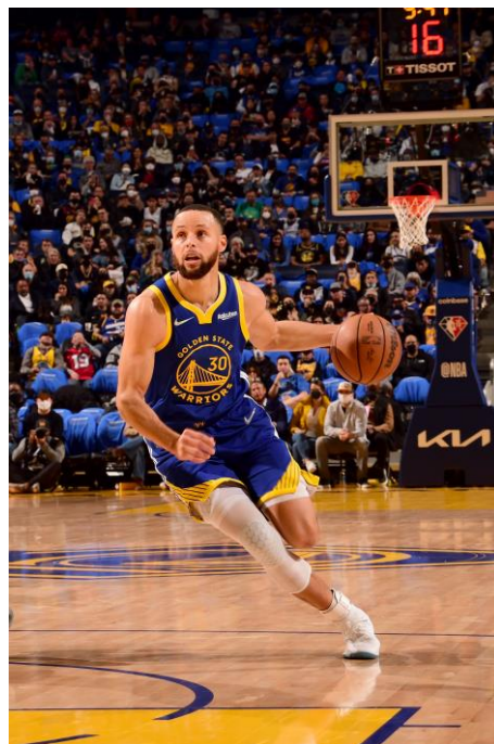
Slika 8: Vođenje lopte

(Krause, Meyer i Meyer, 2008, str. 68). Važno je da igrač ne gura loptu iz lakta već da ju vodi uz pomoć dlana i prstiju. Tijekom vođenja ruka kojom se ne vodi i tijelo uvijek trebaju biti između lopte i suparničkog igrača, kako bi se zaštitila lopta. Igrač mora krenuti voditi loptu prije nego podigne stajnu nogu kako ne bi napravio korake. Kako ne bi napravio prekršaj nošene lopte igrač tijekom vođenja mora uvijek imati ruku iznad lopte, a nikada ispod nje. Kada igrač jednom krene u vođenje i primi loptu s dvije ruke (prekine vođenje), više nema pravo ponovno voditi loptu (osim ako mu ju suigrač ponovno ne doda). Vođenje se može vježbati u mjestu ili u pokretu. Postoje nisko i visoko vođenje i razne promjene smjera vođenja kao što su: prednja promjena, stražnji pivot dribling, vođenje unatrag, vođenje iza leđa (stražna promjena) i vođenje lopte kroz noge (srednja promjena) (Krause, Meyer i Meyer, 2008).