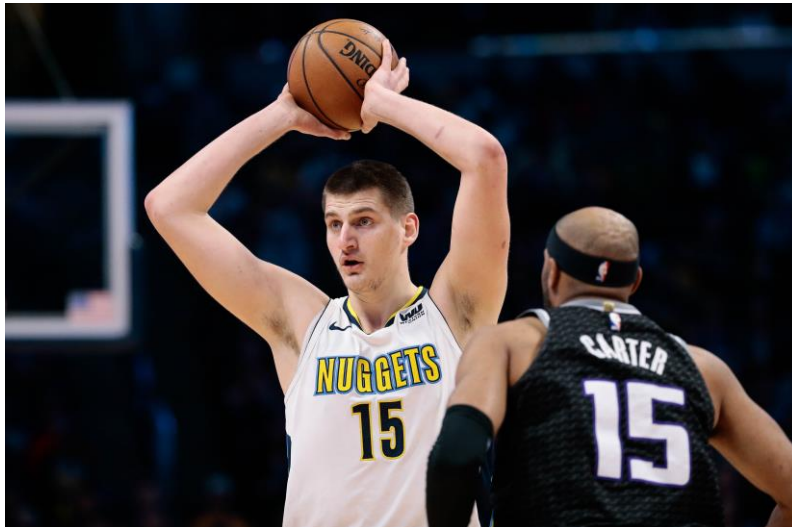
Slika 4: Dodavanje iznad glave