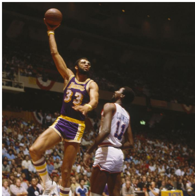
Slika 12: Skok-horog

Igrači koji igraju ovom tehnikom trebali bi biti dobri šuteri sa linije slobodnih bacanja jer se igranjem leđnom tehnikom ostvaruje puno kontakta.