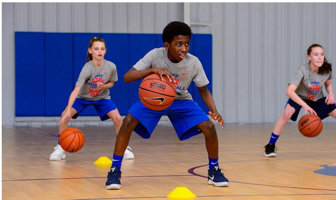
Slika 13: Mini košarka

U nastavi tjelesne i zdravstvene kulture mini košarka je jedan od načina na koji se košarka može igrati na nastavi. „I ovdje učenike najprije upoznamo s ciljem igre, s osnovnim pravilima koja ćemo nadopunjavati u tijeku igre“ (Findak, 1996, str. 178). Prema Findaku (1996) dječja košarka igra se sa dvije ekipe do 6 igrača, a igra počinje podbacivanjem lopte. Igra traje 2 x 10 minuta s odmorom od 3 minute ako je potrebno. Ostatak igre isti je kao i kod normalne košarke. Uloga učitelja tijekom igre je da bude sudac.