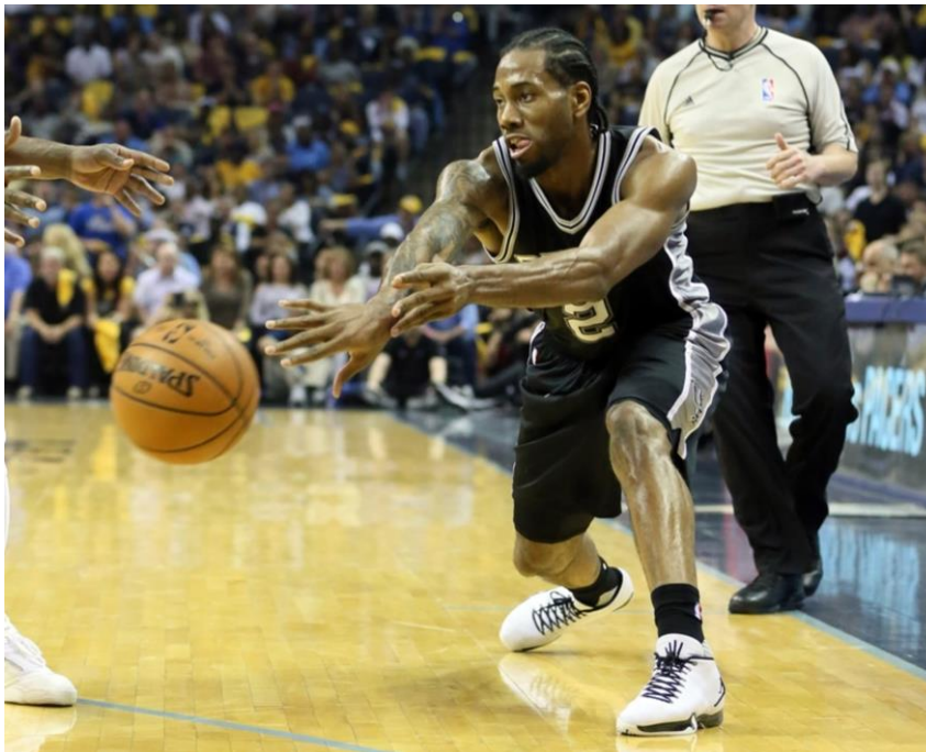
Slika 3: Dodavanje lopte od podloge

Tehnika dodavanja lopte od podloge je ista kao i kod dodavanja u visini prsiju, samo ovdje dlanovi završavaju gledajući prema dolje. Ova vrsta dodavanja koristi se kako bi lopta prošla ispod ruke protivničkog igrača. Uspješno dodavanje od podloge dolazi do struka primatelja lopte. „Dodavanje lopte bi trebalo biti izvedeno eksplozivno, tako da lopta odskoči do visine kuka primatelja lopte“ (Krause, Meyer i Meyer, str. 62). Kao smjernica igrač bi trebao ciljati točku oko dvije trećine između sebe i primatelja lopte za uspješno dodavanje.