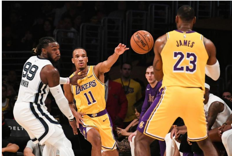
Slika 6: Dodavanje jednom rukom

Dodavanje jednom rukom koristi se kada obrambeni igrač vrši pritisak te je blizu suparničkog igrača. „Dodavanje lopte s potiskom jednom rukom je najvažnije dodavanje u napadačkoj igri.“ (Krause, Meyer i Meyer, 2008, str. 64). Sve vrste dodavanja koje su opisane u potpoglavljima prije mogu se izvesti jednom rukom. U početnoj poziciji je lakat blago savijen, a dodavanje se izvodi potiskom jedne ruke.