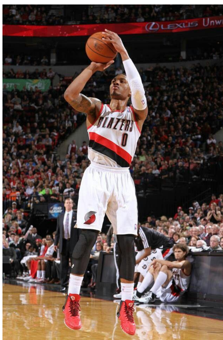
Slika 11: Skok-šut