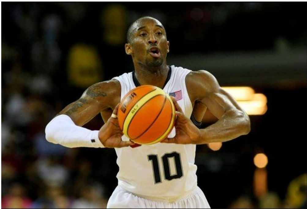
Slika 2: Dodavanje u visini prsiju

Direktno dodavanje lopte u visini prsiju ili dodavanje paralelno s podlogom je najčešće dodavanje u košarci. „Jednostavna geometrija (najkraća udaljenost između dvije točke je ravna linija) dokazuje da je izravno dodavanje po zraku brže nego lob dodavanje ili dodavanje od podloge (indirektno)“ (Krause, Meyer i Meyer, 2008, str. 59). Dodavanje se izvodi tako da loptu držimo blizu tijela na sredini prsiju s laktovima uz tijelo. Kod direktnog dodavanja dlanove držimo tako da su palci okrenuti prema gore. „Da bi dodao loptu igrač opruža laktove i dlanove te rotira dlanove prema van tako da mu palčevi završavaju okrenuti prema dolje“ (Krause, Meyer i Meyer, 2008, str. 61). Kada igrač ima loptu kod prsiju i dlanove okrenute prema gore, čini blagi iskorak te pokretima zgloba i prstiju dodaje loptu. Loptu treba ispratiti prvim i drugim prstom ruke kako bi lopta imala pravilan smjer i stražnju rotaciju (Wissel, 2008).