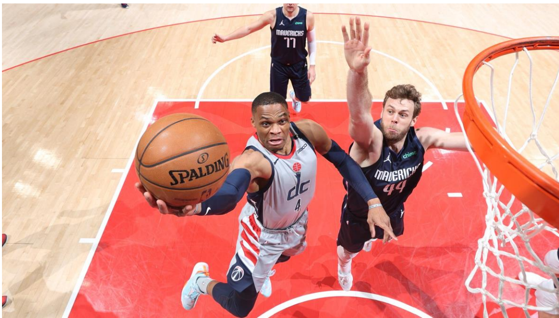
Slika 9: Polaganje

Košarkaška pravila dopuštaju igraču da napravi dva koraka prije nego što ponovno mora voditi loptu. Ako igrač ulovi loptu bez vođenja može napraviti samo dva koraka. Bez vođenja igrač će šutirati ili položiti loptu. Dvokorak iz kretnje se izvodi tako da igrač odskoči suprotnom nogom od ruke kojom će položiti loptu (ako je dešnjak, odskočiti će lijevom nogom, a položiti desnom i obrnuto). Kada igrač krene u dvokorak mora čvrsto držati loptu s dvije ruke i podignuti je do razine prsa. Nakon toga slijedi odraz i pruženje ruke kojom se lopta polaže od table ili u koš. Dvokorak iz driblinga izvodi se tako da igrač napravi jedan korak nogom suprotnom od one ruke kojom će položiti, zatim jednom vodi loptu i kreće u dvokorak. „Svi igrači bi trebali naučiti ubacivati loptu u koš polaganjem sa lijevom i desnom rukom“ (Krause, Meyer i Meyer, 2008, str. 99). Prilikom polaganja važan je skok igrača. Prilikom skoka koljeno se ispravlja prije vrhunca skoka (Meyer, 2008).