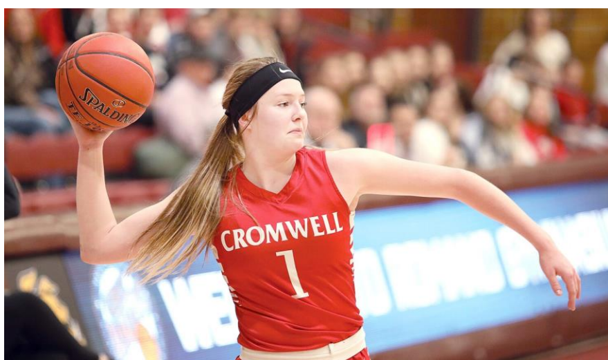
Slika 5: Bejzbol dodavanje

Bejzbol dodavanje koristi se tijekom brzog kontranapada, najčešće se dodaje preko polovice terena igraču koji je iza protivničke obrane. Bejzbol dodavanje se izvodi tako da igrač pivotira na zadnjoj nozi i okreće tijelo u smjeru gdje dodaje loptu. „Podignite loptu do uha, sa laktom prema unutra, rukom koja dodaje iza, a slobodnom rukom ispred lopte (kao hvatač koji počinje bacati baseball loptu) (Wissel, 2008, str. 84). Nakon što je igrač podignuo loptu prebacuje težinu na prednju nogu i pružanjem ruku i nogu izbacuje loptu.