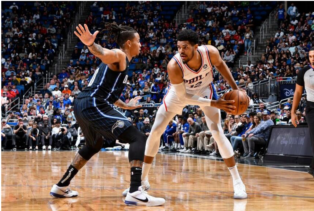
Slika 1: Prednji pivot