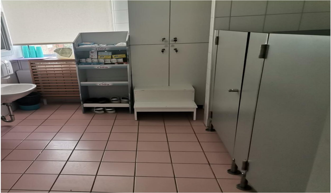
Slika 11. Sanitarije vrtičke odgojne skupine