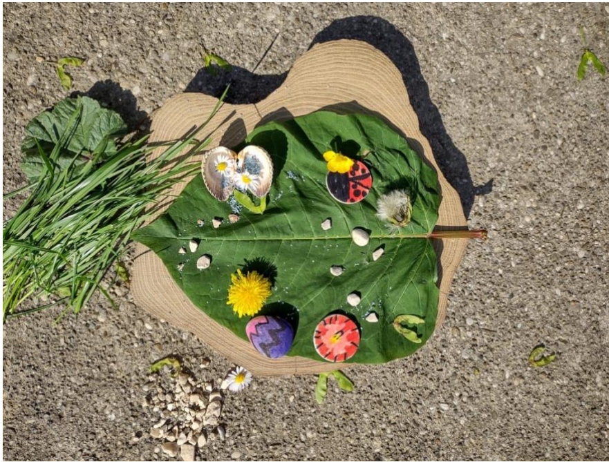
Slika 29. Land art skulptura na drvenom podlošku

Jedna likovno nadarena djevojčica na ovom je radu iskoristila svu svoju kreativnost i volju te uložila velik trud i vrijeme. U isto vrijeme, moglo se vidjeti kako uživa u kombiniranju različitih šarenih materijala postavljajući ih u skladan odnos. Uključila je skoro sve materijale, iz dvorišta i iz vrtića. Posebno je istaknula detalj sa školjkicom u lijevom gornjem dijelu rada ( Slika 29. ). U otvorenu školjkicu „pospremila“ je tratinčice s plavim pijeskom što ukazuje na to kako je na vrlo kreativan način pazila na detalje i unesla se u dubinu svog rada.