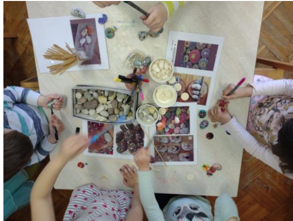
Slika 20. Crtanje po kamenju

mandale) što ih je posebno motiviralo i usmjerilo u aktivnosti. Koristili su različite boje, linije, oblike ( Slike 21. i 22. ). Jedna djevojčica, iznimnog interesa, oslikala je niz drvenih oblutaka i kamenja koristeći cijeli spektar boja ( Slika 22. ).