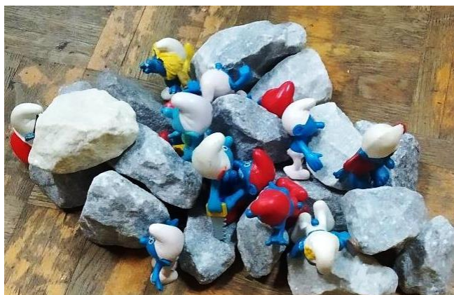
Slika 14- izrada sela za štrumfove