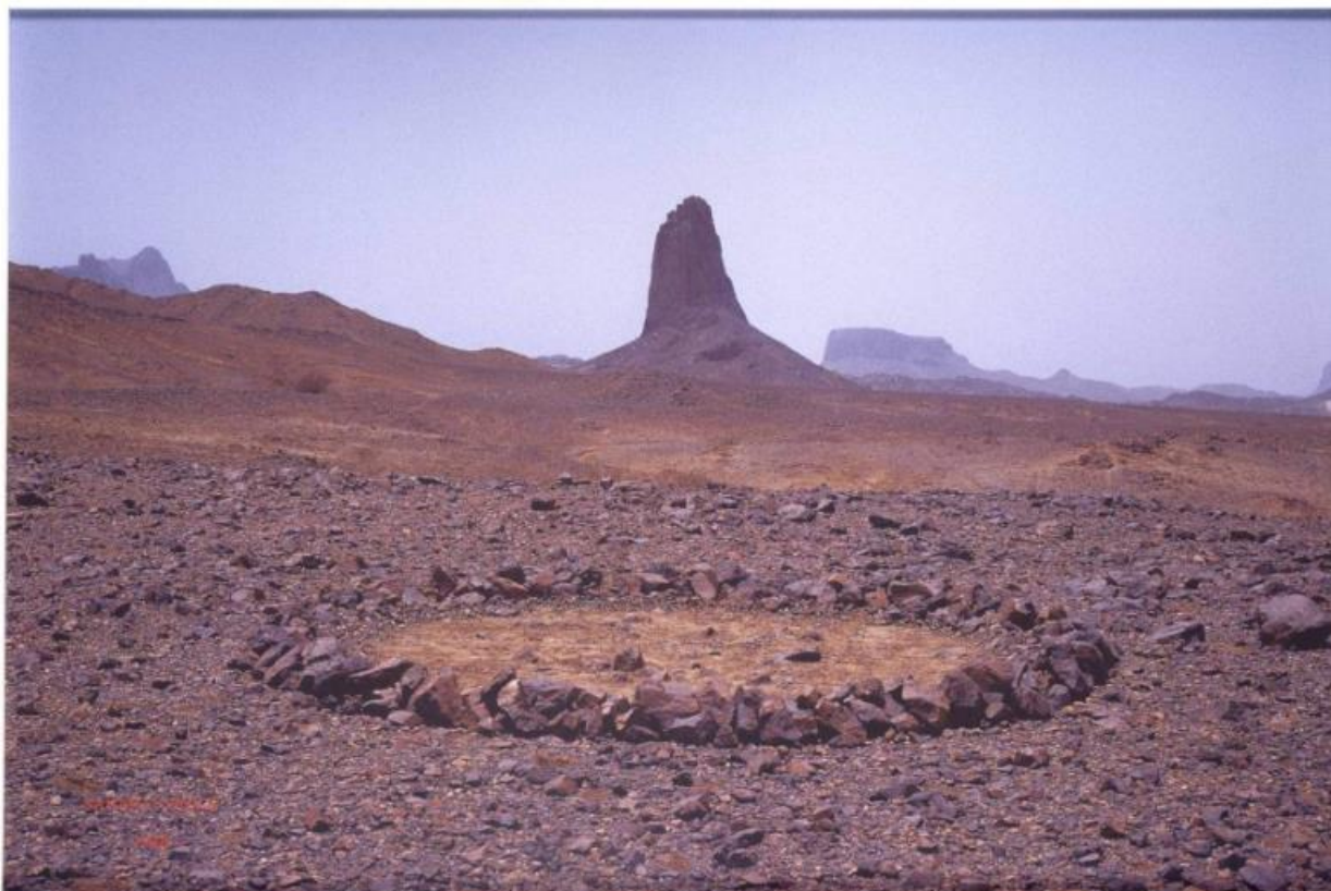
Slika 1. Richard Long CBE, Sahara Circle (1988) https://www.tate.org.uk/art/art-terms/1/land-art 3.7.2023

Umjetnici u svojim intervencijama koriste prirodu, njezin krajobraz kao svoje platno a kamen, zemlju, grančice, vjetar, kišu i sve što nas okružuje, kao osnovno sredstvo u stvaranju umjetničkog djela. Ono je izravna intervencija u krajoliku, transformacija prirode bez okvira, bez stalaka i bez ograničenja. Neke su intervencije trajnije pa se mijenjaju zajedno sa vremenskim prilikama a neke su kratkoročno vidljive.