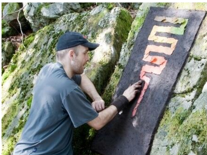
Slika 8. Umjetnik u procesu , https://artfulparent.com/richard-shilling-on-land-art-for-kids/ 24.9.202