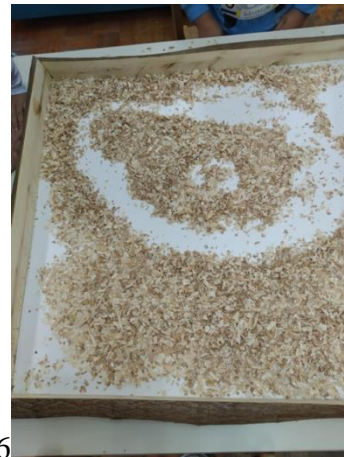
Slike 22, 23 i 24 - Spirale