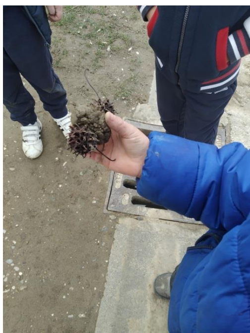
Slika broj 13 – Izrada kućice za puža

Njegovanje kreativnog odnosa prema načinu na koji doživljava svijet dijete izražava kroz jezik umjetnosti. Na taj način odražava svoja shvaćanja, propituje o svijetu, traži odgovore. Preispituje što sve sudjeluje u formiranju njegove svijesti i osjećaja. Na taj način omogućuje dublju uključenost u oslobađajuće procese nebrojenih mogućnosti čovjekova stvaralaštva. (Radovan-Burja, 2011).