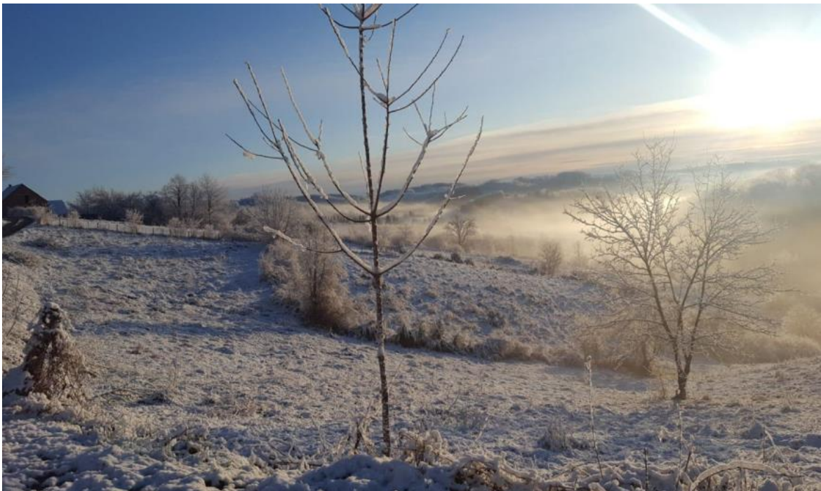
Slika 5. Fotografija krajolika

uvjeta. (Malpas, 1998) Djetetu fotografija može služiti kao inspiracija. Na njemu je da istražuje mogućnosti kroz igru i istraživanje. Ako djetetu ponudimo da samostalno dokumentira tada njegovom učenju dajemo mogućnost dizanja stepenicu više. Također djetetovo dokumentiranje vlastite „Intervencije“ daje mogućnost daljnjem promatranju i konstruiranju kao i postavljanju daljnjih pitanja i traženju odgovora i hipoteza. Dijete uz pomoć fotografije svog djela i djela drugih umjetnika može pronaći novu inspiraciju u svom kreativnom učenju i istraživanju sebe i svijeta.