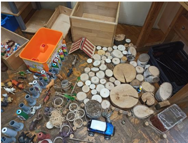
Slika 38- Igre u centru građenja

Aktivnosti sa Land artom su se nastavile te se djecu i dalje potiče da stvaraju i rade na drugačiji način koristeći raznovrsne materijale u sobi i na dvorištu. Često djeca sama imaju potrebu komentirati koje materijale koriste ili su jednom koristila za neku aktivnost. Potiču jedni druge u izradi. Još uvijek je najzastupljeniji motiv izrade priča i rođendanska torta te slova. Izbor onoga što su djeca radila često su bila povezana sa projektom i sklopom aktivnosti u svim centrima aktivnosti.