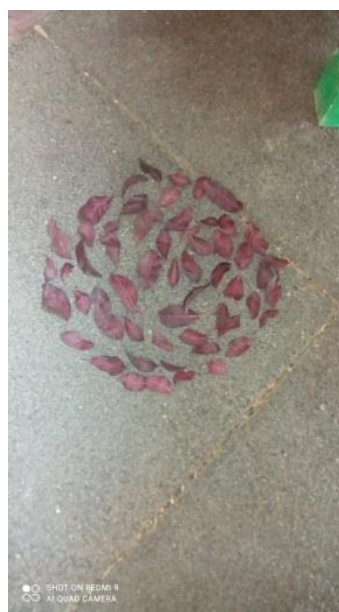
Slike 32,33,34,35,36 i 37 - Skulpture od lišća