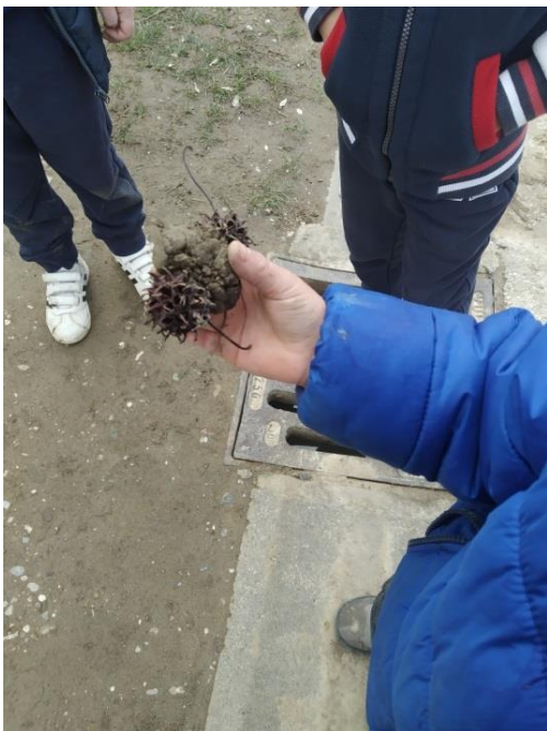
Slika broj 13 – Izrada kućice za puža

Njegovanje kreativnog odnosa prema načinu na koji doživljava svijet dijete izražava kroz jezik umjetnosti. Na taj način odražava svoja shvaćanja, propituje o svijetu, traži odgovore. Preispituje što sve sudjeluje u formiranju njegove svijesti i osjećaja. Na taj način omogućuje dublju uključenost u oslobađajuće procese nebrojenih mogućnosti čovjekova stvaralaštva. (Radovan-Burja, 2011).