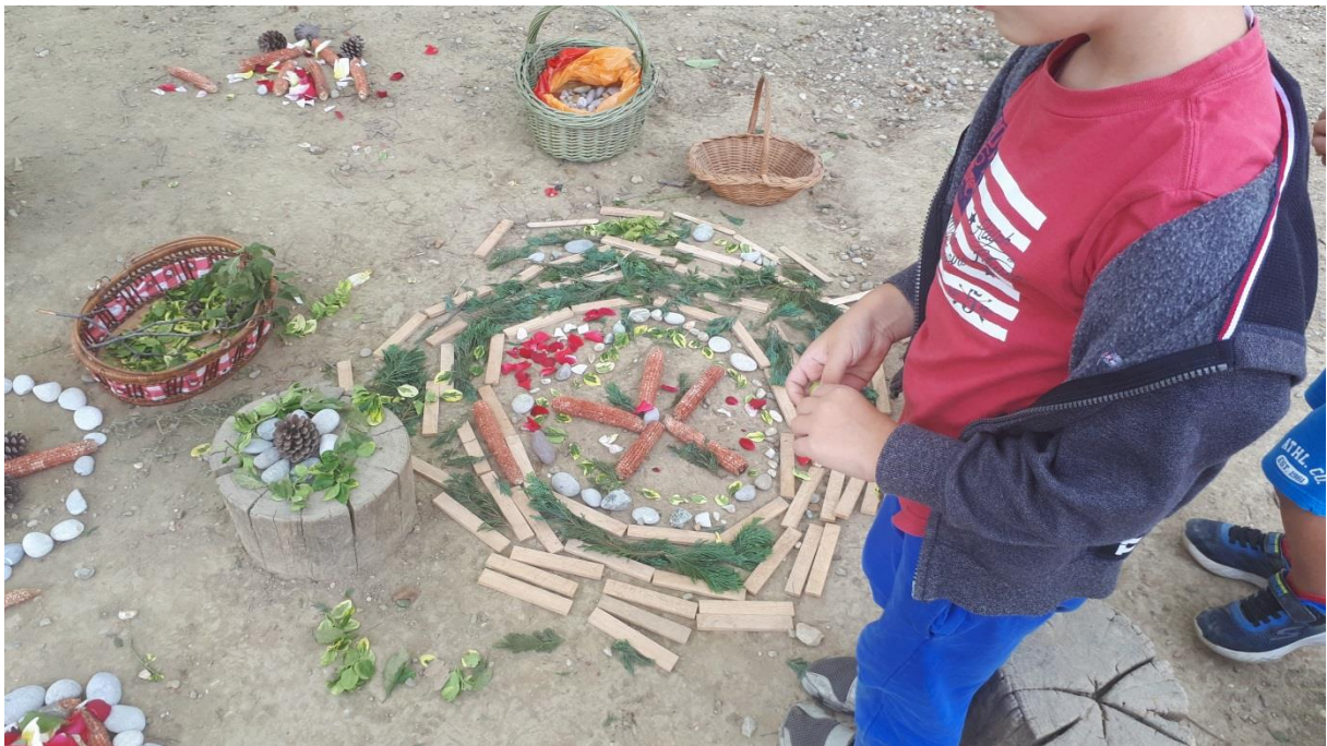
Slika 40. Igra i stvaranje oblika, korištenjem materijala na otvorenom