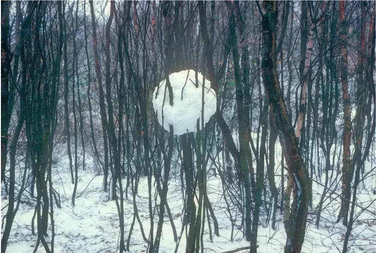
Slika 9. Snowball in tree, izvor https://www.thecollector.com/who-is-andy-goldsworthy/ 23.09.2023