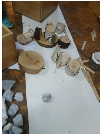
Slika 17 i 18 -stvaranje na podlozi kamenom i oblucima