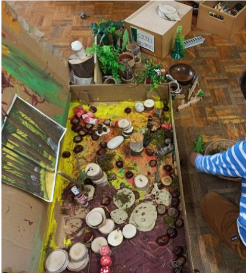
Slika 39- Igra u centru kazališta