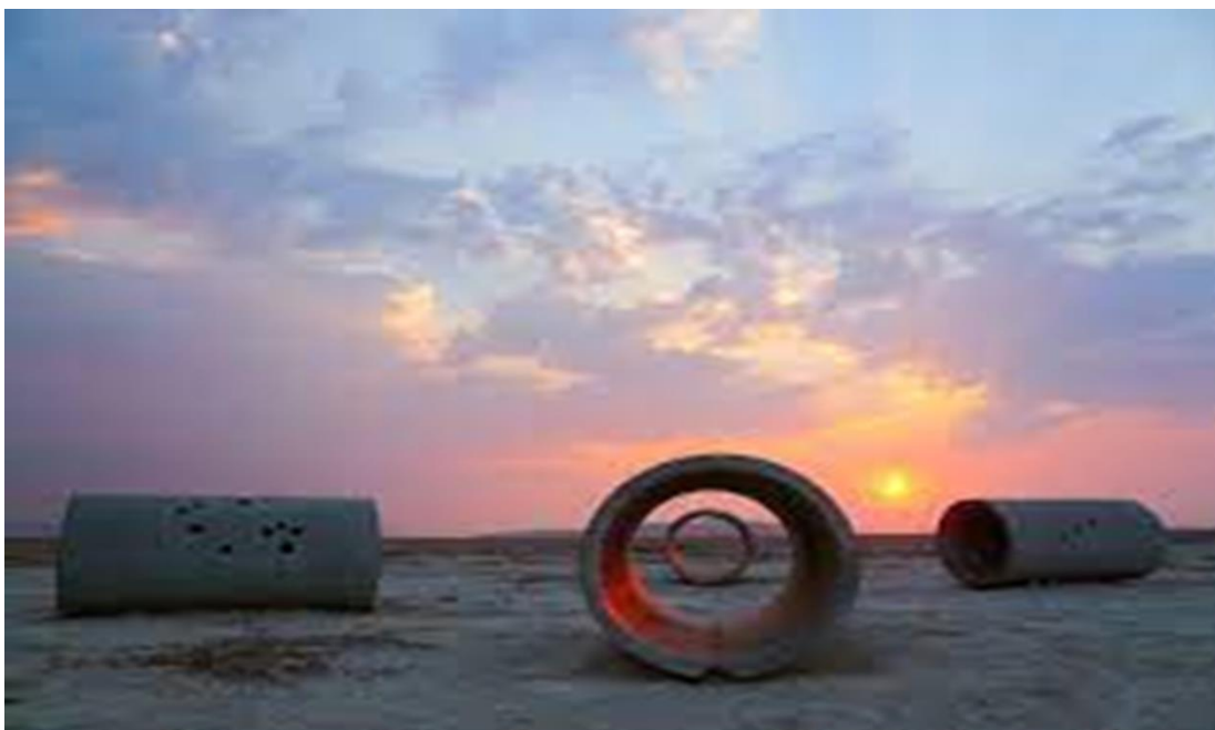
Slika 11. Sunčevi tuneli