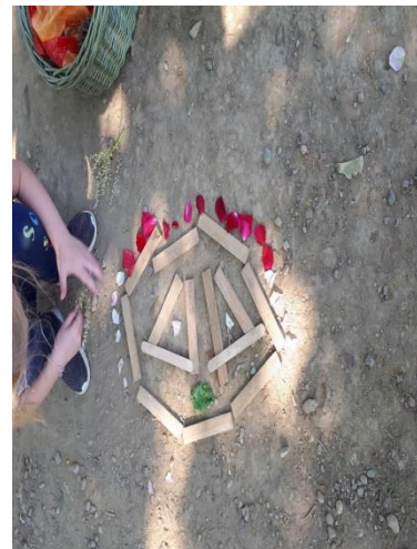
Slike. 30,31,32- Prikaz likova