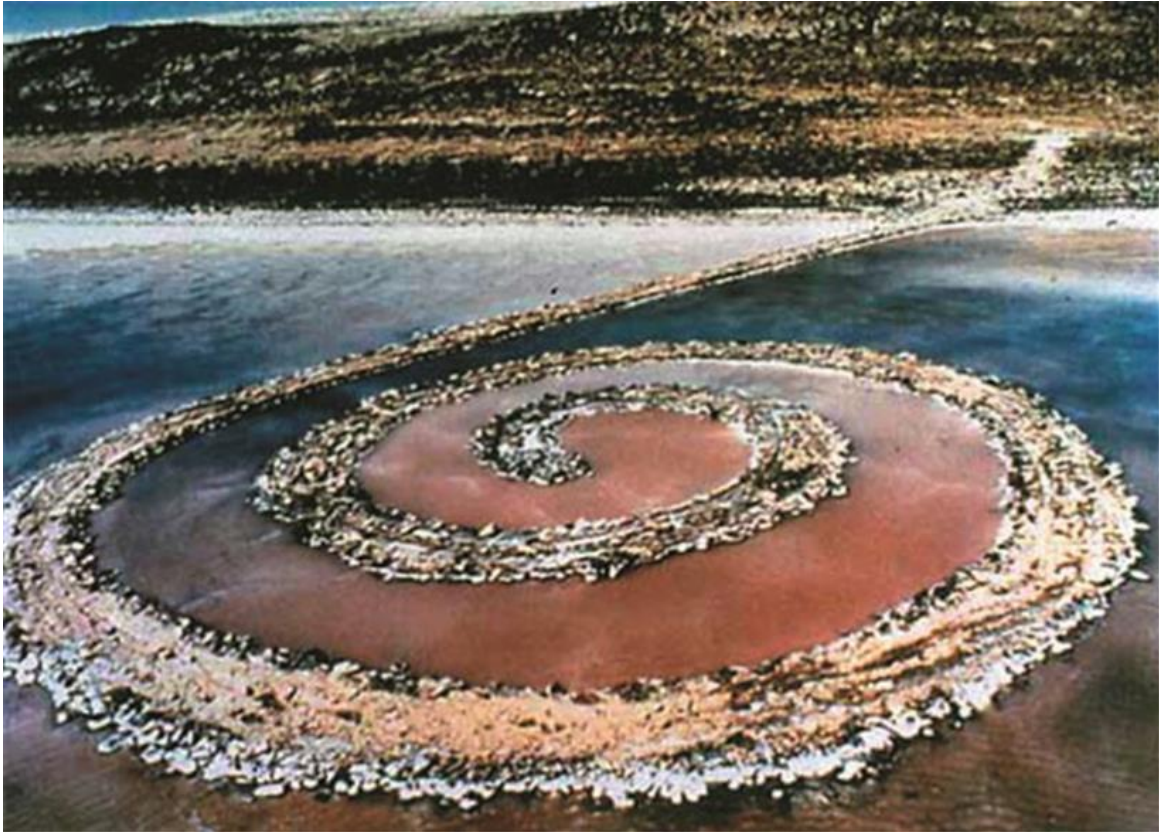
Slika 2. R. Smithson Spiral Jetty, 1970

https://www.theatreartlife.com/artistic/a-short-history-of-the-land-art-earth-art-movement/ 30.6.2023