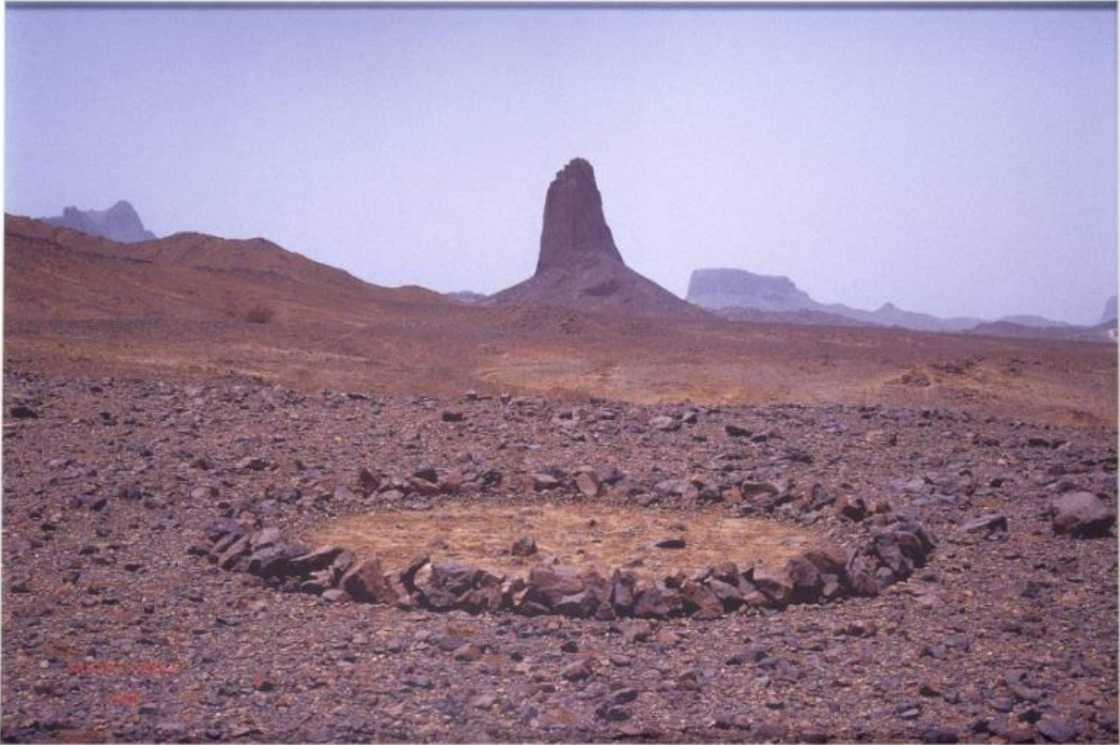
Slika 1. Richard Long CBE, Sahara Circle (1988) https://www.tate.org.uk/art/art-terms/1/land-art 3.7.2023

Umjetnici u svojim intervencijama koriste prirodu, njezin krajobraz kao svoje platno a kamen, zemlju, grančice, vjetar, kišu i sve što nas okružuje, kao osnovno sredstvo u stvaranju umjetničkog djela. Ono je izravna intervencija u krajoliku, transformacija prirode bez okvira, bez stalaka i bez ograničenja. Neke su intervencije trajnije pa se mijenjaju zajedno sa vremenskim prilikama a neke su kratkoročno vidljive.