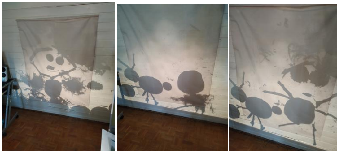
Slike 25,26 i 27 - pričanje priče putem grafoskopa i prirodnih materijala

Ispirirani projektom šuma , pričama i bajkama o stanovnicima iz šume nastaju različiti likovi.