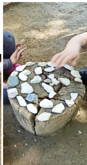
Slike 19,20 i 21- madale i krug