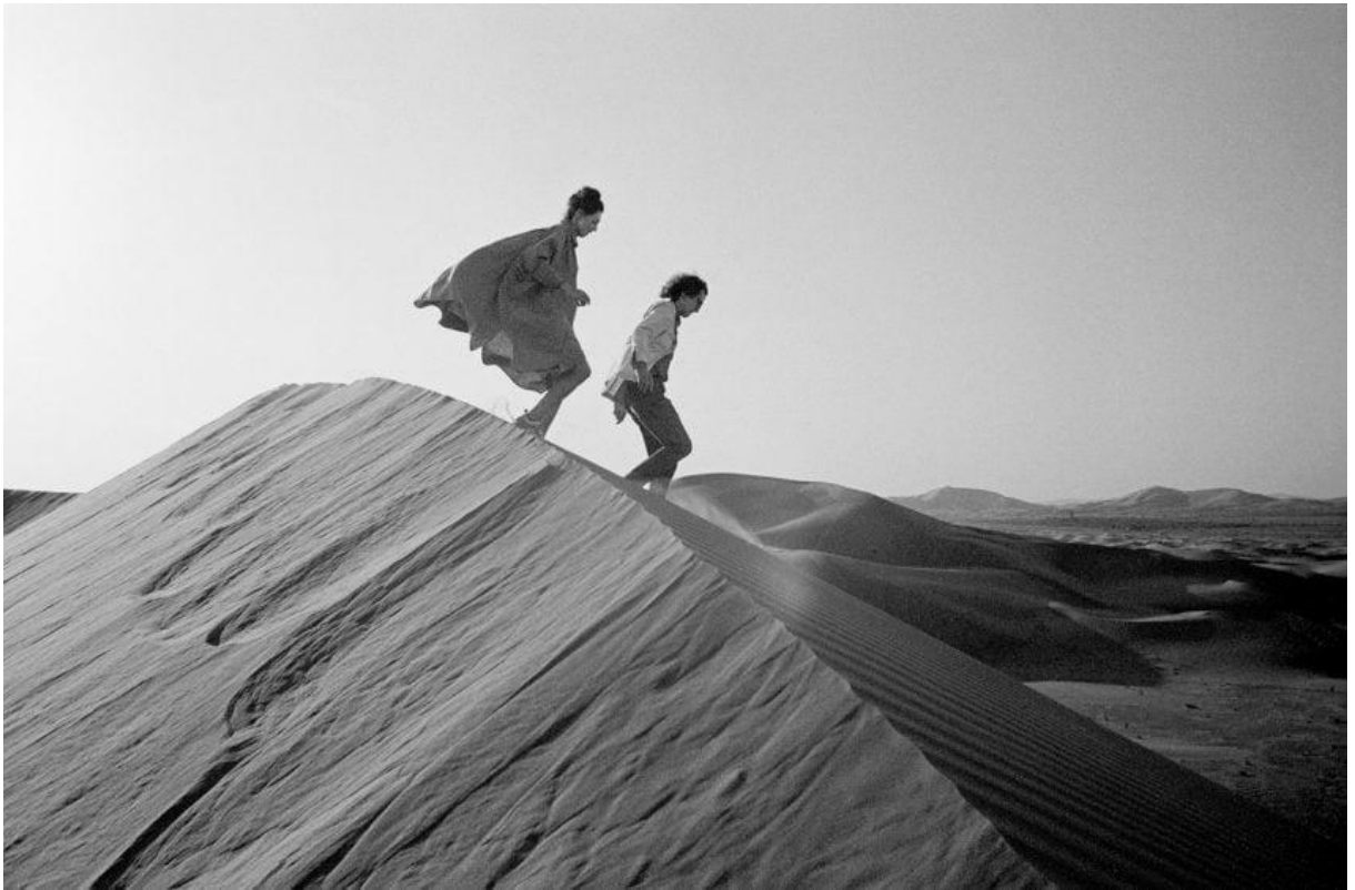
Slika 10. Umjetnici u potrazi za mjestom stvaranja, https://www.dezeen.com/2020/06/01/christo-jeanne-claude-seven-key-projects-installations-design/

603.870 četvornih metara plutajuće ružičaste propilenske tkanine plutalo je po vodi da okruži jedanaest otoka u zaljevu Biscayne u Miamiju.