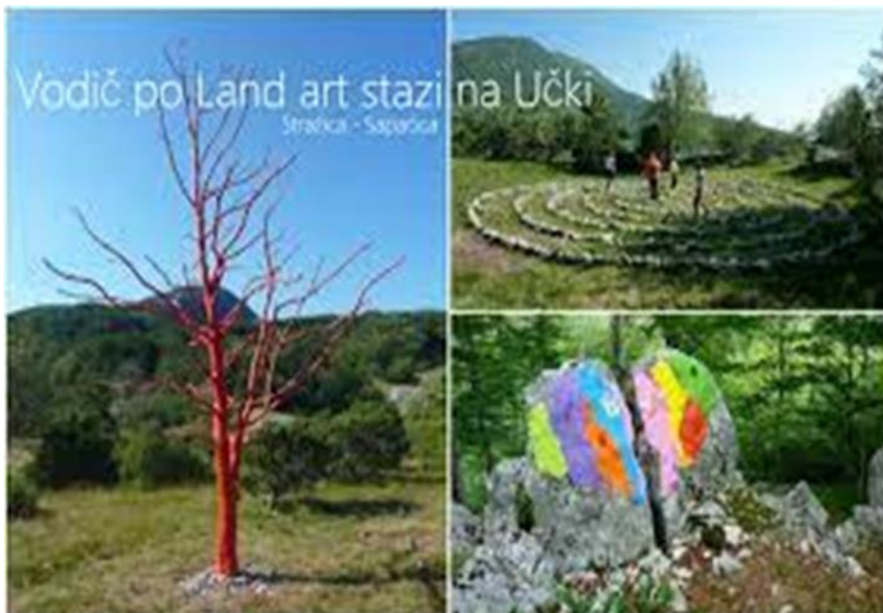
Slika 12. Land art staza na Učki