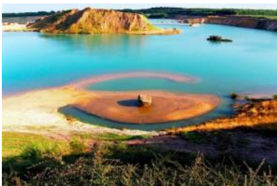
Slika 6. „Broken Circle“, https://proleksis.lzmk.hr/33721/ 30.6.2023