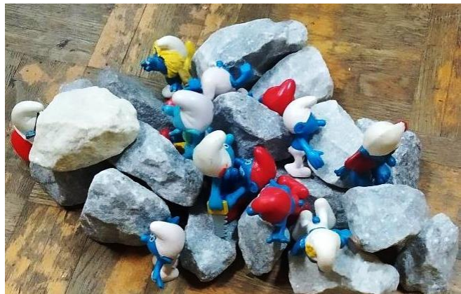
Slika 14- izrada sela za štrumfove