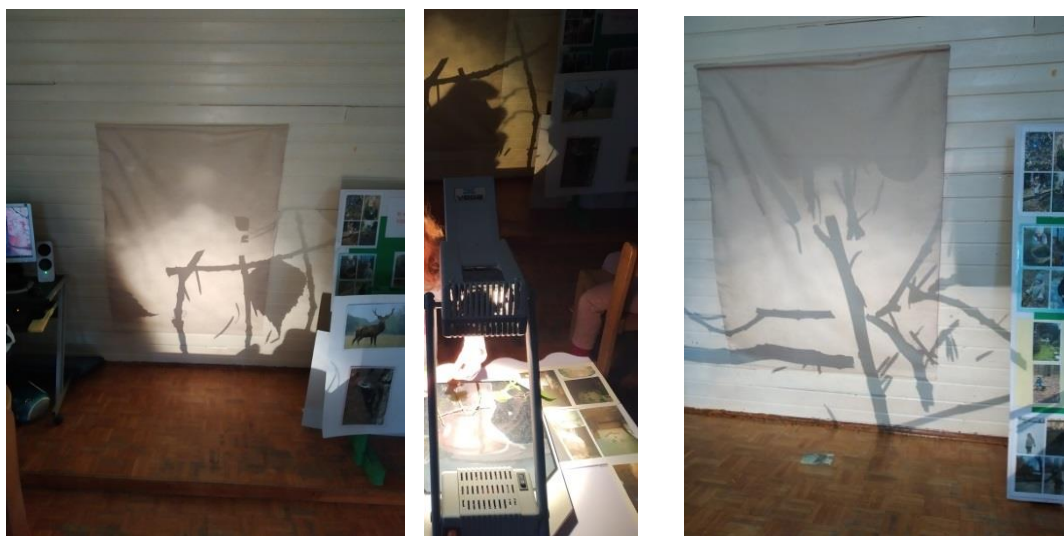
Slike 28, 29 i 30 – Upotreba različitimaterijala inspirirani slikovnicom „Stickman“, Jula Donaldson