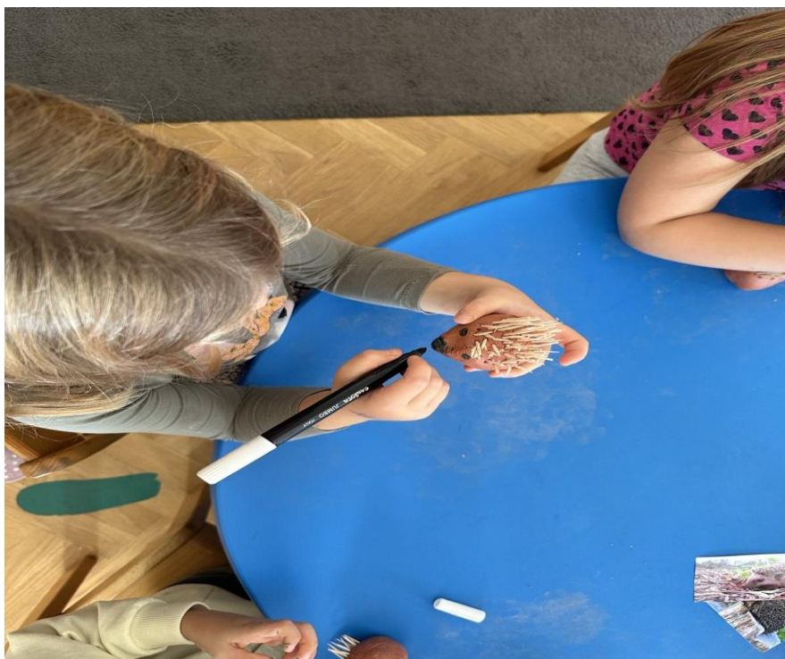
Slike 5, 6 i 7 Likovna aktivnost, modeliranje ježa