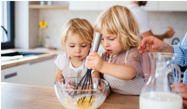
Slika 12. Igra i kognitivni razvoj

U igrama uloga djeca prevladavaju strah, nauče biti svoja i izražavati mišljenje te uključuju maštu i stavljaju se u uloge iz stvarnih odraslih života.