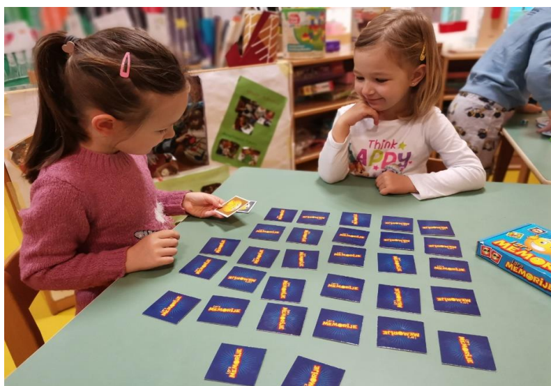
Slika 9. Igra s pravilima

Caillois (1979) sve igre dijeli u četiri kategorije: natjecanja, prilike, simulacije, prijevare. Dvije su podjele igre s pravilima: socijalna integracija i socijalnu diferencijacija. Društvena integracija podrazumijeva učenje normi, zблиžavanje i kontrolu želja. Socijalna diferencijacija odnosi se na odvajanje između članova grupe.