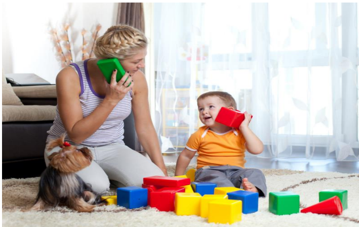
Slika 7. Simbolička igra

Simbolička igra odgovara predoperacijskom mišljenju. Javlja se oko 18 mjeseci i razvija se kao jedinstvena pojava u djetinjstvu. Simbolička igra počinje kada dijete izvodi neku simboličku radnju koju mu roditelj nije pokazao niti je to vidio od njega. Takva igra podržava djetetov razvoj i njegovu sposobnost izražavanja i razmišljanja o vlastitim idejama i osjećajima. Vigotski, Elkonin, Leontjev, Zaporožec i drugi. Simbolička igra se smatra igrom uloga. Igranje uloga je aktivnost u kojoj dijete, preuzima ulogu neke druge osobe i imitira određene situacije. Igre s igranjem uloga povezane su s nekoliko psiholoških procesa: emocionalno, kreativnost, simbolička funkcija, Izvođenje, opći kognitivni razvoj. Piaget ističe tezu da u igri “sve može zamijeniti sve”. Istraživanje Ivića i Davidovića (1972) pokazalo je da mlađa djeca ne mogu igrati ulogu s nestrukturiranim materijalom. Stoga ništa ne može predstavljati ništa u simboličkoj igri, pogotovo za djecu mlađu od 5 godina. Razvijeni oblik igre karakterizira: sadržaj, uloga i pravila, igrova aktivnost, predmeti, razvijeni odnosi među djecom. U simboličkoj igri pravila su specifična i nema određenog redoslijeda igre.