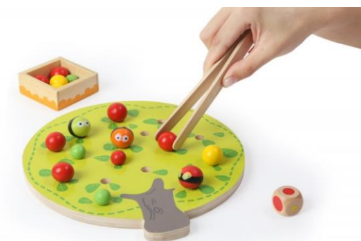
Slika 10. Razvoj fine motorike(hvatanje i prebacivanje kuglica)

Dijete kroz igru razvija fizičku snagu i poboljšava motoričke sposobnosti. Motorika uključuje sitnu i krupnu motoriku te jačanje motoričke koordinacije. Ako dijete ne može koordinirati svoje pokrete vezane uz određenu aktivnost, izbjegavat će te aktivnosti. Dječja igra zahtijeva strpljenje, posebno u igrama u kojima dijete eksperimentira i istražuje. Ako ne znate sami pronaći rješenje, ali vam se gotovo nudi rješenje, onda ne znate zašto i ne možete ga primijeniti na nove situacije. Motorički razvoj temelji se na obrascima kretanja koji se javljaju u prve tri godine života. Motoričke sposobnosti usavršavaju se i mijenjaju zbog tjelesnog razvoja i sve zahtjevnijih zahtjeva okoline. Razvijaju se koštani i neuromuskularni sustav. Dijete uči trčati, hodati, bacati se, penjati se. Motorički razvoj promatramo u dva smjera razvoja: fine motorika i gruba motorika. Fina motorika, koja se odnosi na finije, preciznije pokrete, uključuje manipulativne vještine kao što su hranjenje, igranje, a zatim pisanje i crtanje. Razvoj počinje u djetinjstvu, kada se dijete još smatra dojenčecom, odnosno u prvoj godini života. Dvogodišnje i trogodišnje dijete barata gustim masama, koristi škare, drži olovku, spušta loptice na konac, služi se priborom za jelo, crta prepoznatljive slike.