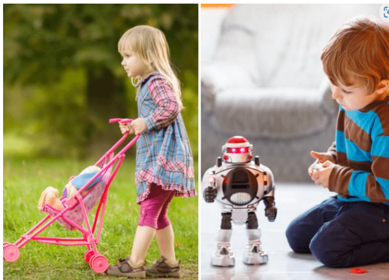
Slika 4. Rodne stereotipne igračke

Ova teorija naglašava kako je uloga okoline važna za razvoj međuljudskih odnosa. Djeca uče pravila vrijednosti društva. Igrom djeca razvijaju znanja i vještine za interakciju sa okolinom. Usvajanje rodni uloga je u prvom planu. Okolina djeci nametne što je spolno prihvatljivo, a što nije. Djevojčice i dječaci uče na drugačiji način. Djevojčice dulje i nepravilnije prihvaćaju rodne uloge od dječaka. Djevojčice se neće kazniti ako se ponašaju kao dječaci, dok se dječaci kažnjavaju za tipično ponašanje djevojčica. Ako se dijete ponaša u skladu sa pravila biti će prihvaćeno od drugih, a ako se neprihvatljivo ponaša s obzirom na spol biti će odbačena. U jasličkoj dobi javlja se sklonost prema igračkama. Tijekom igre dijete bira igračke koje odgovaraju njegovoj rodnoj ulozi, poput lutke za djevojčicu i autića za dječaka, jer su rodno specifičnije. Između drugog i trećeg razreda održavaju se igre uloga u kojima dječaci i djevojčice biraju različite teme. Djevojčice uglavnom biraju obiteljske teme, dok dječaci biraju akcijske igre. Dječacima je važno rješavanje zadatka i natjecanje, a djevojčicama suradnja i pomoć. Dijete treba shvatiti kao jedinku s individualnim karakteristikama, bez obzira na spol. Zadatak odraslih nije definirati spol djeteta, već pustiti dijete da ga samo otkrije. Djevojčicama i dječacima mogu se ponuditi iste igračke bez obzira za koji su spol opredijeljene.