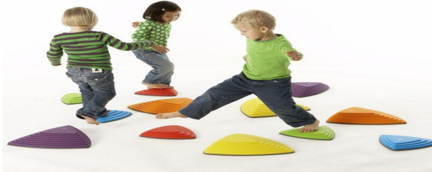
Slika 11. Igra za razvoj grube motorike

vremenom dijete postaje stabilnije i može vježbati nove vještine rukama (bacanje, hvatanje). Koordinacija donjeg i gornjeg dijela tijela gotovo je razvijena u predškolskoj dobi.