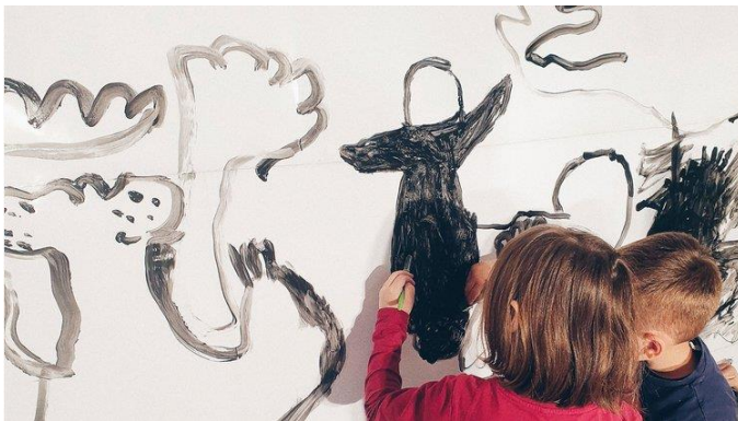
Slika 1. Dječja igra

Igra je aktivnost po izboru djeteta koja je rezultat radosti i zadovoljstva (Lindon, 2001).