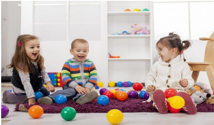
Slika 14. Igra i socijalni razvoj

Ako se djeca ne mogu dogovoriti oko nečega često dolazi do sukoba i njihovo prijateljstvo prestaje. Treća se razina odnosi na djecu srednje i predškolske dobi. To je odnos između djece kojima su podrška, bliskost i razumijevanje najvažniji. Četvrta razina povezana je sa adolescencijom i odraslom dobi. Osnova prijateljstva je ravnoteža između prijateljstva i uzajamnosti, kao i očuvanje individualnosti osobe. Između šeste i osme godine uzajamnost je jednostavna i konkretna. Djeca se međusobno druže kako bi zadovoljili svoje potrebe. U odnosima s vršnjacima dijete uči vještine kao što su : motoričke, emocionalne, kognitivne, komunikacijske. Ako dijete ne zadovolji osnovne potrebe to se odrazi u odrasloj dobi.