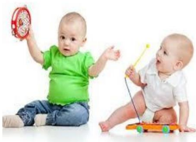
Slika 6. Funkcionalna igra

U takvoj vrsti igre dijete je aktivno i otkriva koliko može podnijeti i kako pomaknuti svoje granice da bi moglo podnijeti još više. Dijete se igra jer mu je zabavno i jer pronalazi zadovoljstvo u usvajanju novih vještina.