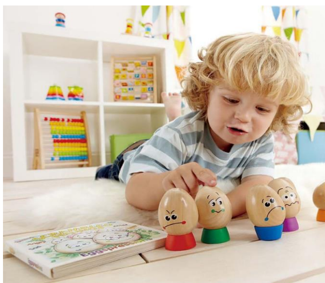
Slika 13. Igra i emocionalni razvoj

O emocijama dijete uči kroz igru, komunicira s ostalima. Dijete staro tri ili četiri mjeseca pokazuje tugu i ljutnju te izražava gađenje. Anksioznost se javlja oko sedmog mjeseca (Vasta i sur., 2005). Kada dijete shvati emocije tj. njihovo značenje počinje ih primjenjivati u odnosu s roditeljima.