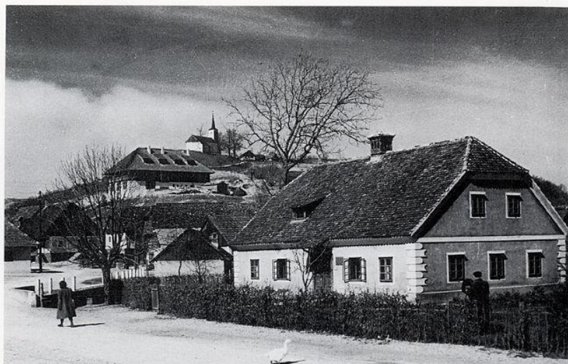
Slika 3. Rodna kuća Josipa Broza Tita, u pozadini je hotel "Kumrovec", kasnije Titova rezidencija, a iznad toga je kapela sv. Roka. 9