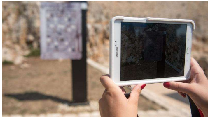
Slika 1. Proširena stvarnost na tvrđavi Barone

Po obnovljenoj utvrđi postavljene su „target“ ploče koje aktiviraju pametne naočale koje posjetitelj nosi i učitavaju scenarij za određeno područje tvrđave (Štrbinić, 2017). Korištena je tehnologija proširene stvarnosti kroz koju korisnici upoznaju povijest Šibenika, izgradnju utvrde, poznate bitke i sl., a kroz priču vode dva virtualna lika, dječak Jure i povjesničar Frane Divinić.