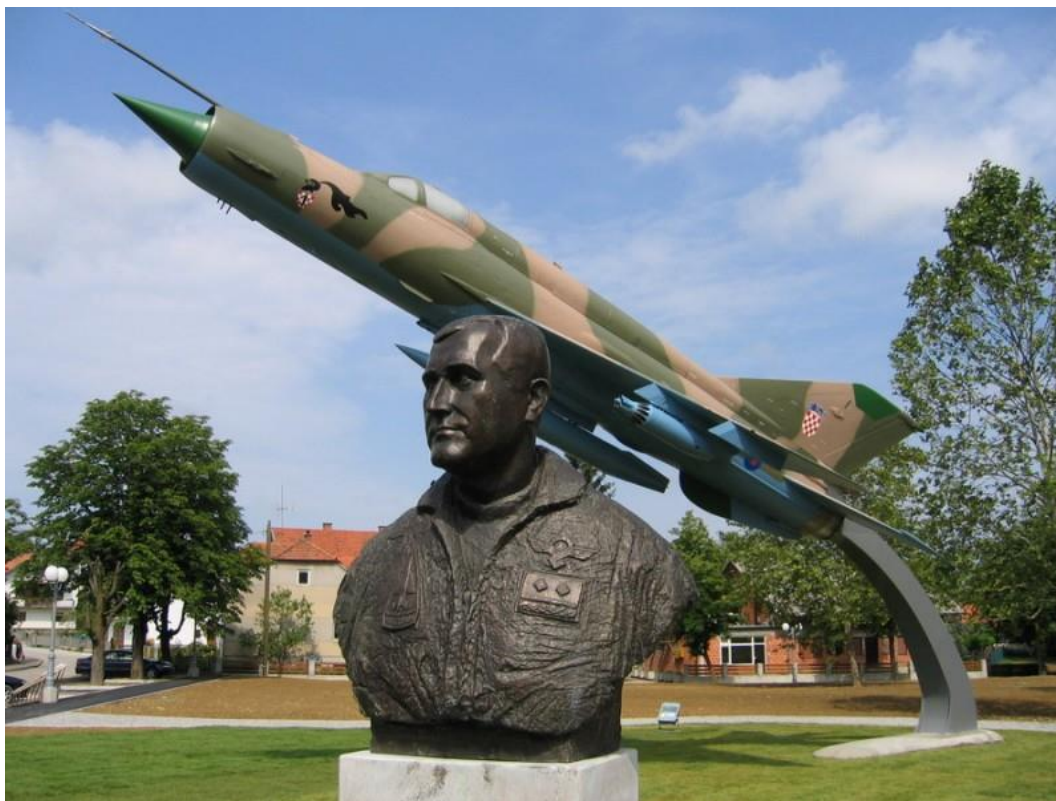
Slika 5. Spomen park Rudolfu Perešinu