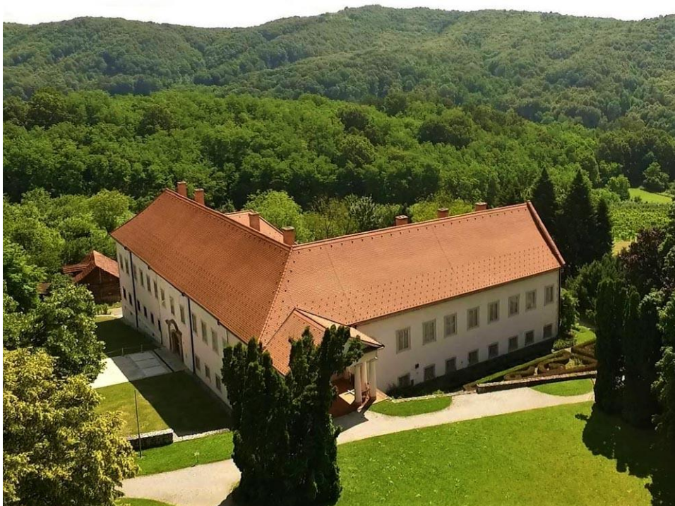
Slika 4. Dvorac Oršić

Do 1924. godine, bio je privatna rezidencija, nakon čega su ga napustili posljednji članovi obitelji Oršić te ga kupuje gornjostubička seljačka zadruga. Od 1945. do 1970. godine, dio prostorija dvorca služio je kao osnovna škola. Nakon 1942. Godine, nazvan je Gupčevim domom, iako nema izravne veze sa Seljačkom bunom. Krajem 60.-ih i početkom 70.-ih godina 20. stoljeća dvorac kreće u obnovu te je u njemu 1973. godine otvoren Muzej seljačkih buna.