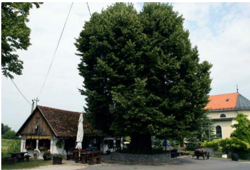
Slika 2. Gupčeva lipa