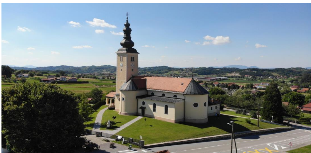
Slika 3. Crkva sv. Jurja Mučenika

U samom centru Gornje Stubice, smjestio se trg sv. Jurja, gdje se nalazi već obnovljena kapelica sv. Ivana Krstitelja, izgrađena u baroknom stilu iz 18. stoljeća. U blizini trga, nalazi se park koji je, 24. lipnja 2004. godine, otvoren u čast Rudolfu Perešinu te se i danas tako zove; Spomen park Rudolfu Perešinu. U parku nalazi se pilotova statua i konzervirani MIG-21 koji je došao iz remontnog zavoda u Velikoj Gorici.