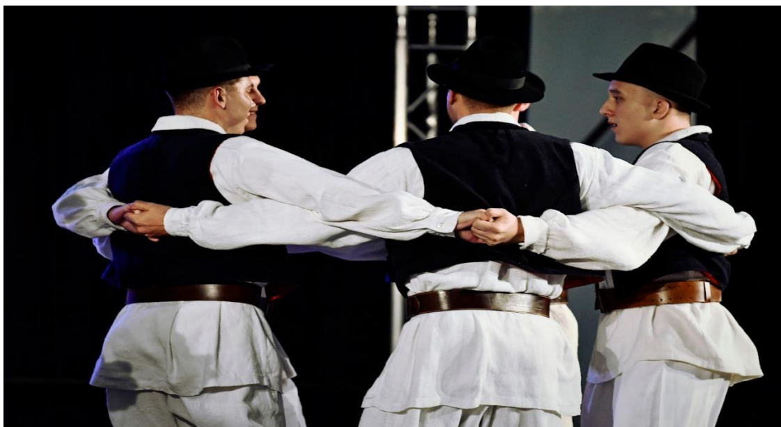
Slika 6. Prikaz držanja