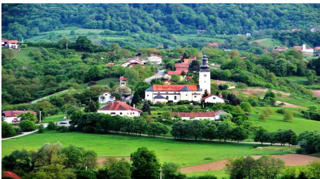
Slika 1. Fotografski prikaz općine Gornja Stubica

Općina Gornja Stubica osnovana 1993. godine, smještena je na sjevernim obroncima park-šume Medvednice s površinom od 50 km 2 . Po posljednjem popisu stanovništva iz 2001. godine, općina Gornja Stubica imala je 5.726 stanovnika. Najnaseljenija su područja u središnjem dijelu općine. Gornja Stubica prvi puta se spominje davne 1209. godine, smatra se da je to prvi pisani dokument u kojem se spominje mjesto a i župa Sv. Jurja. (Općina Gornja Stubica, n.d.)