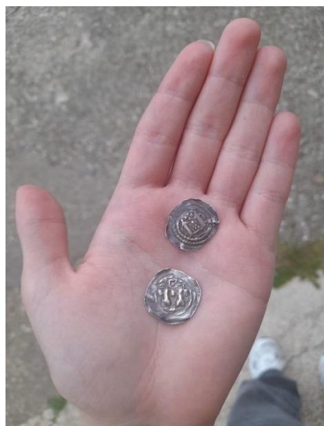
Slika 10. i 11. Prikaz srebrnih novčića