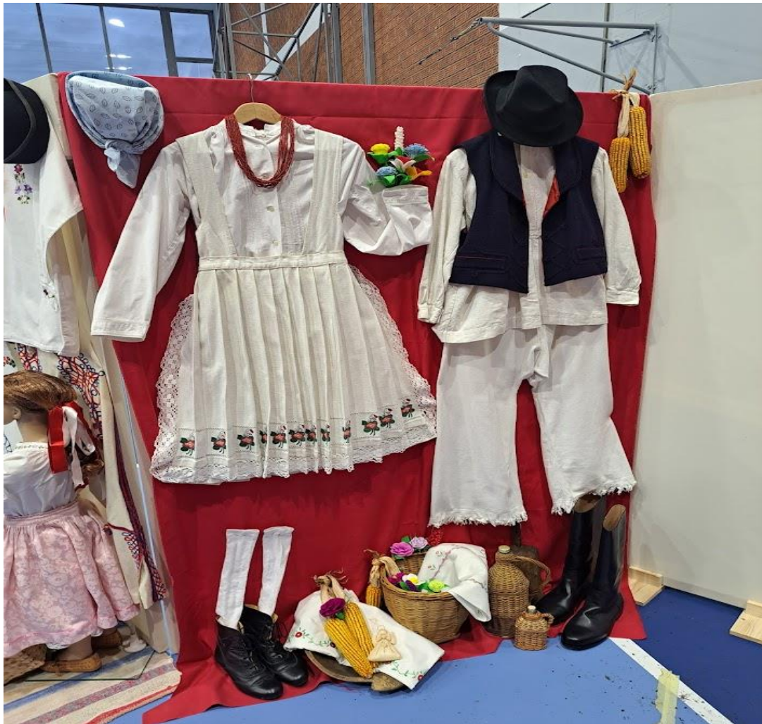
Slika 5. Prikaz ženske i muške zagorske narodne nošnje

KUD „Matija Gubec“ posjeduje svoje nošnje no nije ni to bio laki proces. Pri osnivanju društva došlo je do problema što s nošnjama. Žene su odlazile u sela i tražile nekoga tko zna sašiti nošnje. U selu Brezju našle su staru gospođu koju su zvali Bučanica, donijele su joj platno od kojega će sašiti nošnje. Velika je odgovornost oko nošnji i to pogotovo njihovo održavanje. Uvijek se vodi briga na urednost, čistoću i na način oblačenja kako su ih i prije oblačile naše prabake.