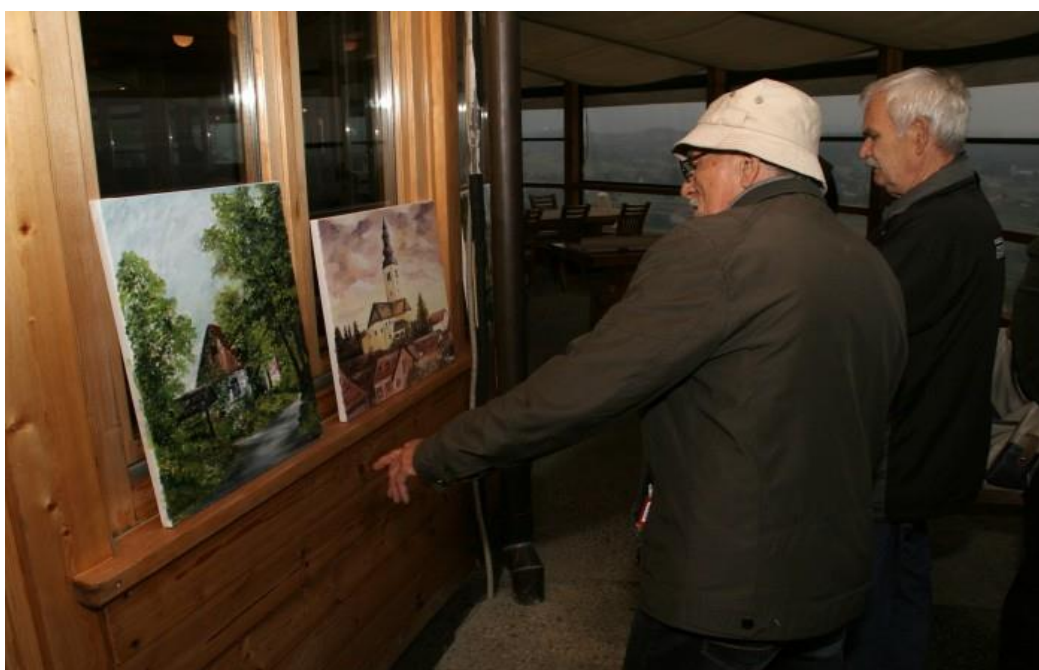
Slika 3. Humanitarna izložba radova Likovne radionice „Lipa“

Danas likovna sekcija broji oko 30-ak članova, a bave se likovnom i kiparskom stvaralaštvom. Članovi održavaju samostalne izložbe ali i izložbe koje su postale tradicionalne: Jurjevska izložba , Božićna izložba minijatura i likovna kolonija „Lira Lipa“ . Likovna radionica redovito surađuje i s drugim udrugama na području općine Gornja Stubice ali i s udrugama diljem Hrvatske koje su istog ili sličnog karaktera. Voditelj je Juraj Lukina, sjedište radionice je u društvenom domu u Modrovcu, a izložbe se odvijaju najčešće u Galeriji Lipa u Gornjoj Stubici. (Članovi KUD-a „Matija Gubec“, 2019.)