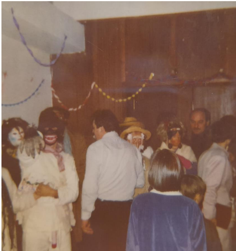
Slika 9. Okupljanje maškara

Dok su muškarci obilazili kuće, žene su pripremale jela koja su se obavezno morala nalaziti na fašničkom stolu. Neki ljudi su govorili da se taj dan mora pripremiti oko 9 jela, tako da zlo ne dođe u kuću. Najčešće se pripremalo: masni žganci, pečena svinjska rebra, krafne, pečena jaja, kiselo zelje, pogačice, kokošja juha i pečena kokoš.