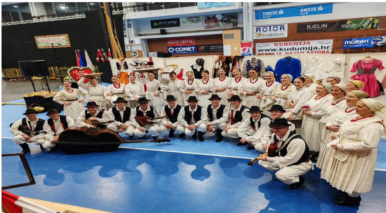
Slika 4. Starija mješovita skupina i tamburaški sastav na 15. večeri nacionalnih manjina u Bjelovaru

Folklorna sekcija djeluje u četiri grupe prema uzrastima, od 6 do 100 godina i tamburaški sastav.