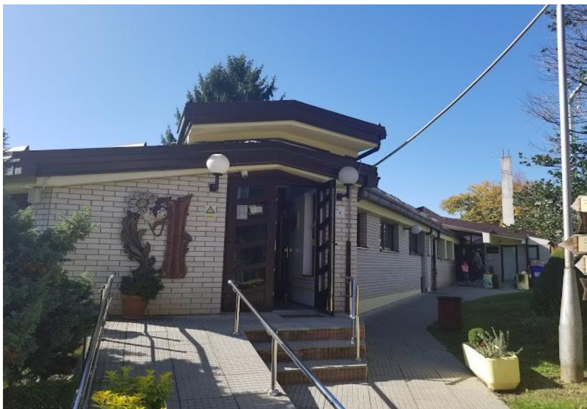
Slika 8: Čški dječji vrtić Ferde Mravenca Daruvar

načine kao što su: jezično, likovno, glazbeno, filmsko, scensko i plesno stvaralaštvo. (Godišnji plan i program rada Čškog dječjeg vrtića Ferde Mravenca Daruvar u pedagoškoj godini 2023./2024.)