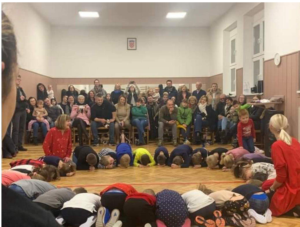
Slika 7: Mala Holubička 2024.

Odgajatelji u češkom dječjem vrtiću se kontinuirano stručno usavršavaju kako bi bili kvalificirani za rad u suvremenim predškolskom izazovima. Redovito sudjeluju u edukacijama, uključujući simpozije o češkom jeziku, gdje od čeških predavača uče o pravilnom govoru i pisanju češkog jezika. Također se educiraju o utjecaju hrvatskog jezika na pripadnike češke nacionalne manjine u Hrvatskoj. Ovaj kontinuirani profesionalni razvoj omogućuje odgajateljima da usvoje najnovije pedagoške metode i pristupe kako bi sva djeca u vrtiću bila kvalitetno odgojena.