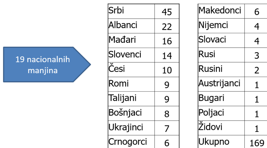
Slika 3: Broj predstavnika nacionalnih manjina po nacionalnim manjinama

Prava vijeća nacionalnih manjina u jedinici samouprave: