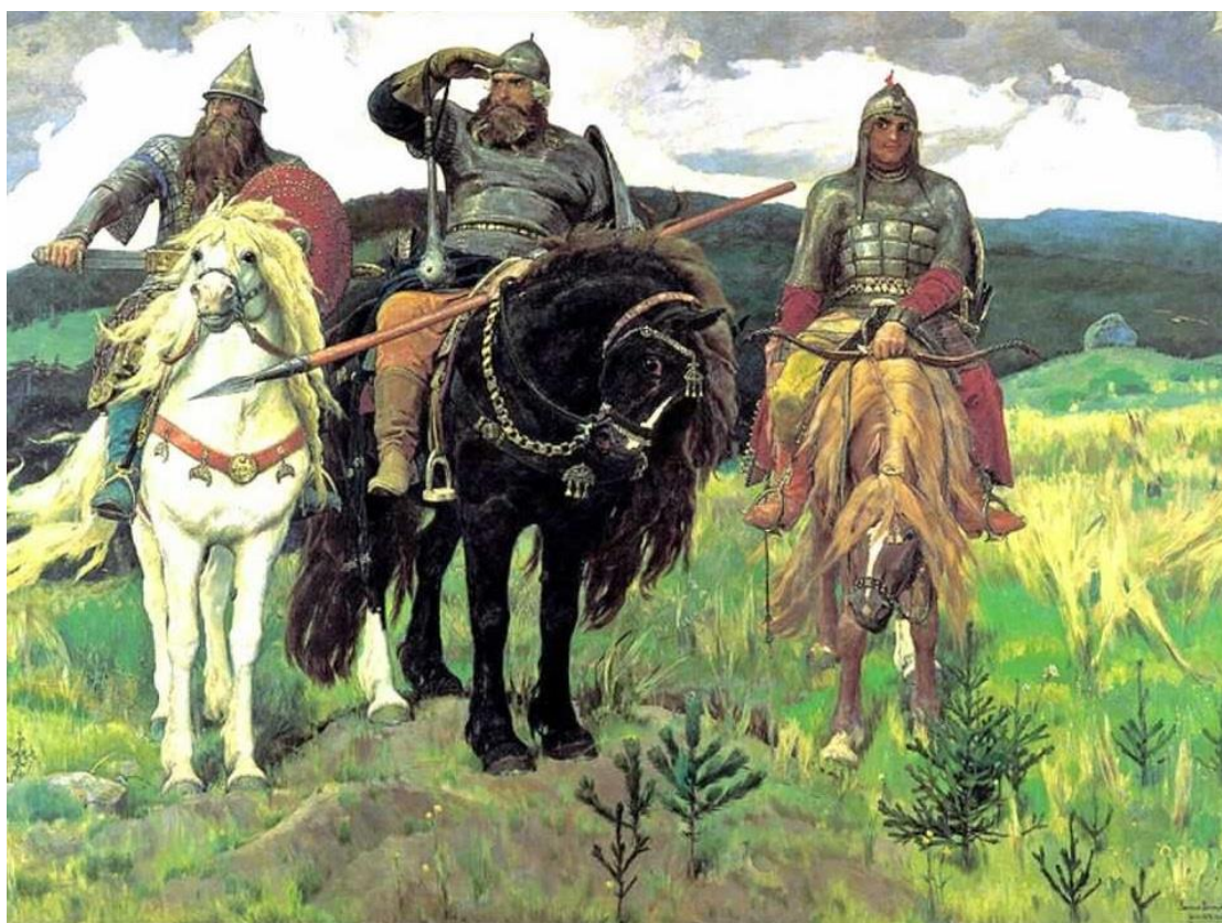
Slika 5: Čeh, Leh i Meh