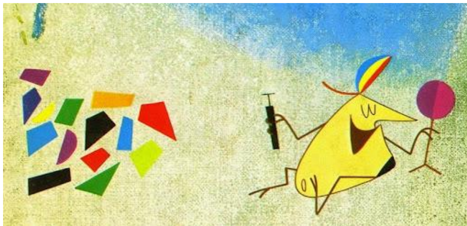
Slika 2. Animirani film “ Surogat”

Ljudi su oduvijek isprobavali, odnosno pokušavali stvoriti animacije. U svijetu se javila Zagrebačka škola crtanog filma. Ona je stilska figura u razvoju animiranog filma. Pritom je potrebno istaknuti najpoznatijeg autora Dušana Vukotića.