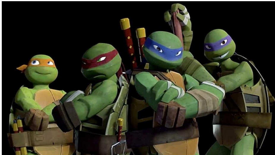
Slika 6. Prikaz vanjskog izgleda likova

Likovi u animiranom filmu dijele se u dvije kategorije: dobre i loše, pri čemu su loši likovi često prikazani u estetski lošijem svijetlu (Čorić, 2020). U animiranom filmu likovi su specifične vanjštine - često imaju naglašene oči i usta, koji su u neravnomjernom odnosu (Kovačević, 2020).