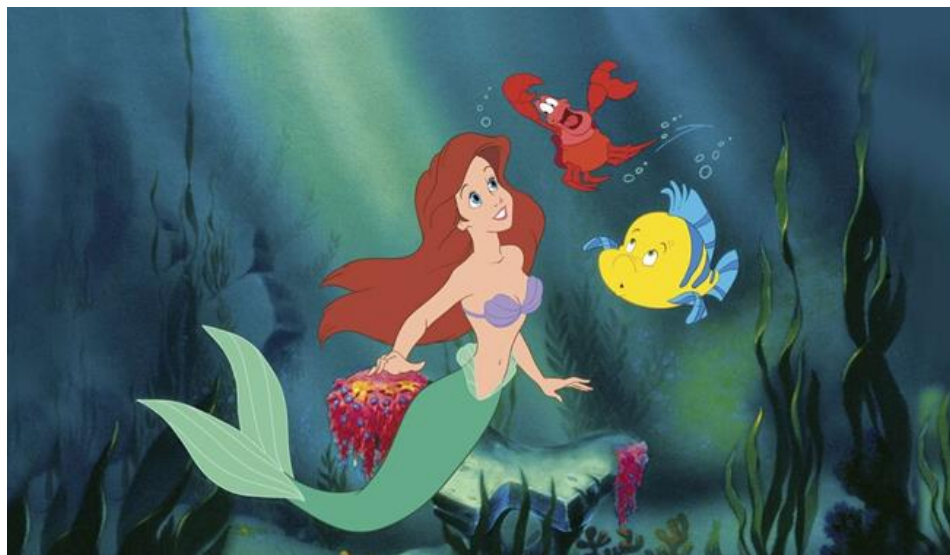
Slika 4. Animirani film “Mala sirena”

U negativne sadržaje ubrajaju se elementi seksualnosti (Laniado i Pietra, 2005). Takvi elementi vežu se uz npr. uz animirani film “Mala sirena” (Slika 4.).