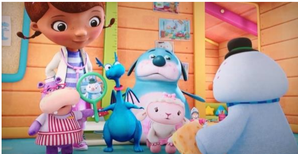
Slika 3. Crtani film “Doktorica Pliško”

Kao kvalitetni animirani film, Hrnjić Kuduzović i Čičkušić (2020) navode animirani film “Doktorica Pliško”. Scena iz tog animiranog filma prikazana je na slici 3.