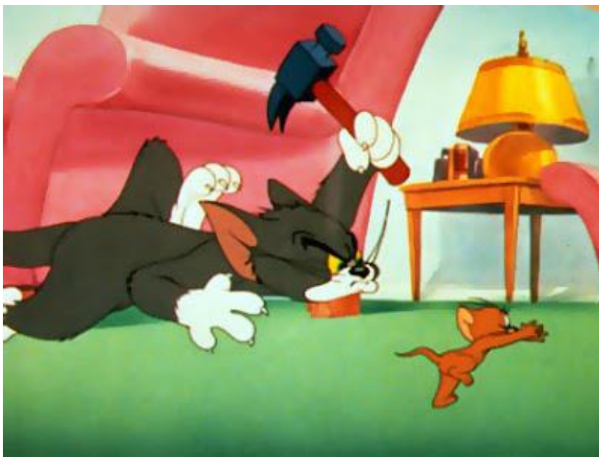
Slika 5. Nasilje u animiranom filmu „Tom i Jerry“

Poznati crtani film današnjice je „Tom i Jerry“. Prikazuje trojicu likova, mačka Toma, miša Jerrya i psa Spikea. Film je prepun nasilnih prizora (Pašić i Zečević, 2014). Likovi u crtanom filmu stalno se sukobljavaju.