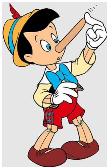
Slika 8. Antropomorfizirani lik “Pinokio”

Ženski likovi u animiranim filmovima često se prikazuju stereotipno (slika 7.): uvijek su jako lijepog izgleda, nesamostalne, podređene. Prikazane su kao lijepi ukras mužu (Mytnik, 2018). Uz takav prikaz junakinje, vidljivo je odsustvo osjećaja i mentalnih karakteristika (Dumin, 2014, prema Mytnik, 2018).