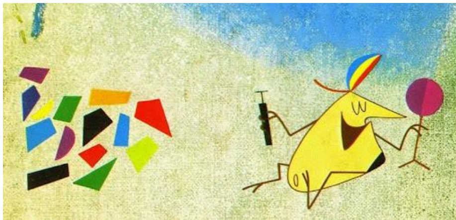
Slika 2. Animirani film “ Surogat”

Ljudi su oduvijek isprobavali, odnosno pokušavali stvoriti animacije. U svijetu se javila Zagrebačka škola crtanog filma. Ona je stilska figura u razvoju animiranog filma. Pritom je potrebno istaknuti najpoznatijeg autora Dušana Vukotića.