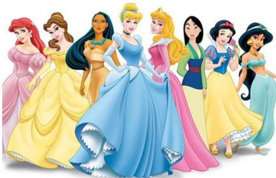
Slika 7. Stereotipni prikazi ženskih likova u animiranim filmovima

Ženski likovi u animiranim filmovima često se prikazuju stereotipno (slika 7.): uvijek su jako lijepog izgleda, nesamostalne, podređene. Prikazane su kao lijepi ukras mužu (Mytnik, 2018). Uz takav prikaz junakinje, vidljivo je odsustvo osjećaja i mentalnih karakteristika (Dumin, 2014, prema Mytnik, 2018).