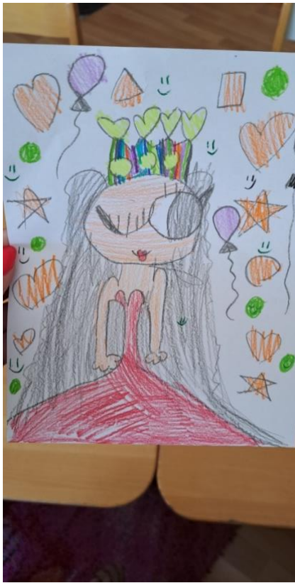
Opis fotografije 6.: Djevojčica K.V. nacrtala je kraljevnu kao omiljeni lik iz priče. Komentar djeteta: „Vidiš teta, tu ti je kraljevna i vesela je jer se bude ženila.“