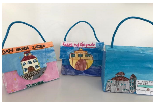
Slika 4. Torbice oslikane znamenitostima grada Zadra - likovni izričaj učenika 3. razreda osnovne škole (Osnovna škola Šime Budinića Zadar, bez dat.)