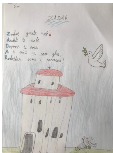
Slika 3. Literarni i likovni izričaj (crkva Sv. Donata) učenika 3. razreda osnovne škole (Osnovna škola Šime Budinića Zadar, bez dat.)

U Osnovnoj školi Šime Budinića iz Zadra povodom Dana grada Zadra i njegovog zaštitnika Sv. Krševana, učenici 3.a razreda imali su zadatak da svojim likovnim izričajem obilježe taj svečani dan. U sklopu nastave Hrvatskog jezika, pored crteža, svom su gradu napisali i stihove. Cilj je bio osvijestiti učenike o važnosti razvoja ljubavi i prijateljstva, te potrebe za poetskom riječi, maštom i kreativnošću. Također, cilj je bio i razviti kod učenika sposobnost pravilne komunikacije, likovne i pisane, tako da primjene do tada stečeno znanje i razviju sustavnost u crtanju i pisanju. Na Slikama 3. i 4. može se vidjeti rezultat kreativnosti učenika. Na crtežu na kojem su oslikali poznatu crkvu Sv. Donata u Zadru napisali su stihove posvećene gradu Zadru. Kreativnim stvaralaštvom okušali su se u pisanju akrostiha. Od kartona i papira izradili su i torbice koje su kreativno oslikali prikazujući znamenitosti po kojima je grad prepoznatljiv (Osnovna škola Šime Budinića Zadar, bez dat.).