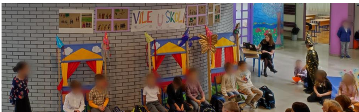
Prva scena: Učiteljica ispituje učenike.