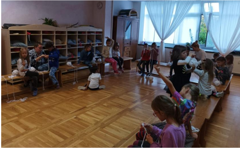
Slika 8. Pletenje