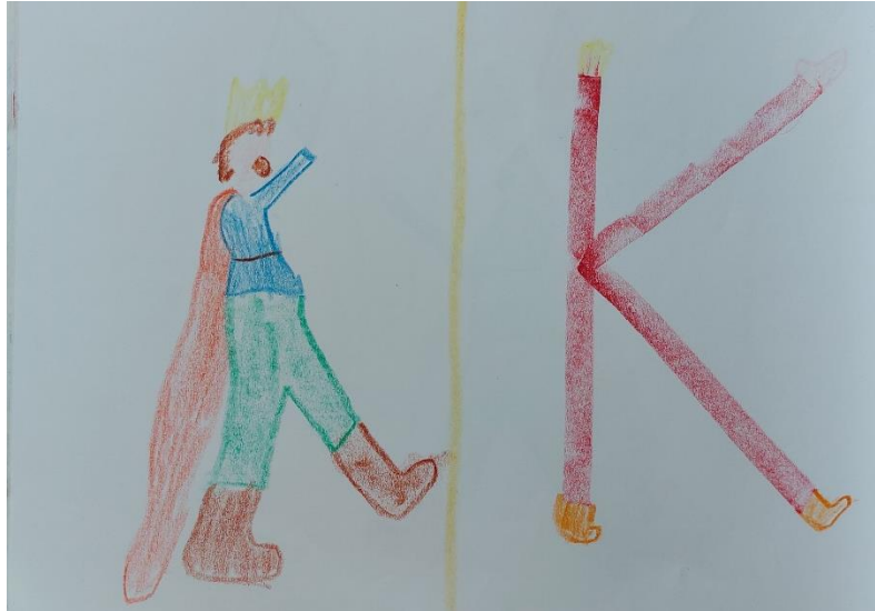
Slika 5. Učenikov crtež kralja Krunoslava i pisanje slova K

- spremanje stvari u torbu, učiteljica započinje uz pjesmu i pridružuju joj se učenici: