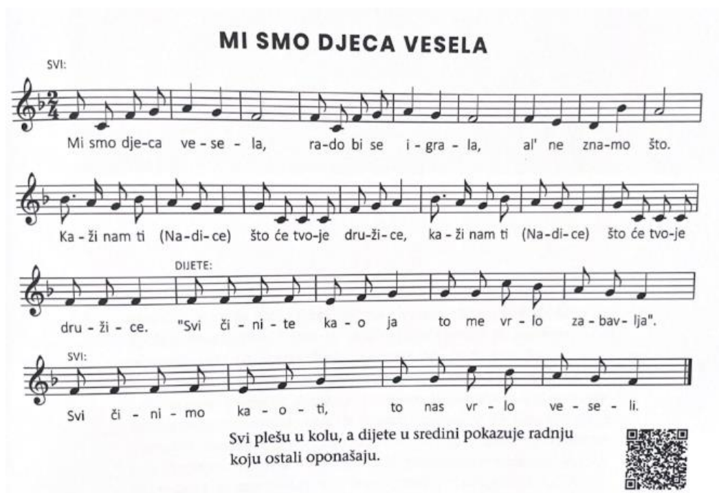
Slika 2 Primjer glazbene igre s pjevanjem (Kraljić, 2023, str. 67)

U pjesmi „Mali ples“ učenici izvode pokrete koji prate sadržaj teksta pjesme. Učitelj može osmisliti za svaku strofu pokrete popraćene radnjom u tekstu. Pokreti će u cjelini činiti plesnu koreografiju u kojoj će učenici aktivno slušati koji pokret dolazi sljedeći.