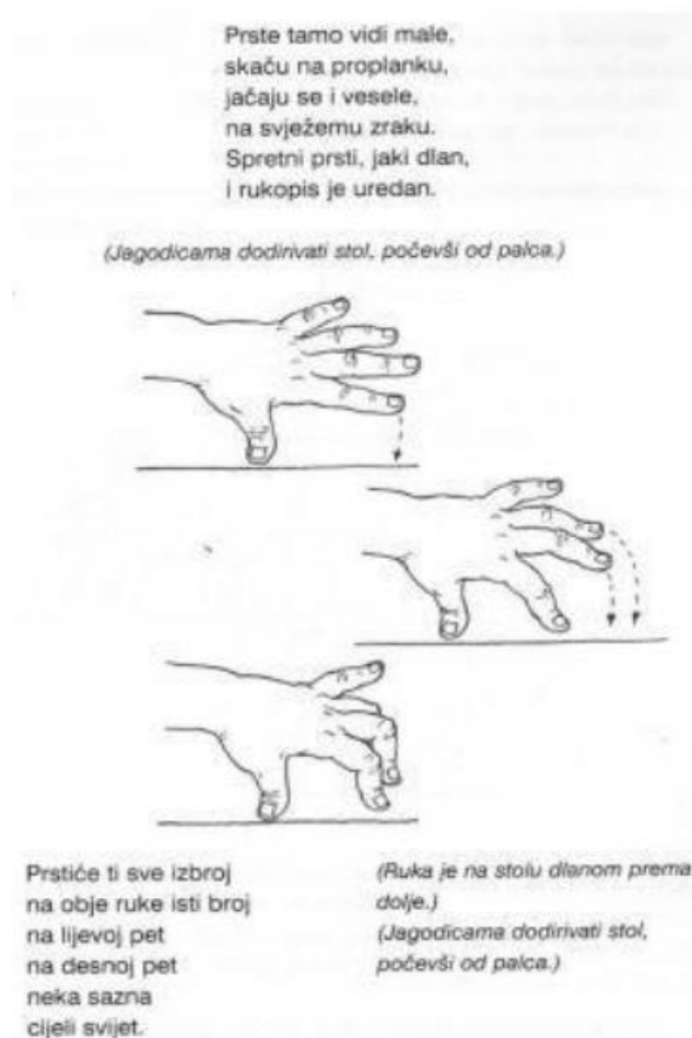
Slika 1. Vježba 1 (Osmanova, 2010, str. 53)

klaviru, dolazi do iste situacije u kojoj se ističe pravilan položaj prstiju, tj. pravilno dodirivanje klavijature jagodicama prstiju.